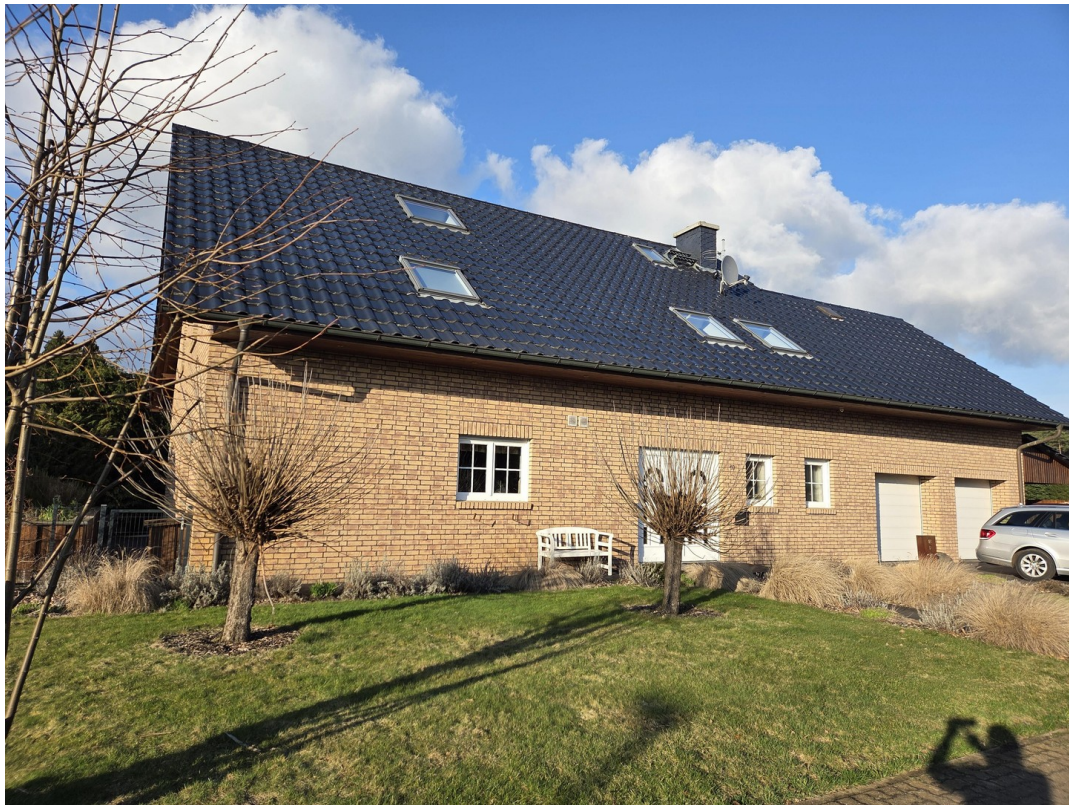
Vorderansicht mit Garagen