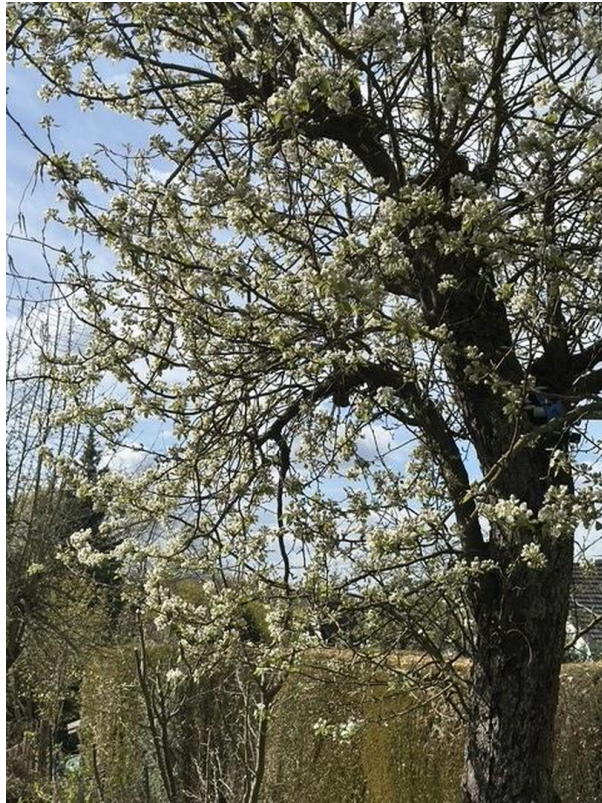
Blühender Baum im Garten