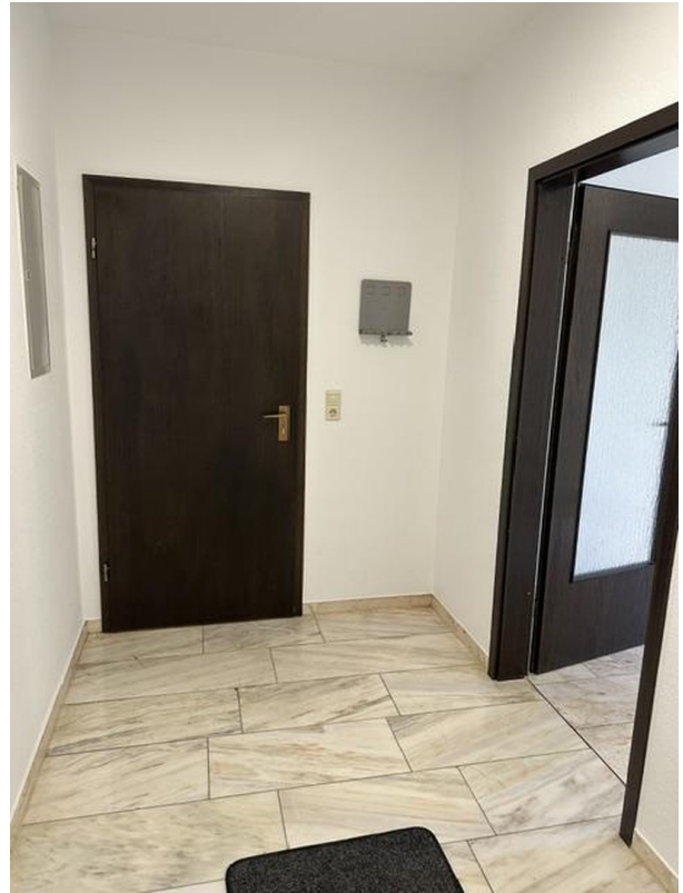
Flur rechts Tür zum Schlafzimm