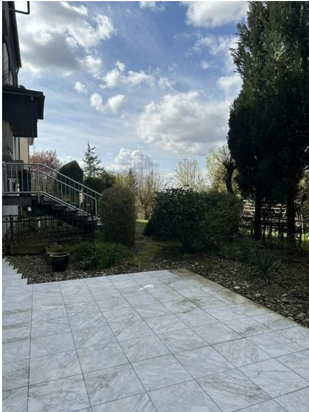
Blick von der Terrasse zum Gar