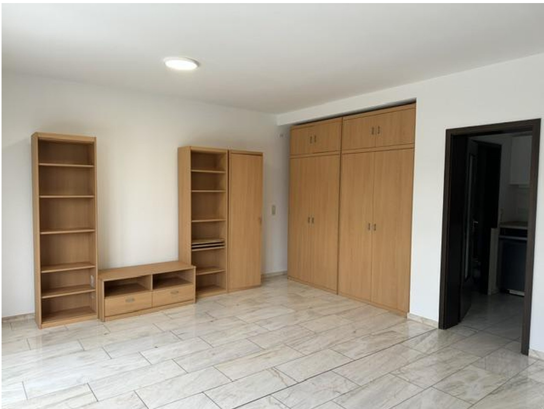
Wohnzimmer. Rechts Eingang zur