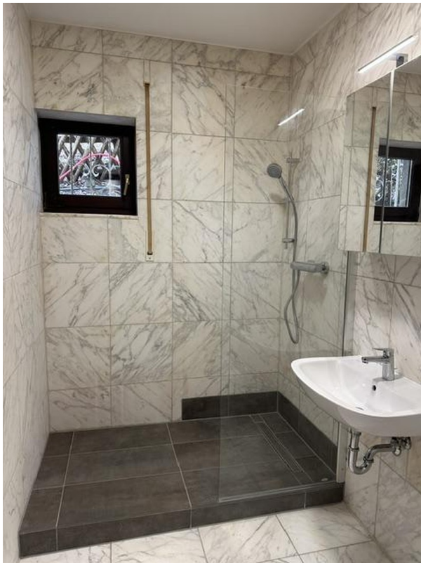
Bad mit Walk-in Dusche u neuen