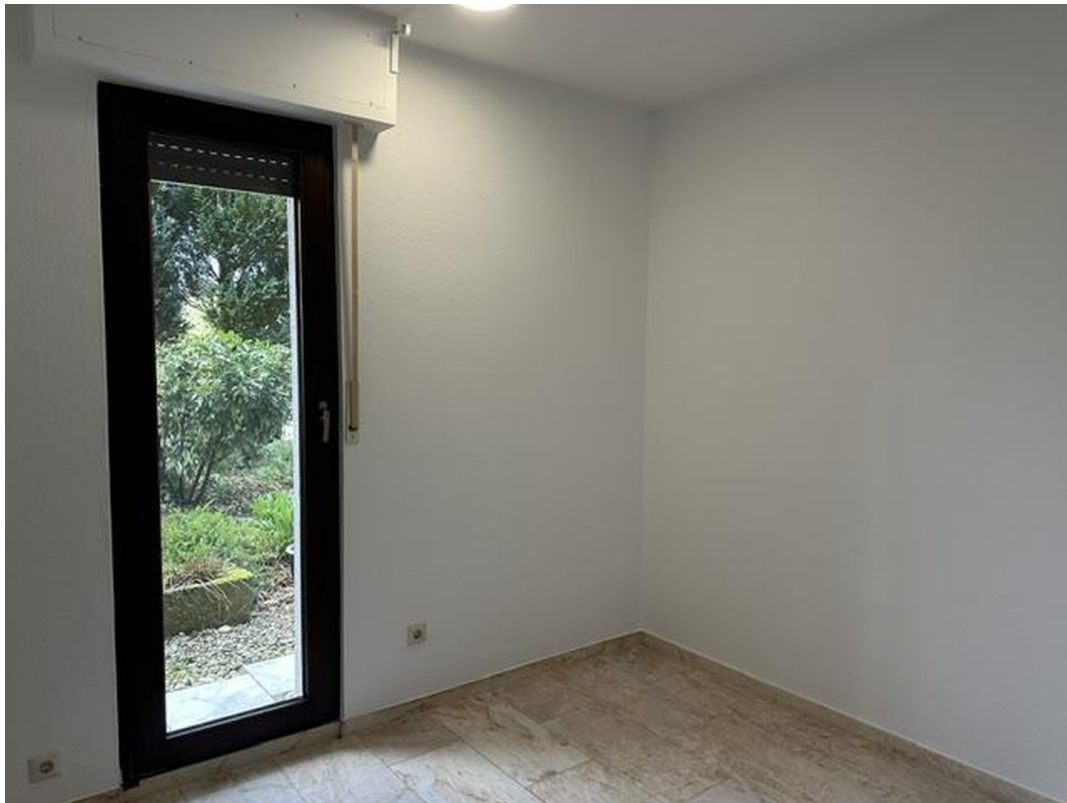
kleiner Schlafrum mit Blick z