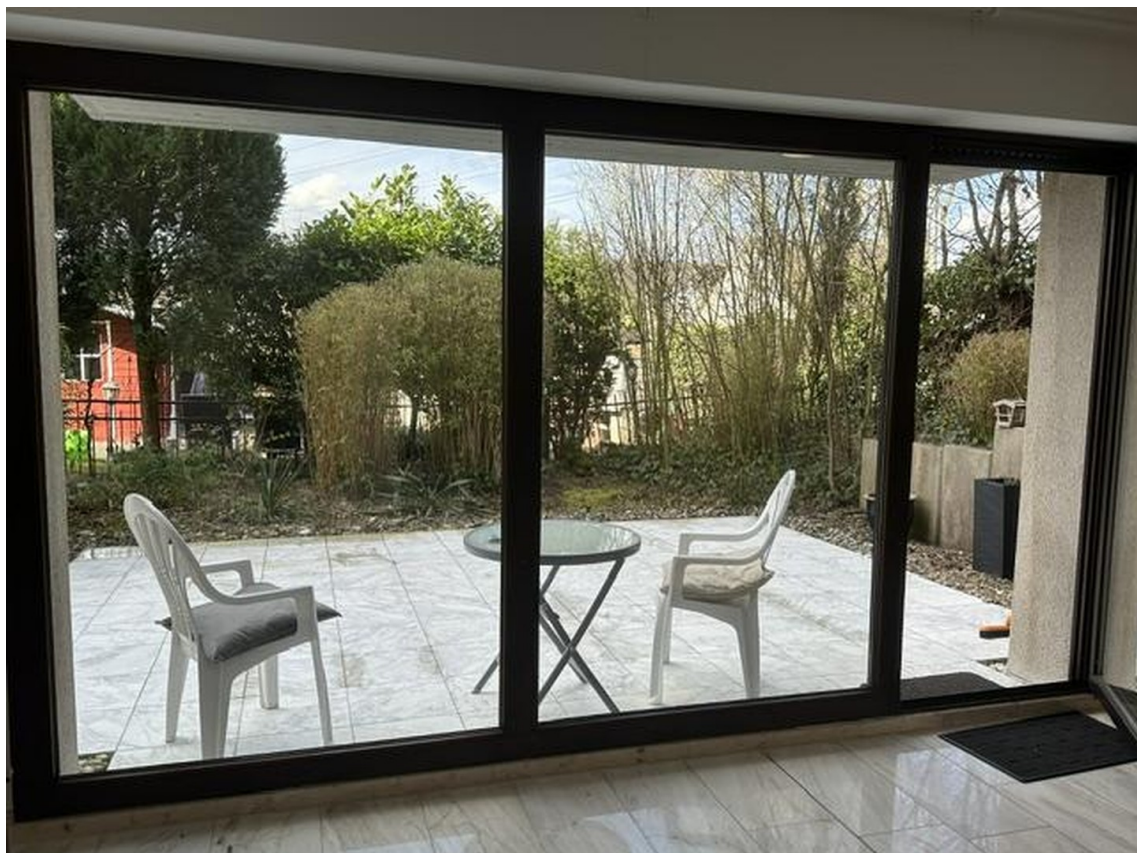
Blick vom Wohnzimmer zur Terra