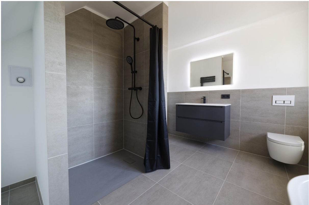
Bad OG 3