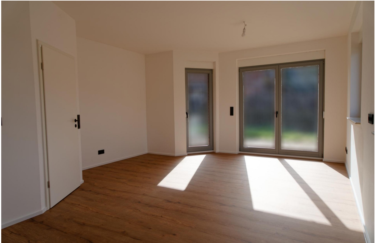
Küche EG 2