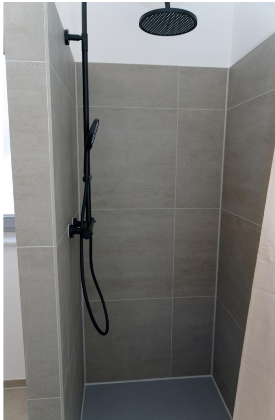
Bad EG 4