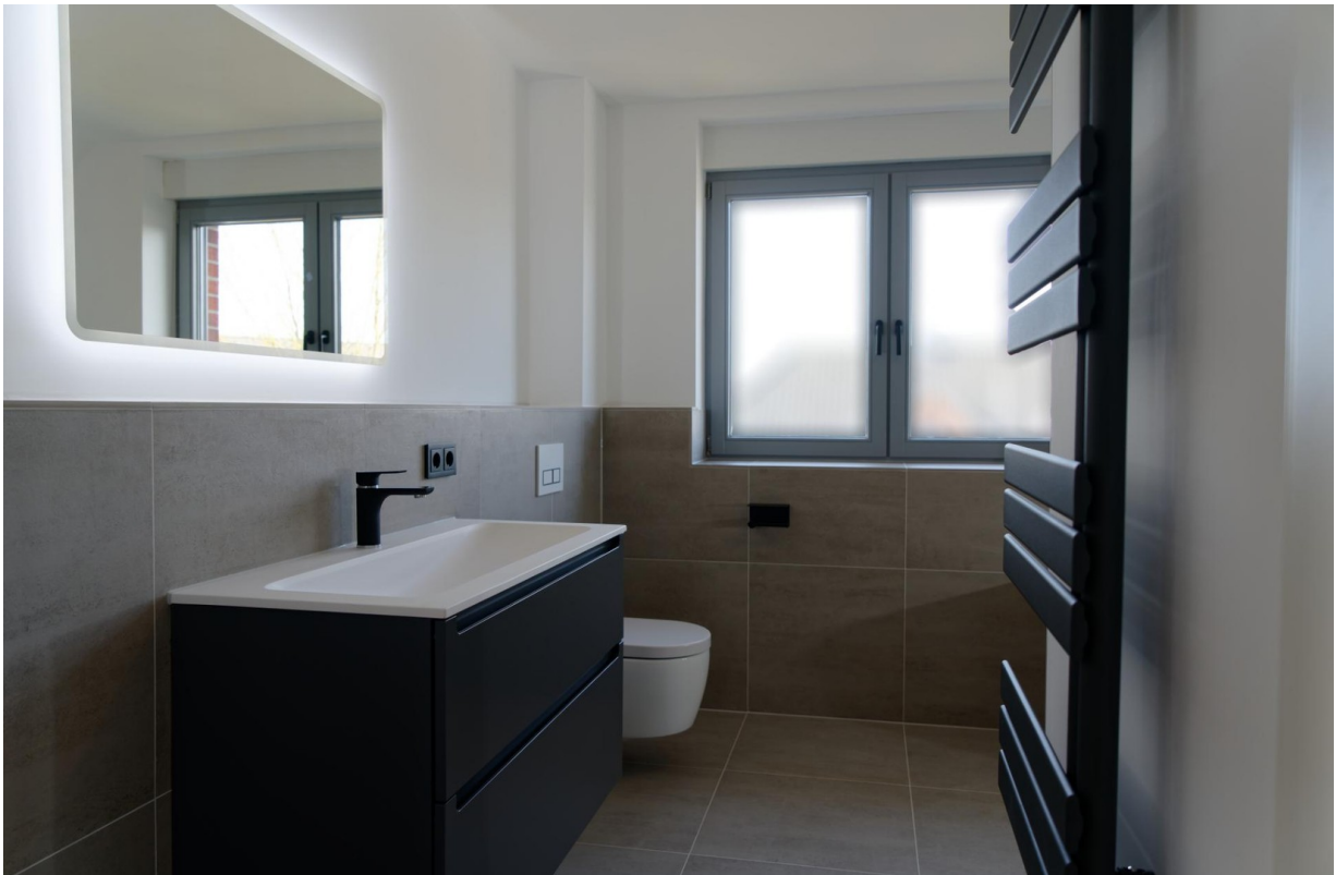
Bad OG 1