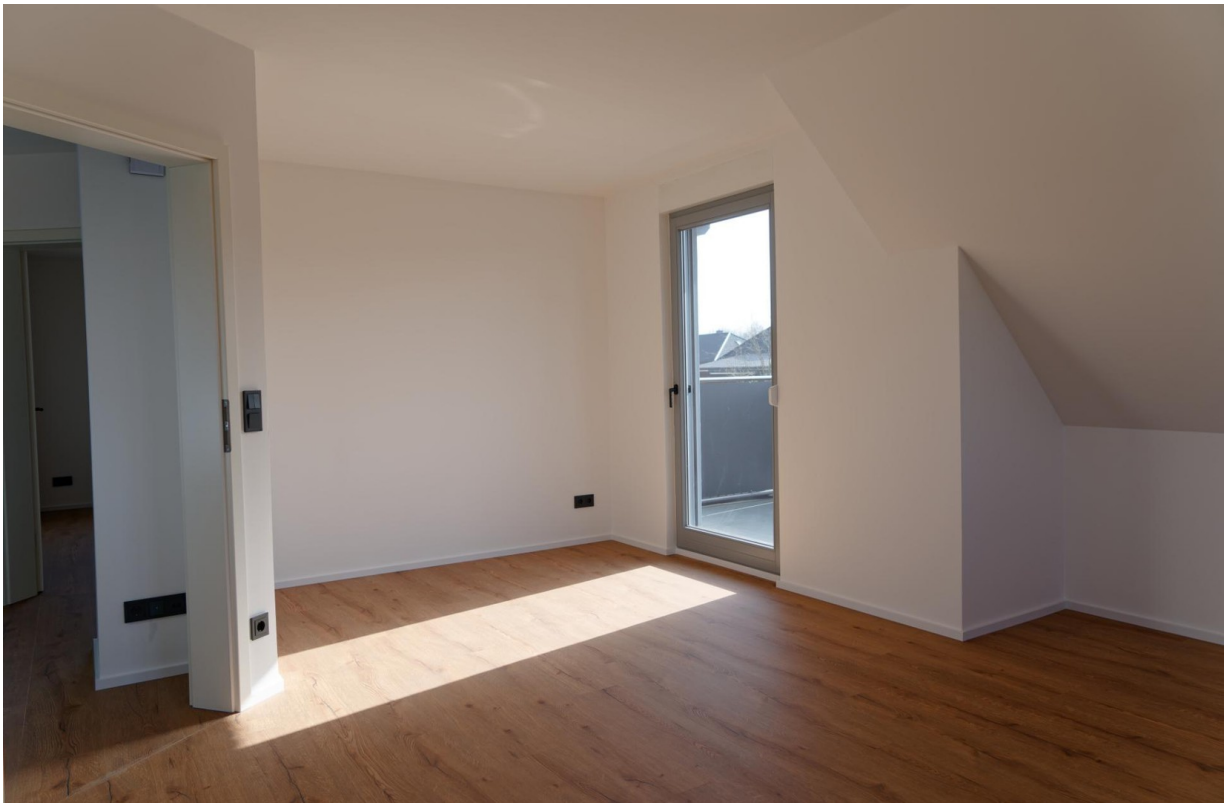
Küche OG 2