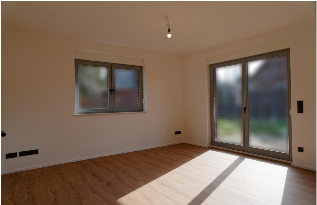
Wohnzimmer EG 1