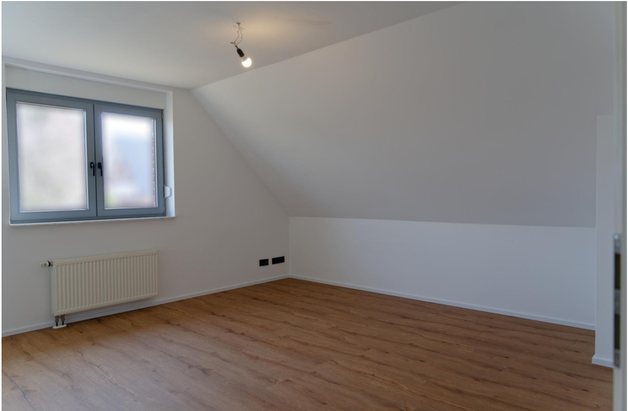
Wohnzimmer OG 1