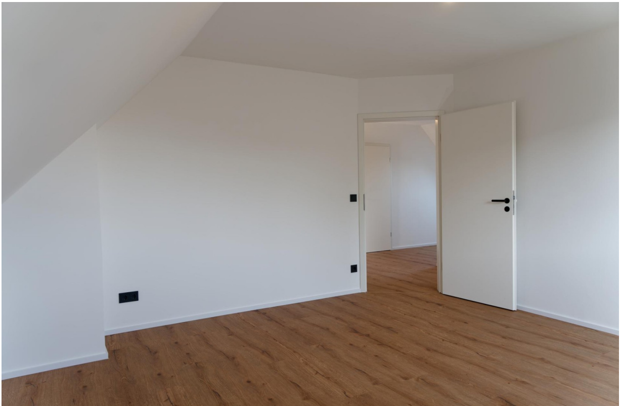
Wohnzimmer OG 2