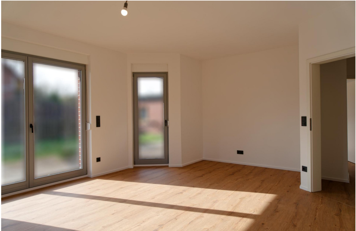
Wohnzimmer EG 2