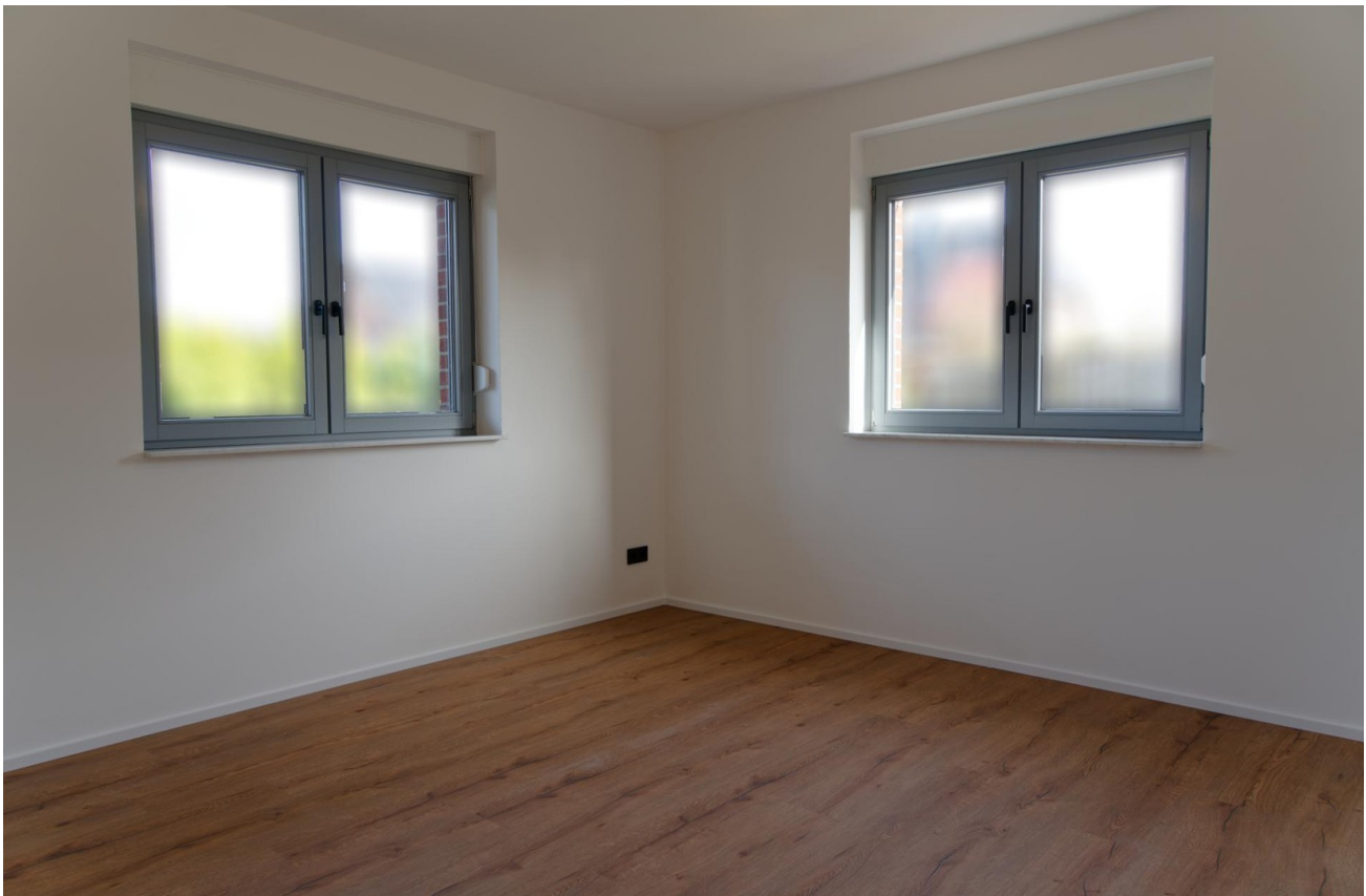
Schlafzimmer EG 1