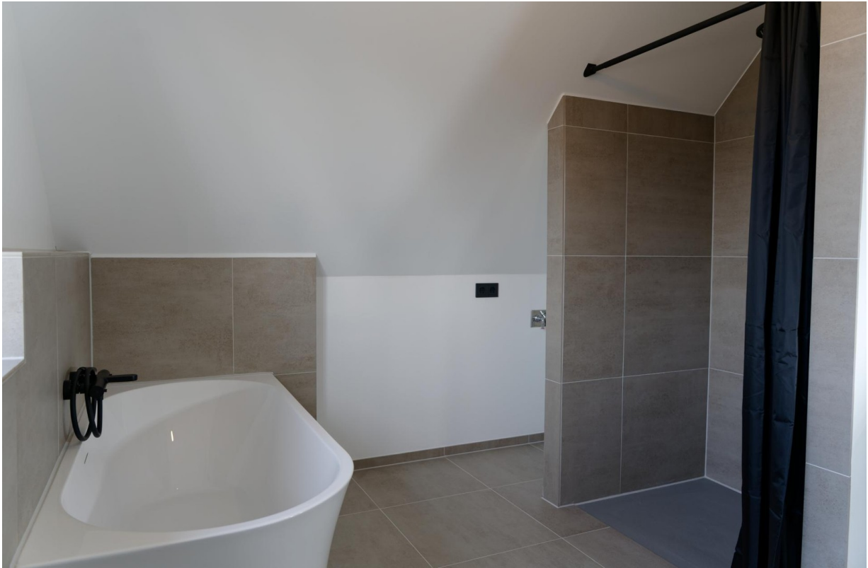
Bad OG 2