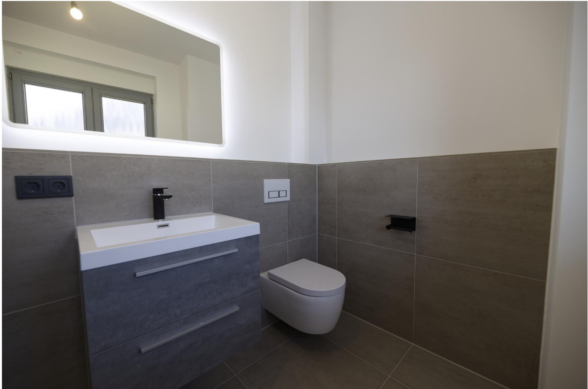
Bad EG 2