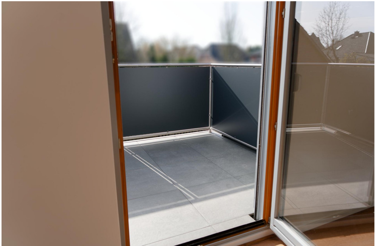
Balkon OG 1