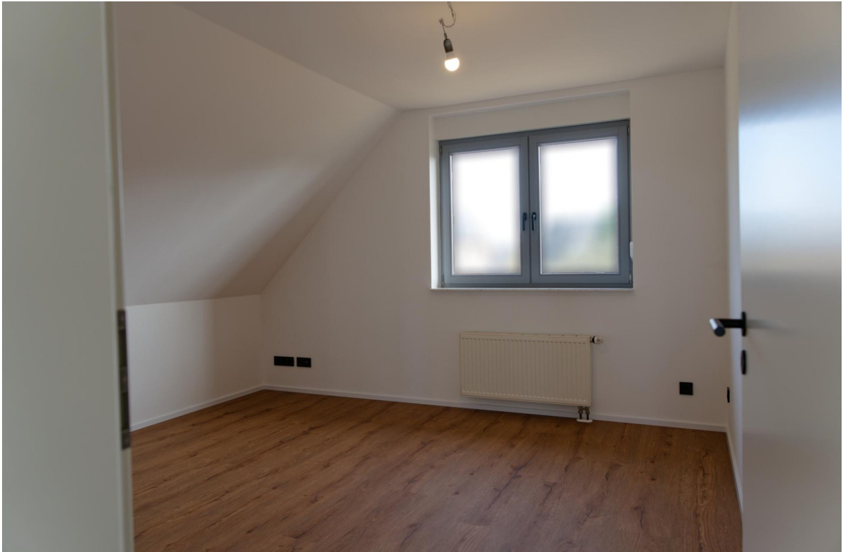
Schlafzimmer OG 1