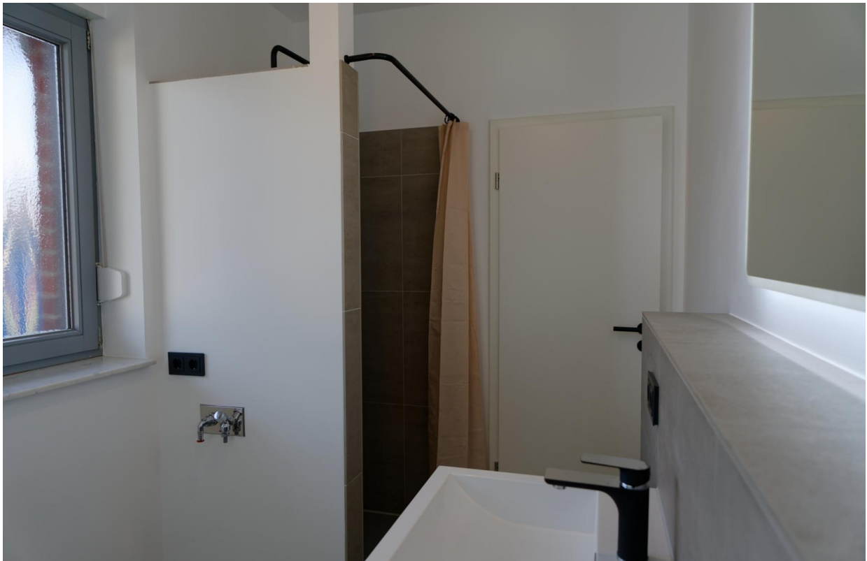
Bad EG 3