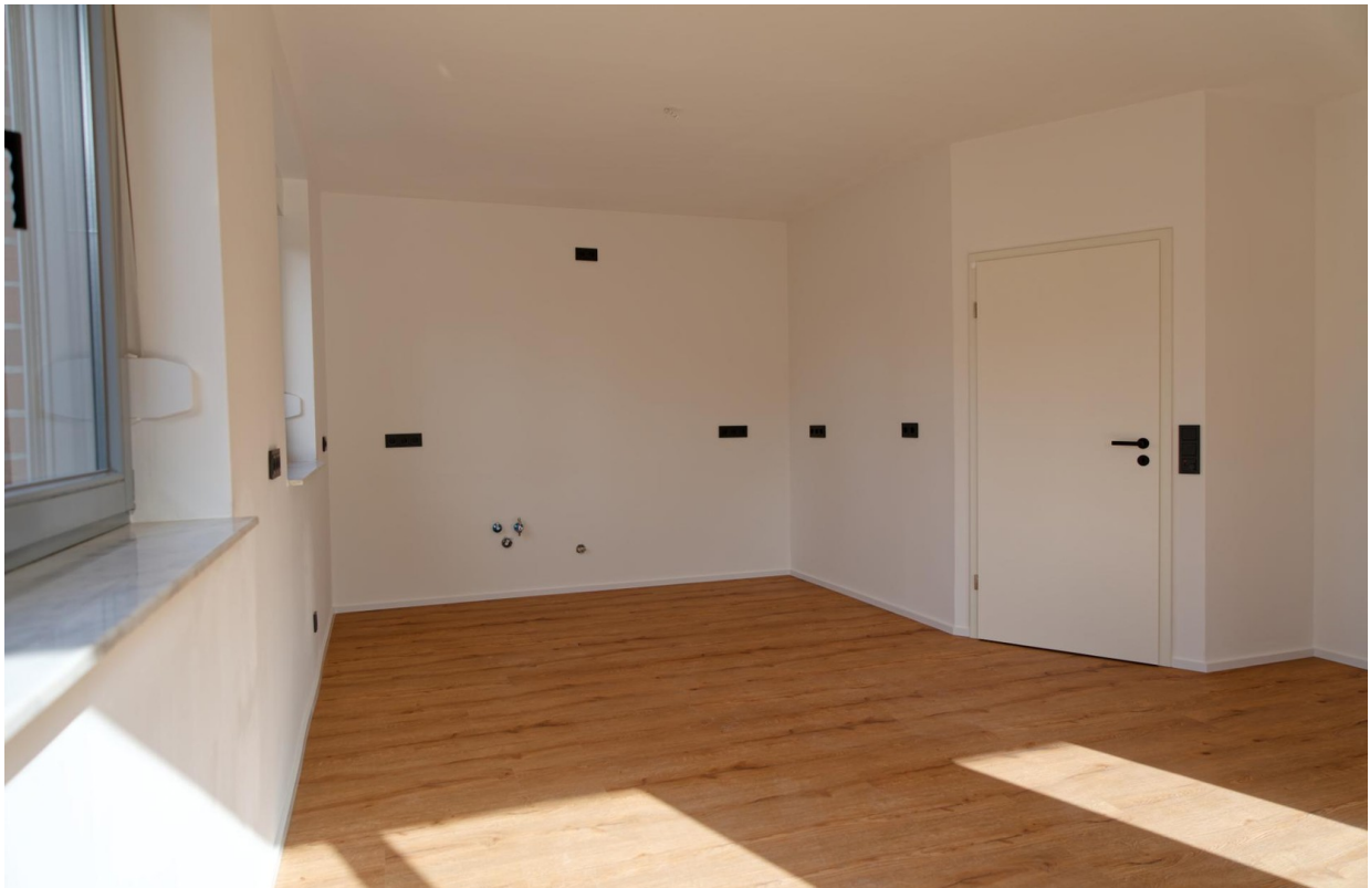
Küche EG 1