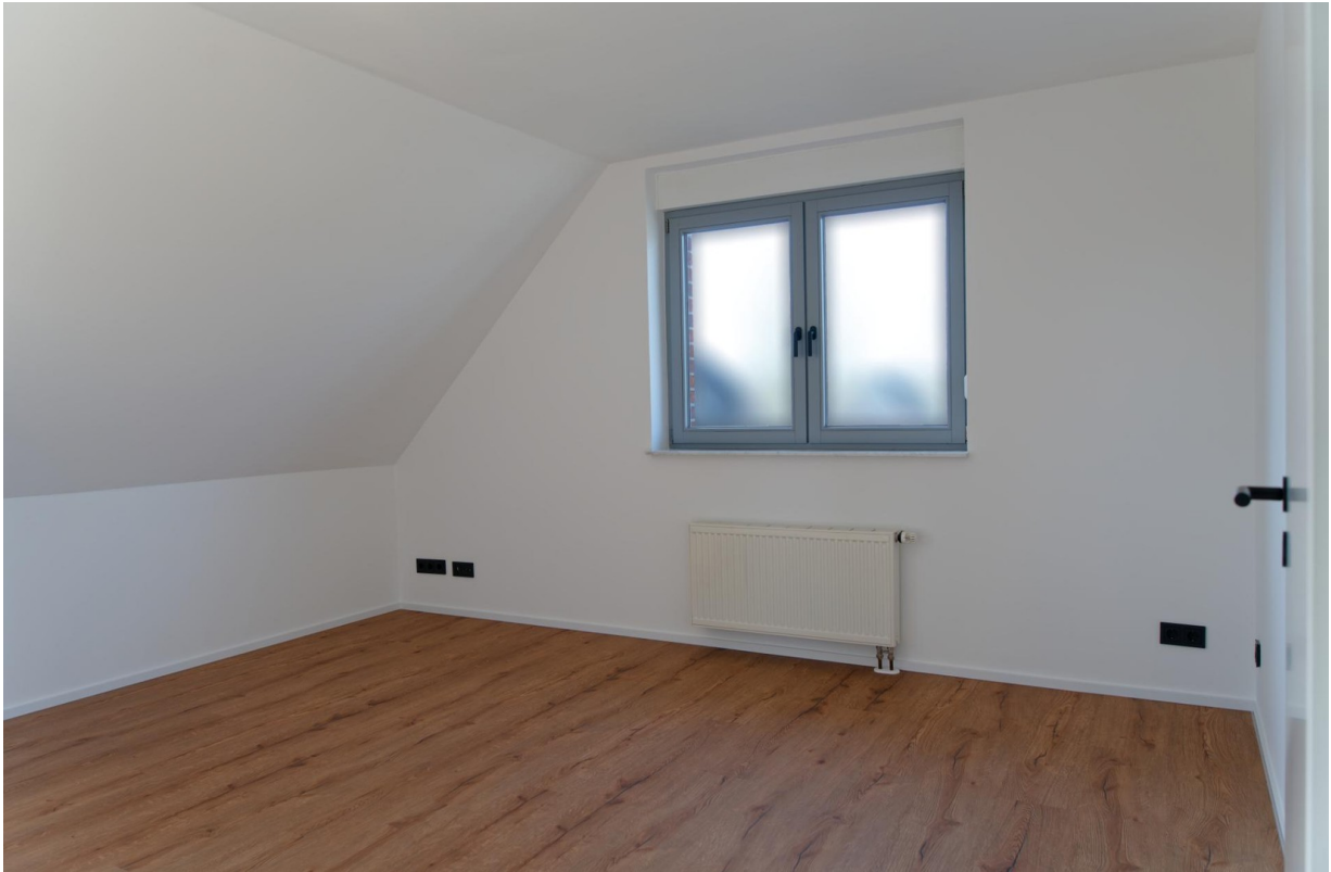
Küche OG 1