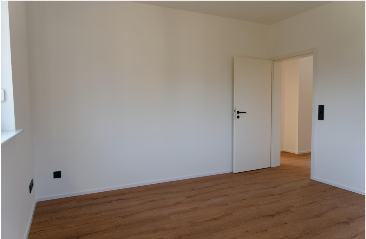
Schlafzimmer EG 2