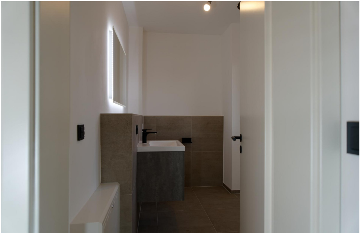
Bad EG 1