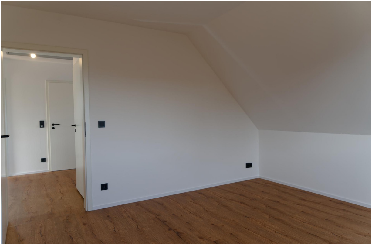
Schlafzimmer OG 2