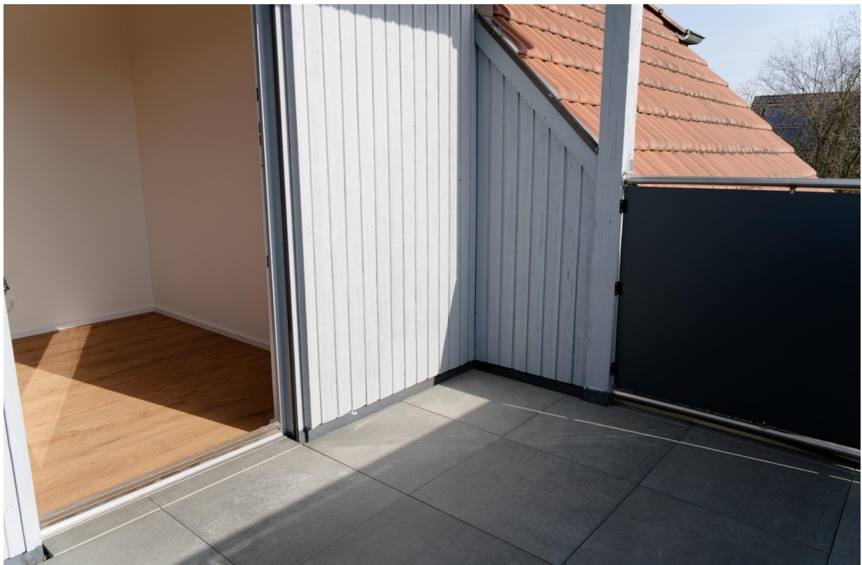
Balkon OG 2