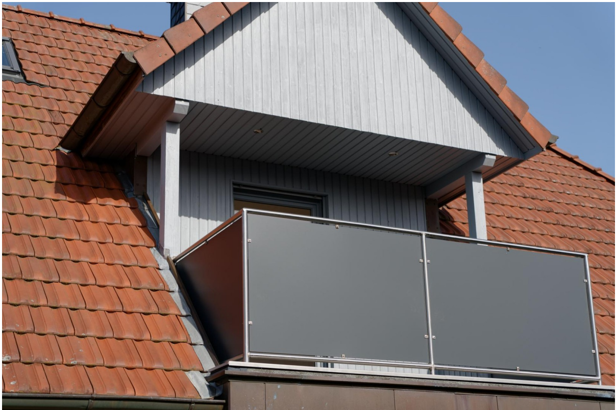
Balkon OG 3