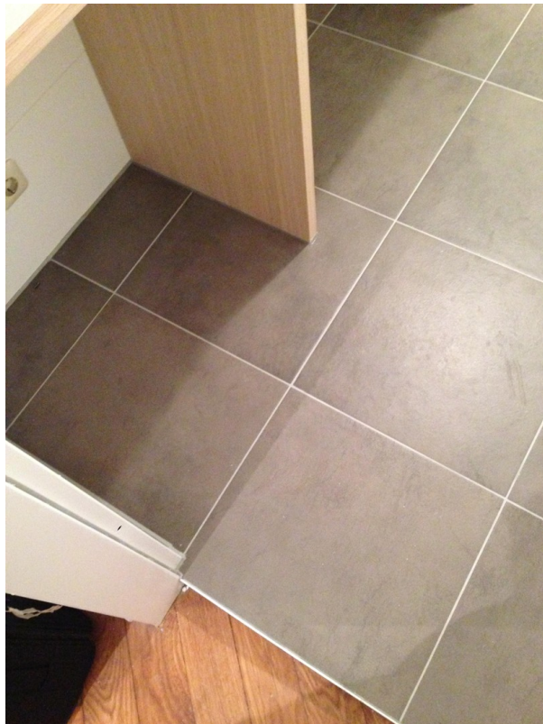
Bad (neuer Estrich)