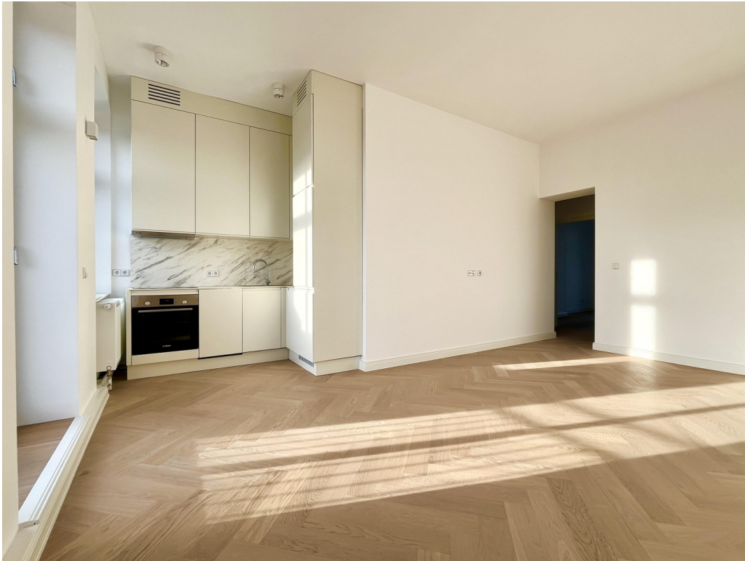
offener Wohn- und Essbereich