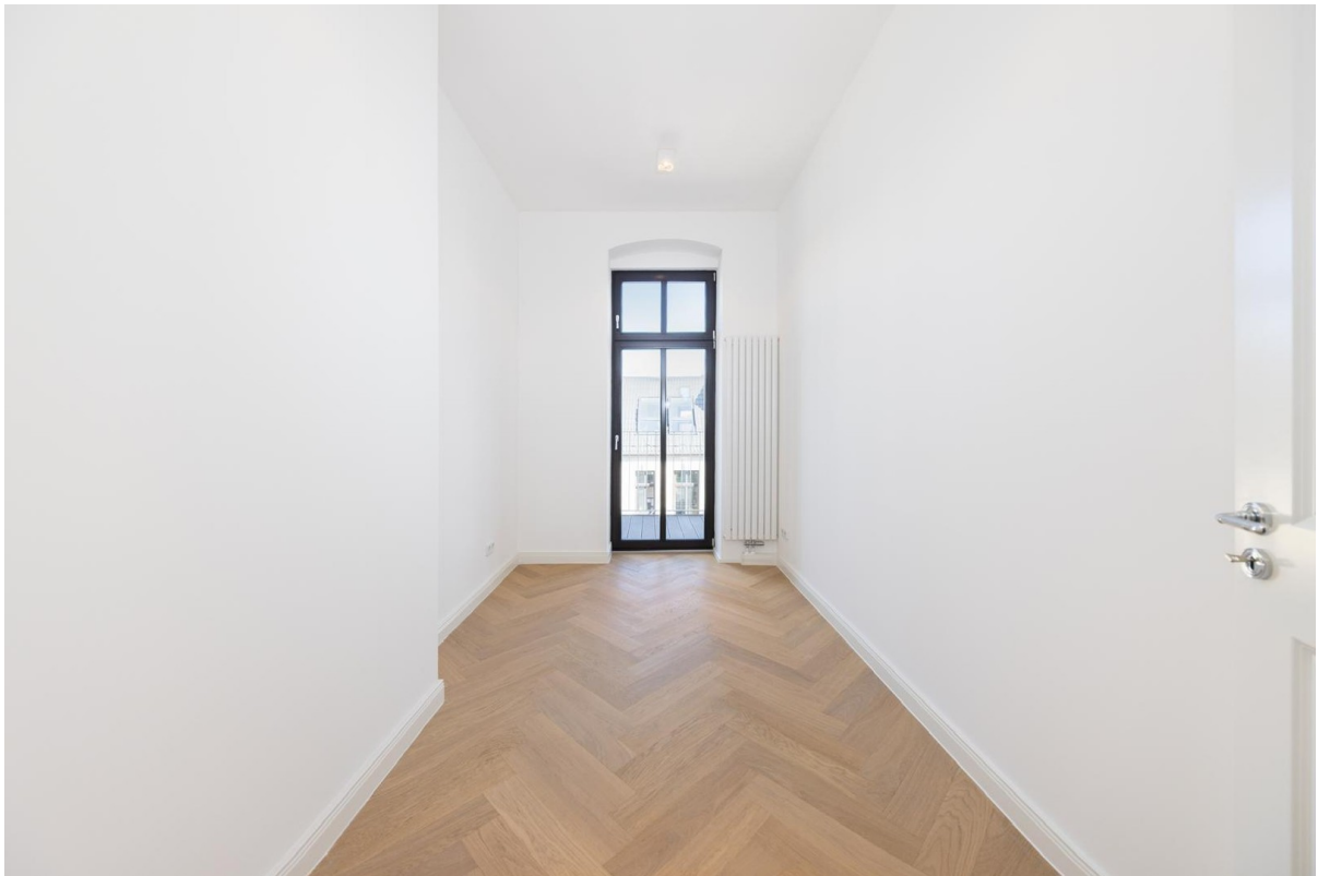
Zimmer 3 mit Balkon