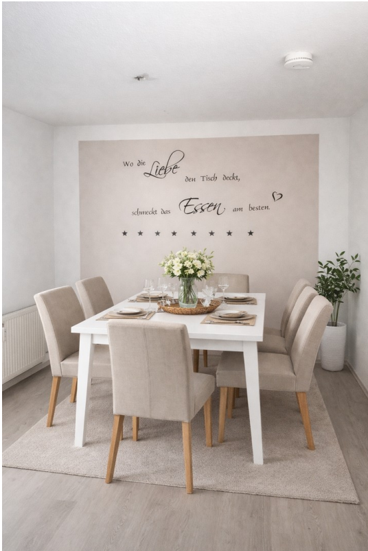
KI generierte Einrichtung