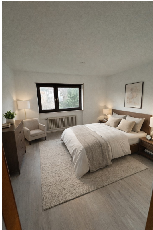
KI generierte Einrichtung