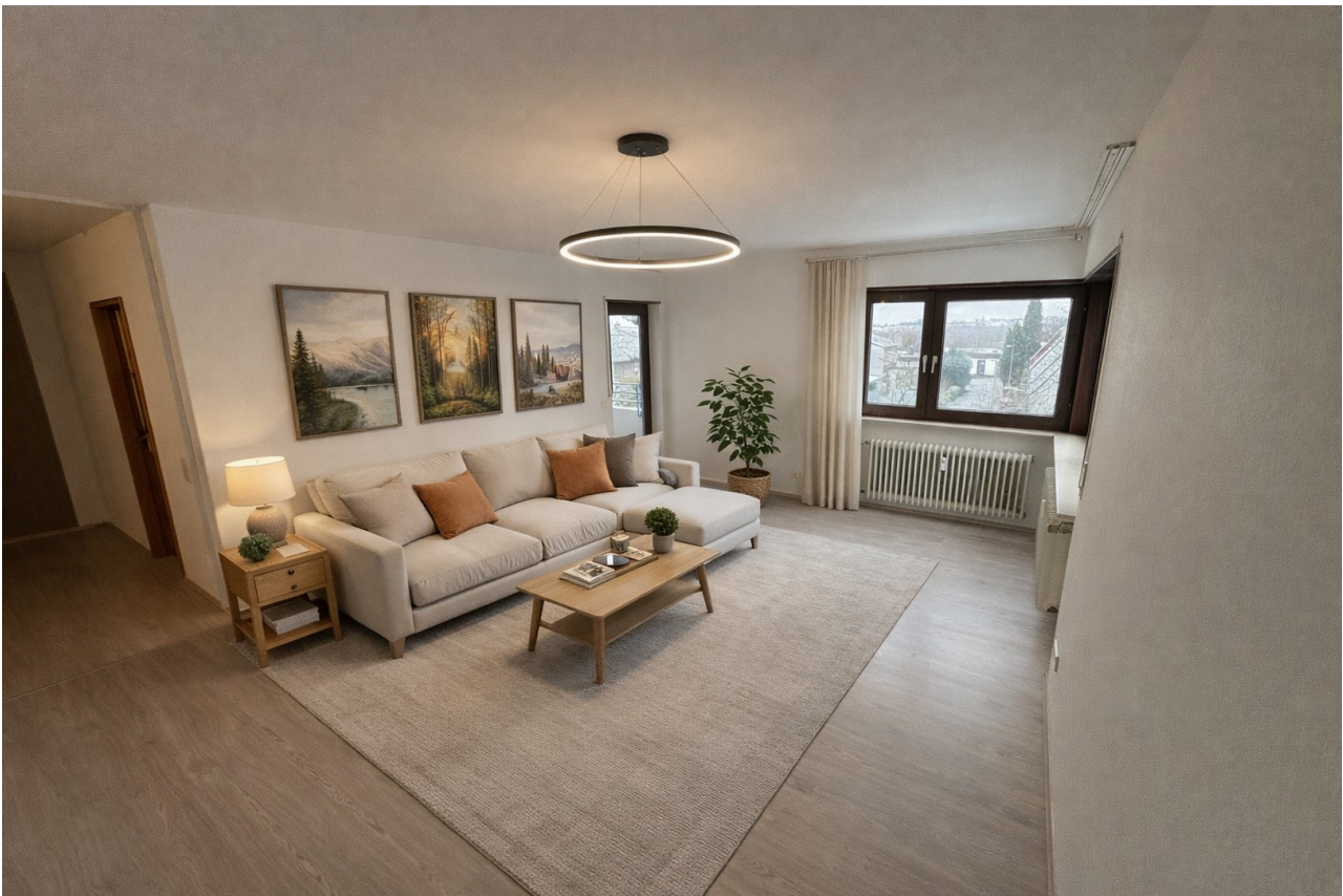
KI generierte Inneneinrichtung