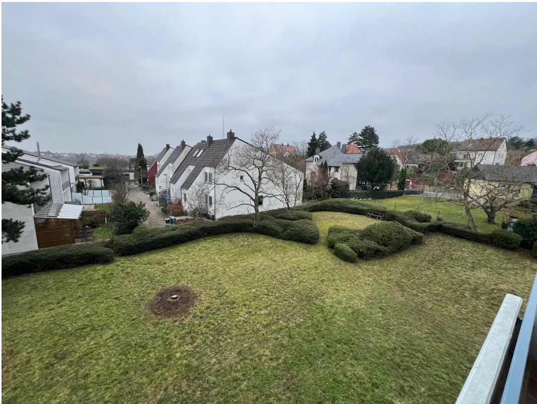
Ausblick Süd/West Balkon