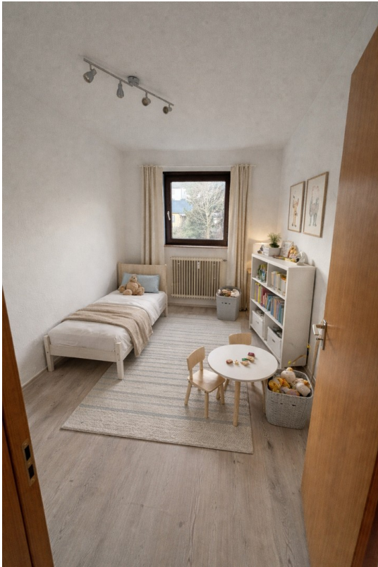
KI generierte Einrichtung KiZi