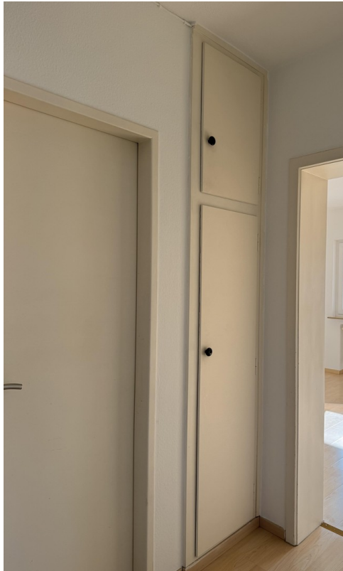
Kleiner Einbauschränk im Flur