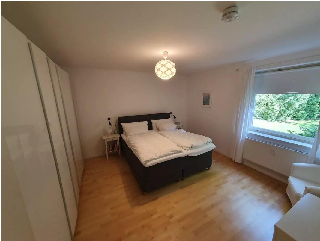
Schlafzimmer zum Garten