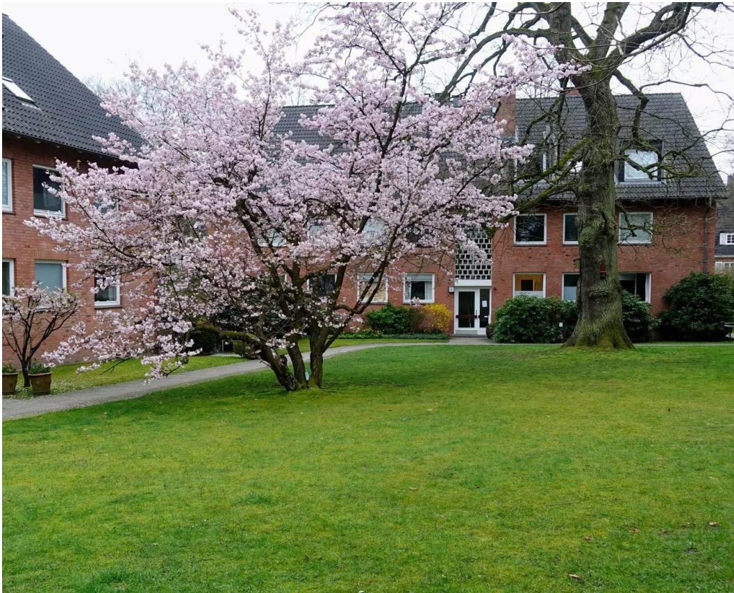
Blick zum Haus