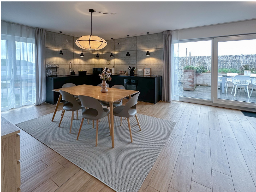
Essbereich mit viel Licht