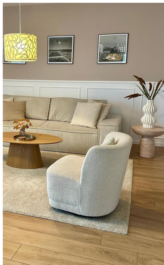
Holzfliesen und Wandkassetten