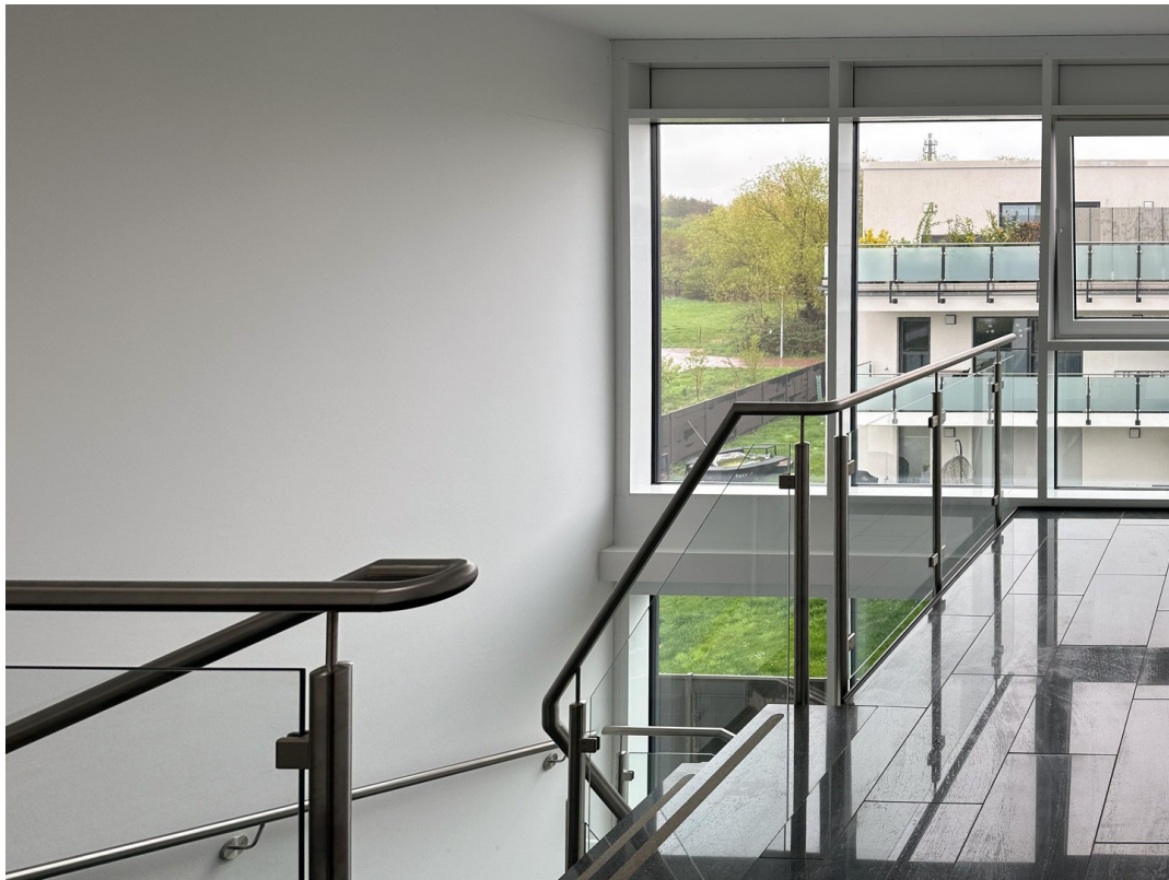
Modernes helles Treppenhaus