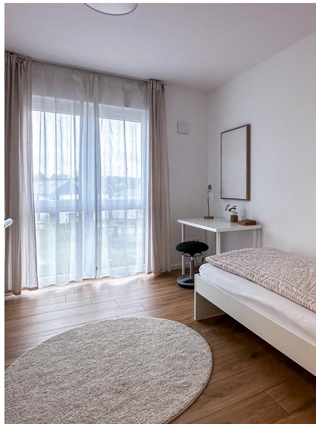
Büro oder Kinderzimmer