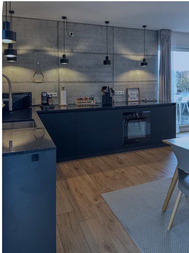
Offene moderne Küche