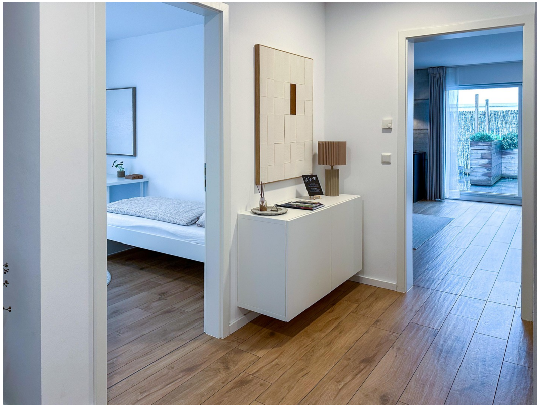
Flur mit Blick zu Terrasse