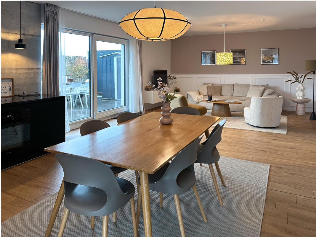
Blick aus Essbereich