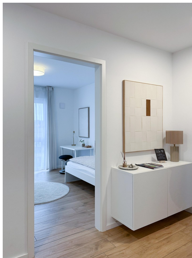
Flur Blick ins Büro/ KiZi