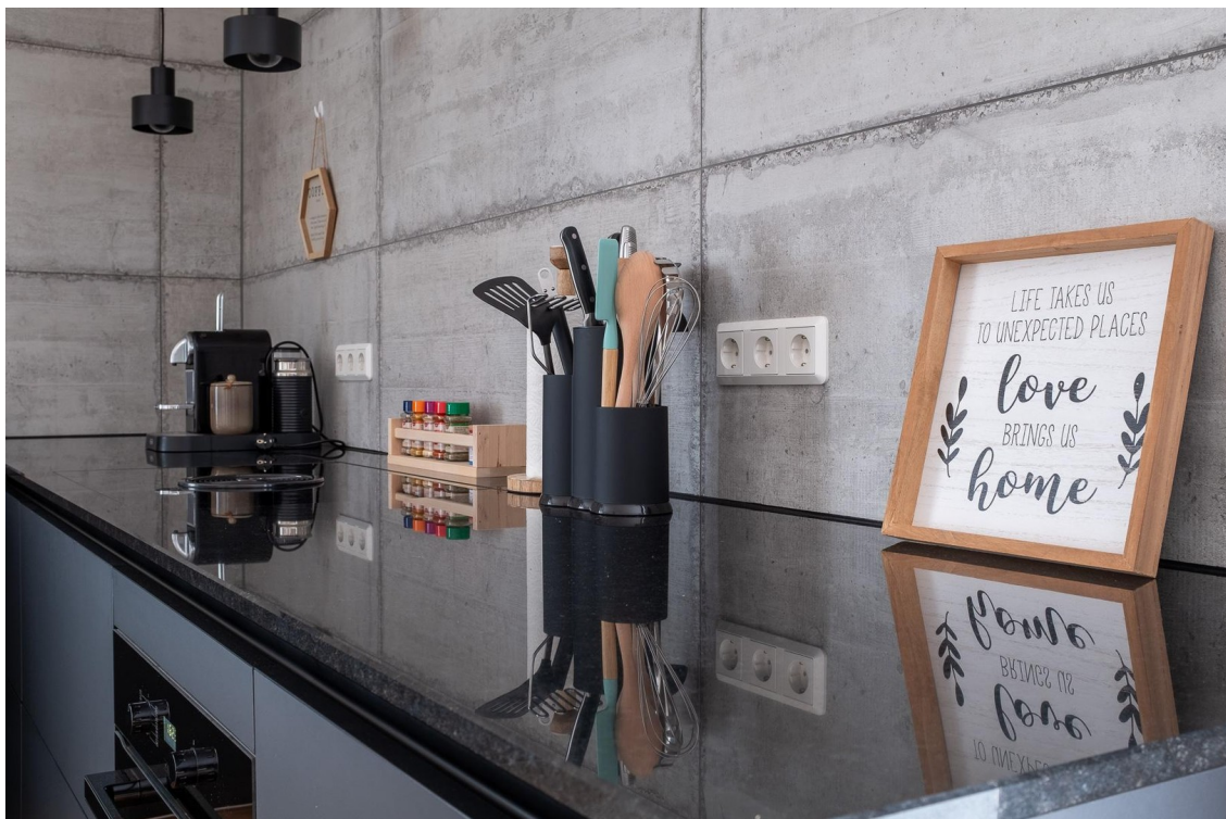
Küche Arbeitsplatte aus Granit