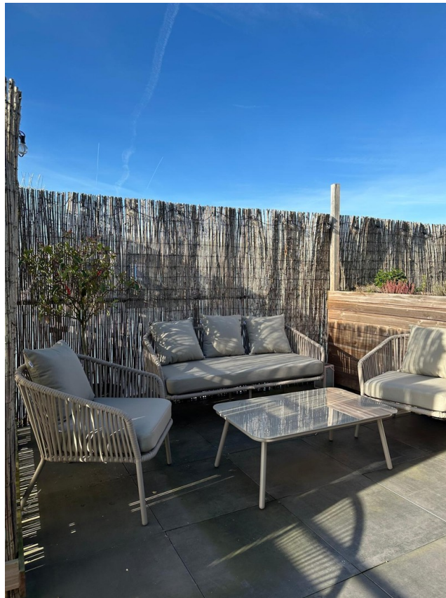
Terrasse Lounge Ecke