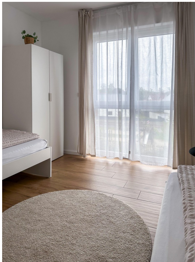
Büro oder Kinderzimmer