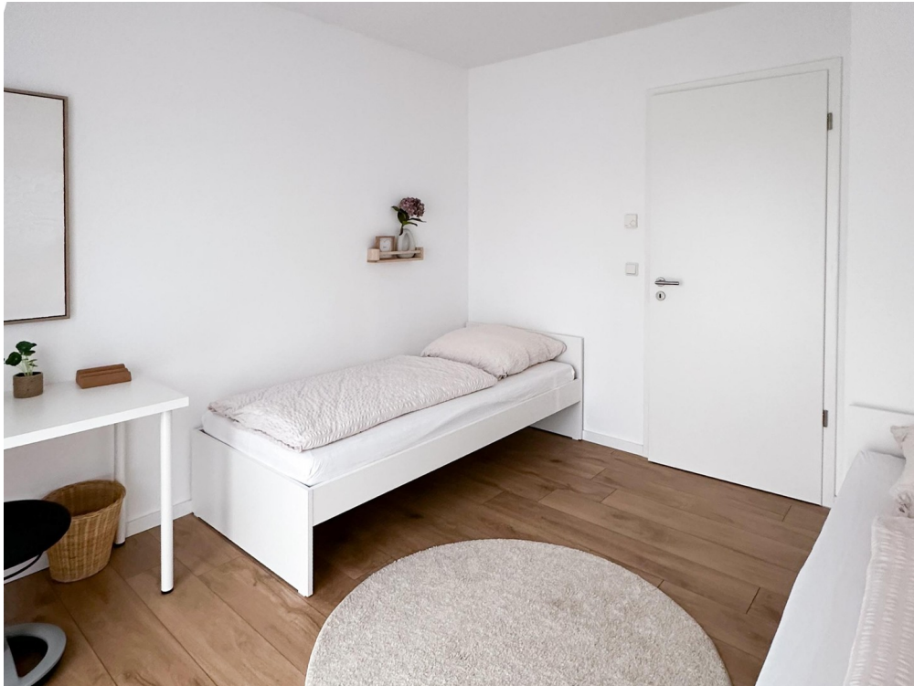
Büro oder Kinderzimmer