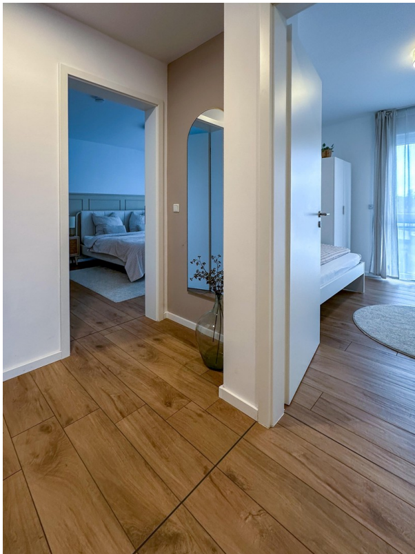
Flur Blick in SZ und KiZi