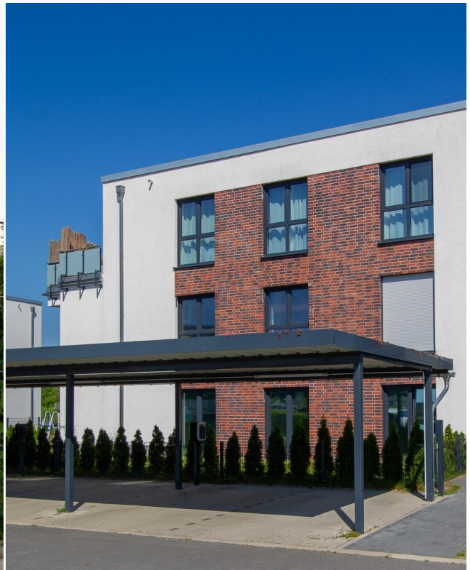
Carport direkt vor der Tür