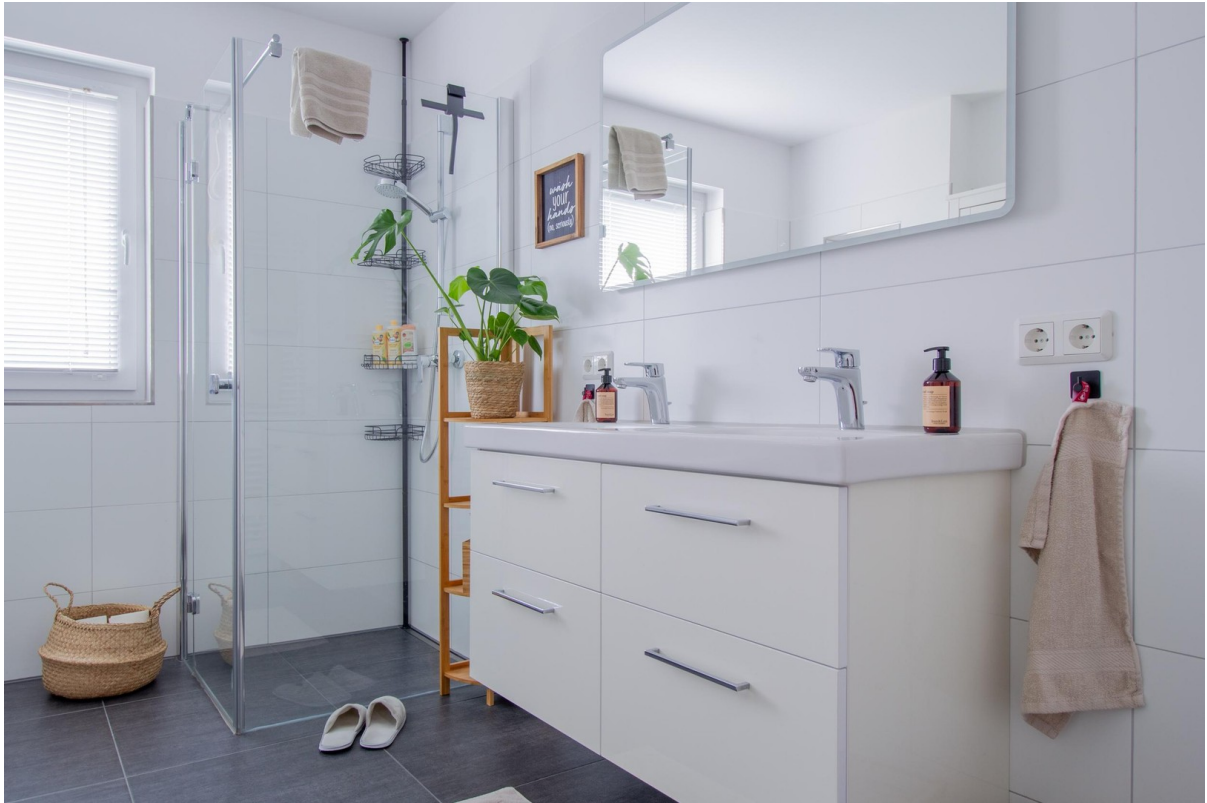
Dusche und Doppelwaschtisch