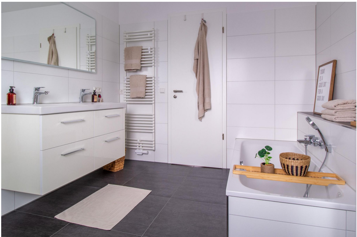
Badewanne und Waschtisch