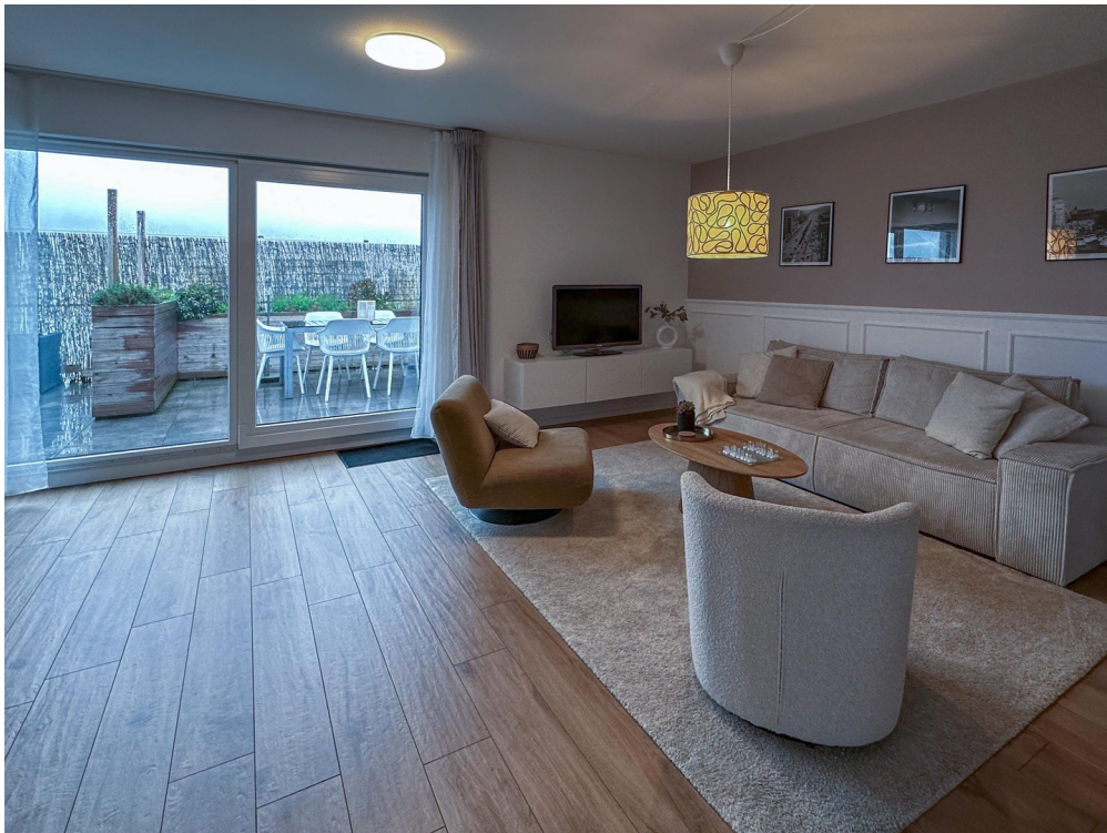
Wohnbereich und Terrasse