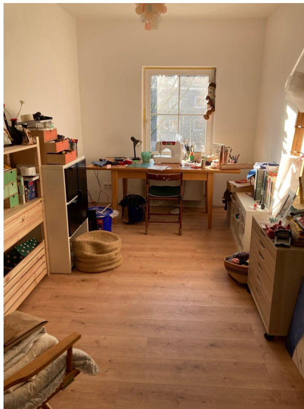
Büro 1 / Kinderzimmer 1