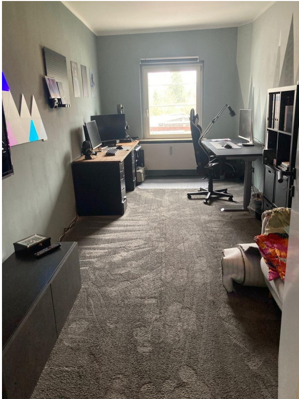
Kinderzimmer 2 / Büro 2