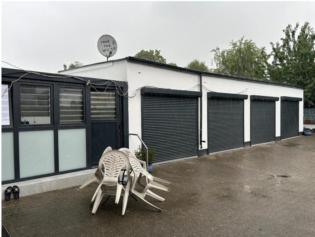
Garagenhof (Garage № 3)