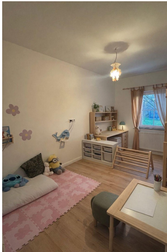
Büro 1 / Kinderzimmer 1