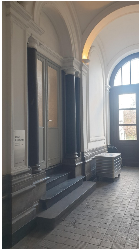
Zugang zum Treppenhaus