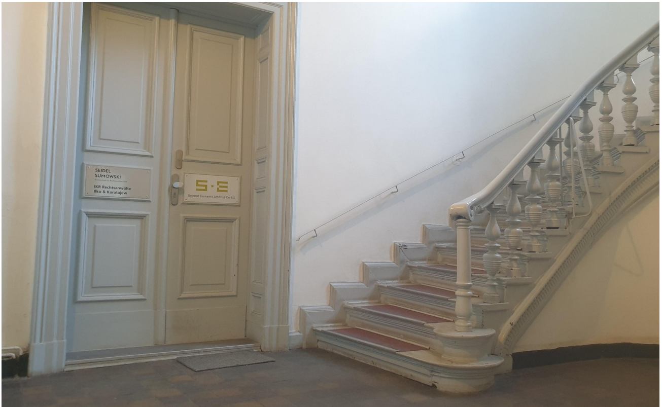
Eingang zur Mieteinheit