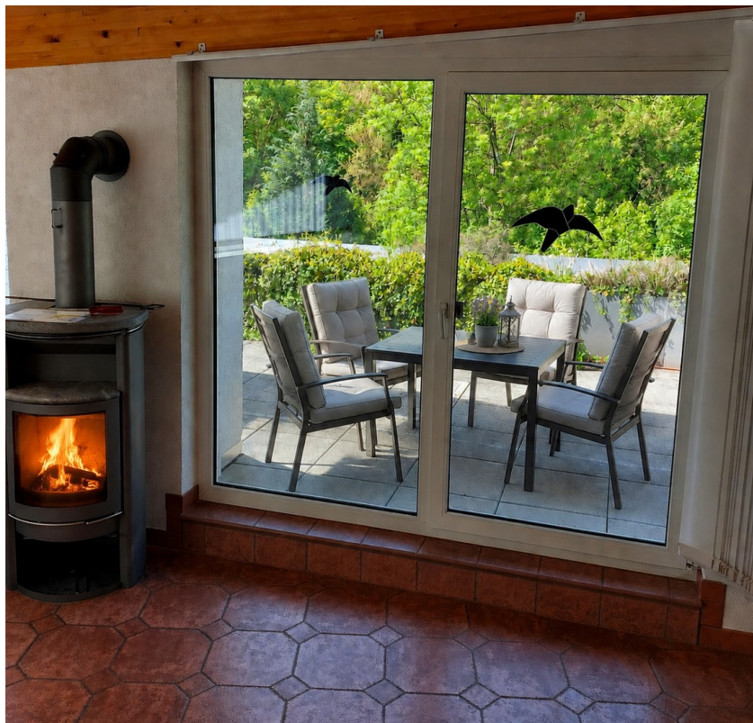
Blick auf die große Terrasse