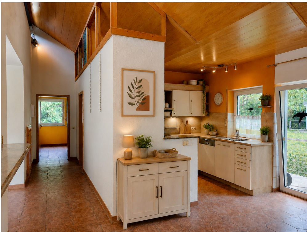
Blick vom Esszimmer in Küche