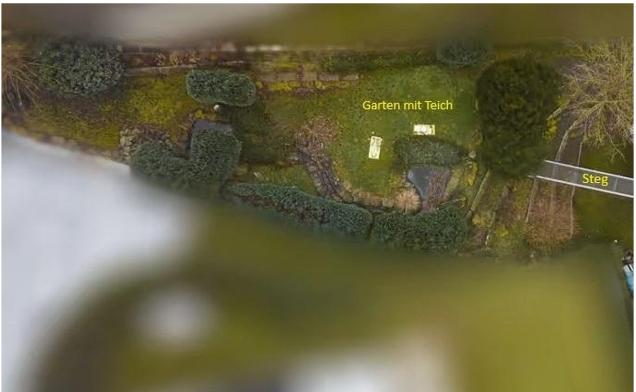
Garten mit Seerosen-Teich