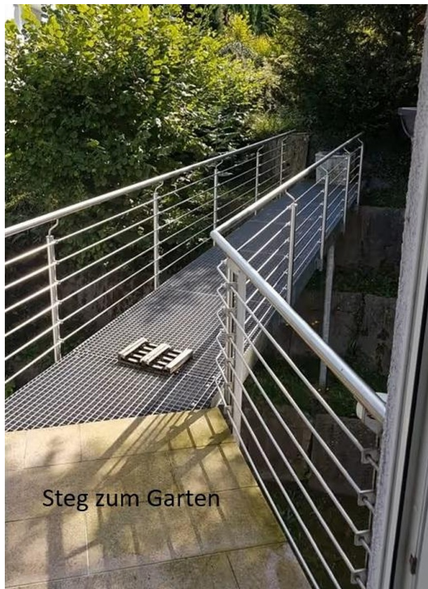
Steg zum Garten