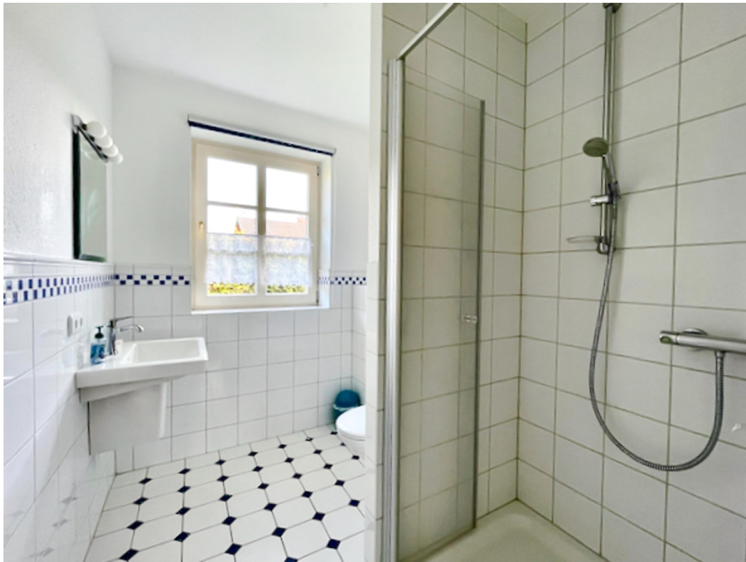
Bad 1 mit Dusche