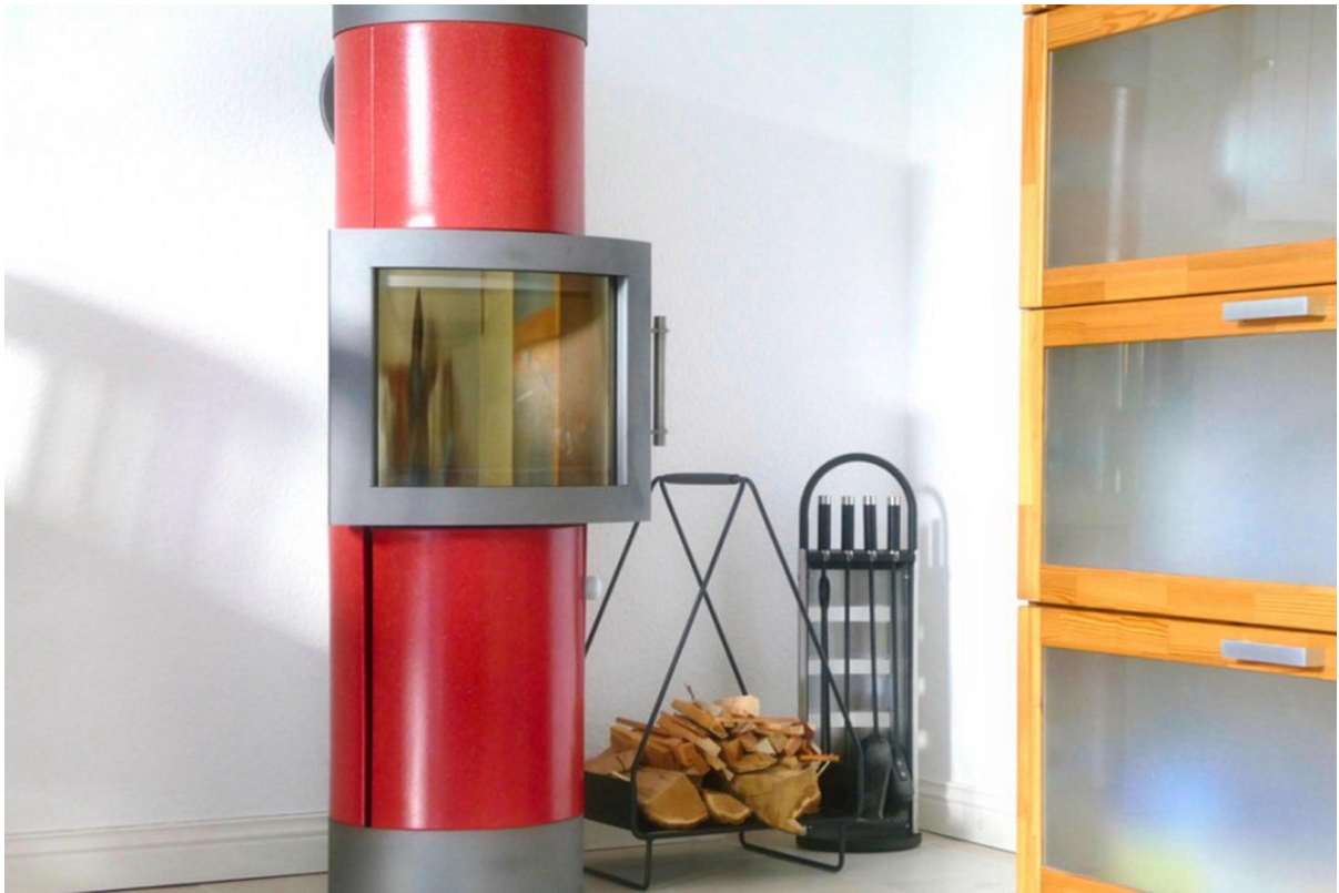
Kachel-Kaminofen im Wohnzimmer