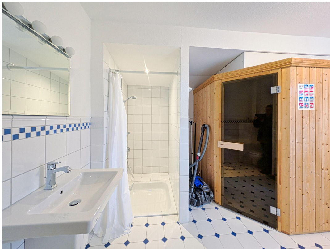
Bad 2 mit Sauna