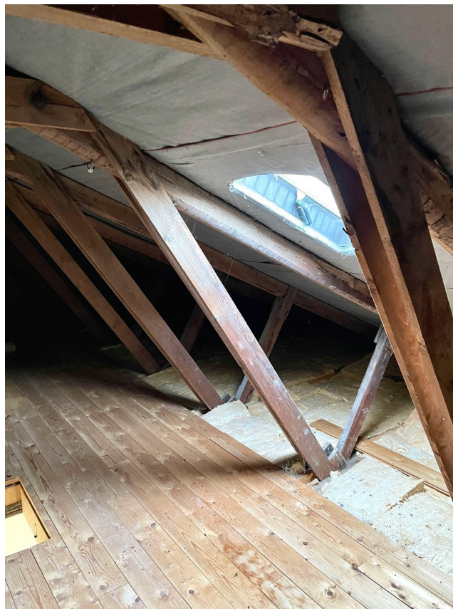
Dach mit Stauraum / Dämmung