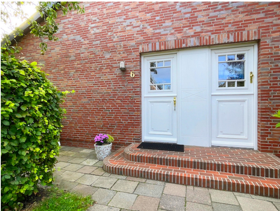
Eingang mit Klöntür Sauna