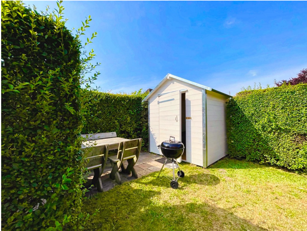
Grillplatz und Gartenhaus