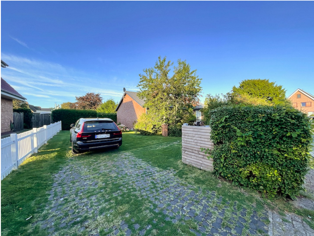
Einfahrt / 2 Parkplätze