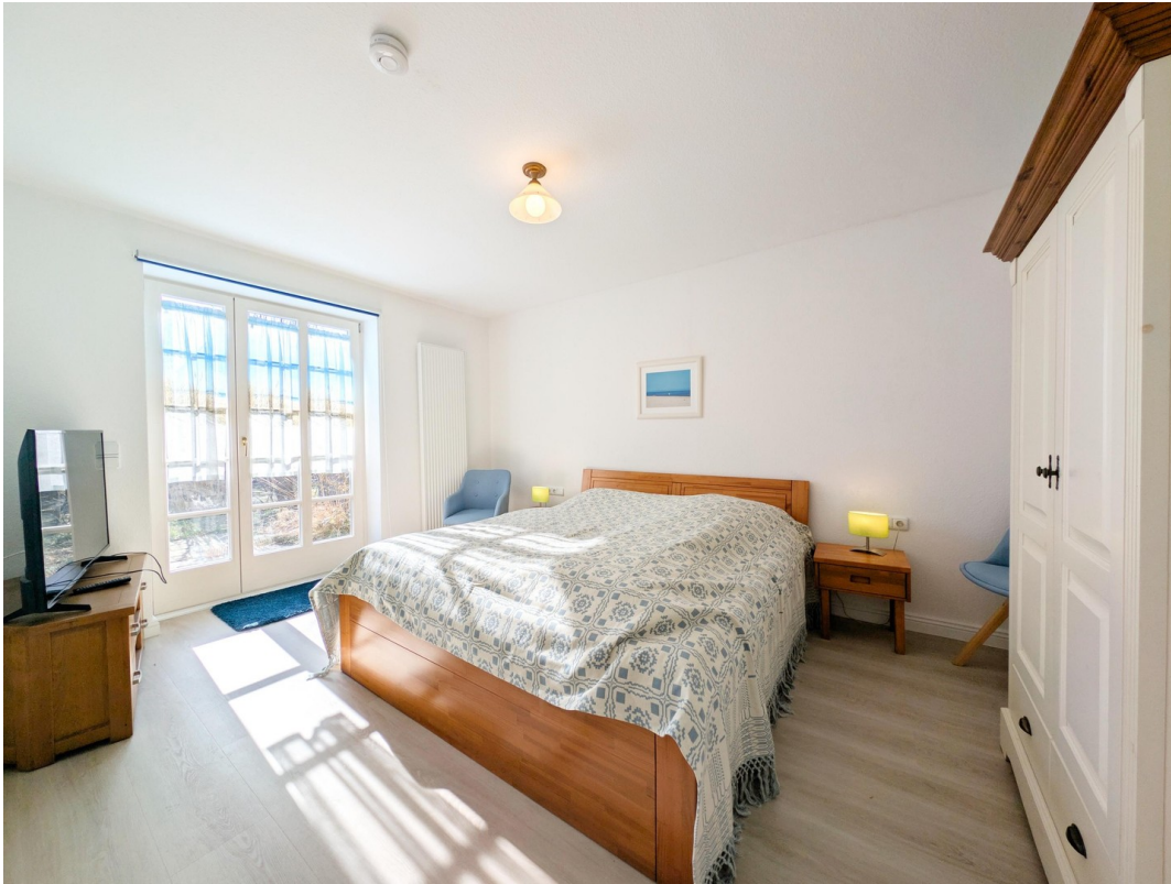
Schlafzimmer 1 Terrassenseite