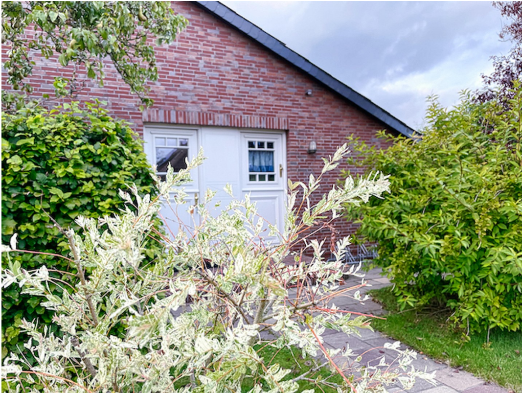
Ansicht Haus Eingang