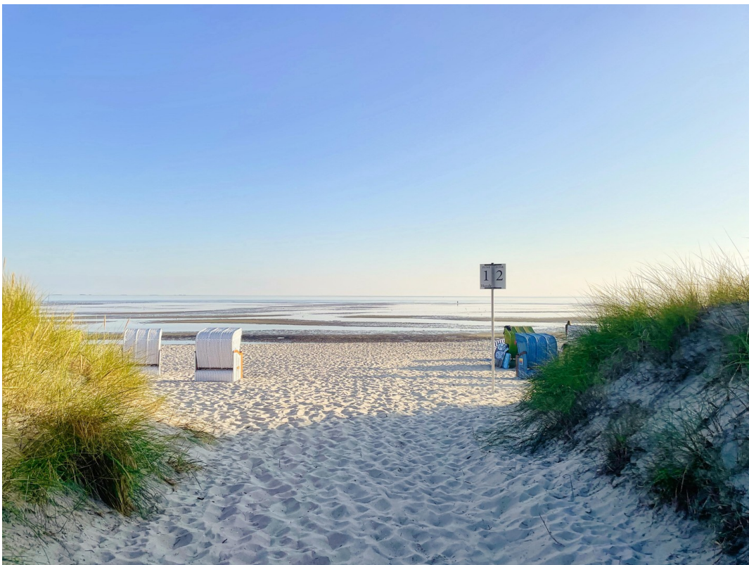
Strand Föhr Promenade