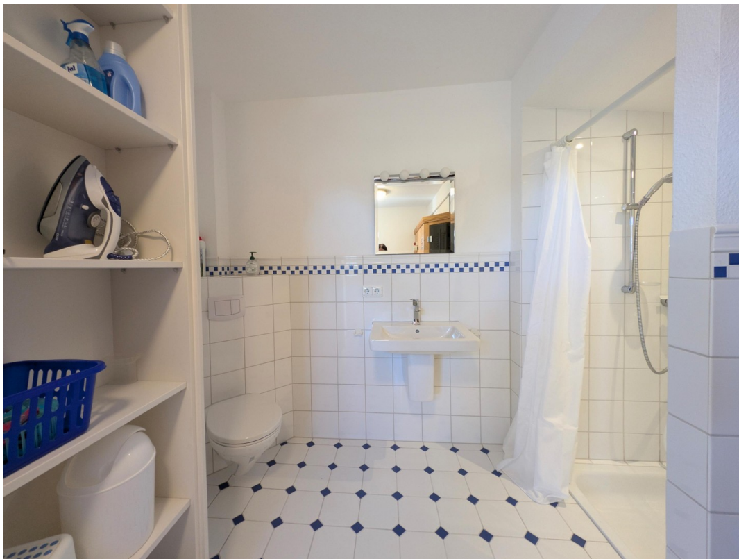
Bad 2 Detail