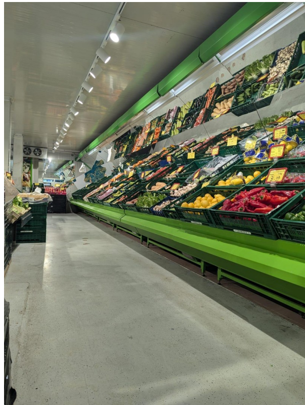
Obst- & Gemüse