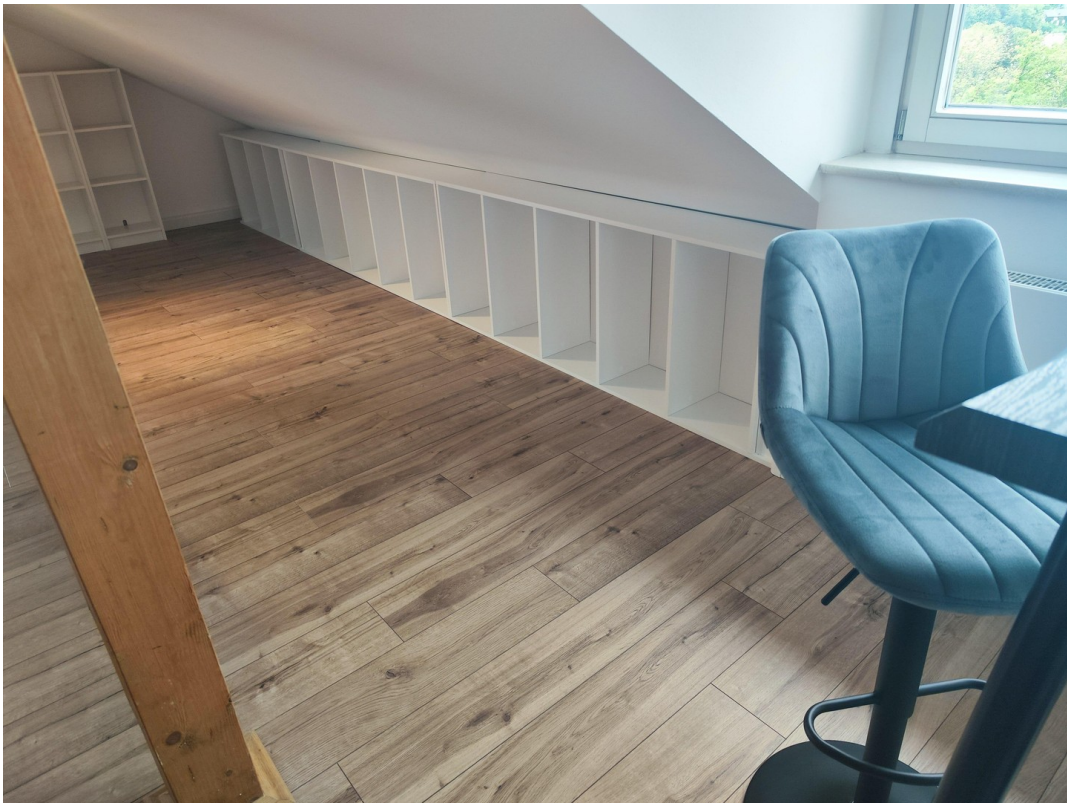
Möbel zur Veranschaulichung