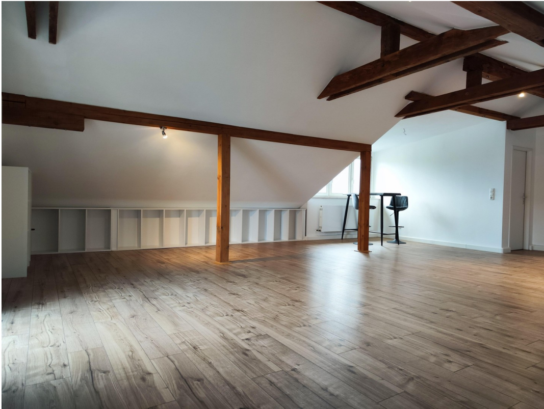
Möbel zur Veranschaulichung