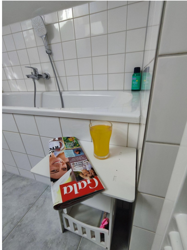
Möbel zur Veranschaulichung