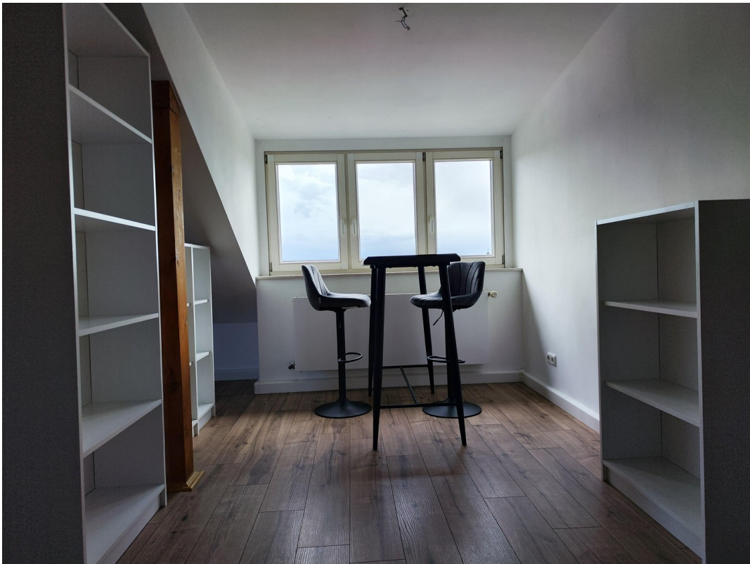
Möbel zur Veranschaulichung