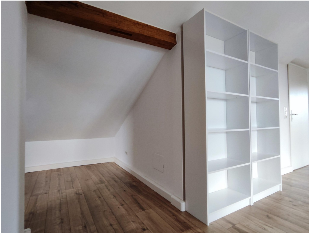
Möbel zur Veranschaulichung