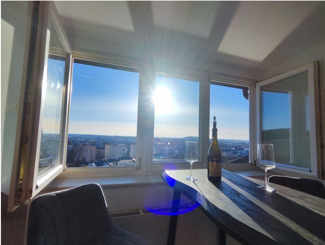
Möbel zur Veranschaulichung