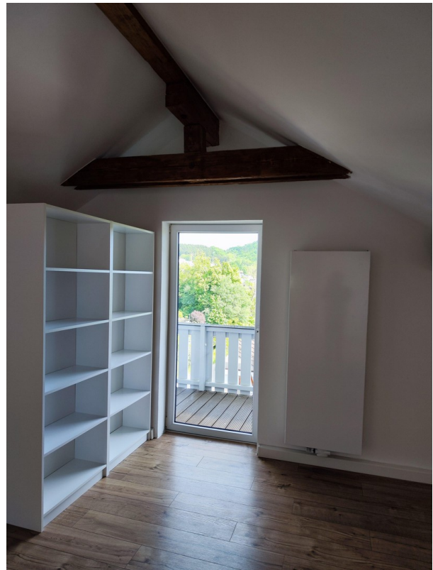
Möbel zur Veranschaulichung