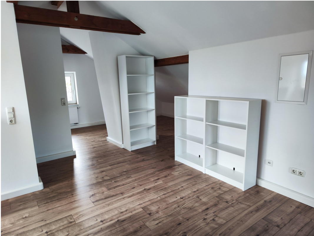
Möbel zur Veranschaulichung