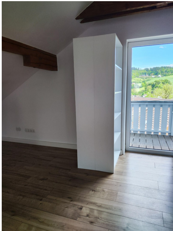
Möbel zur Veranschaulichung