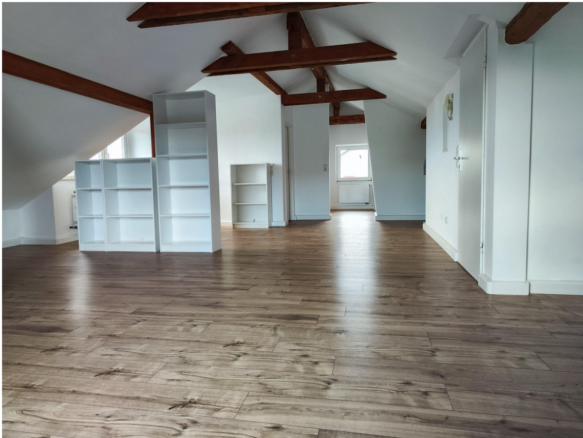
Möbel zur Veranschaulichung