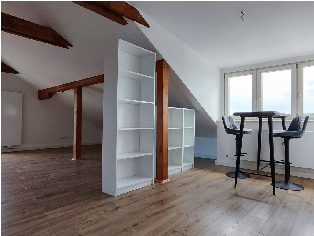
Möbel zur Veranschaulichung