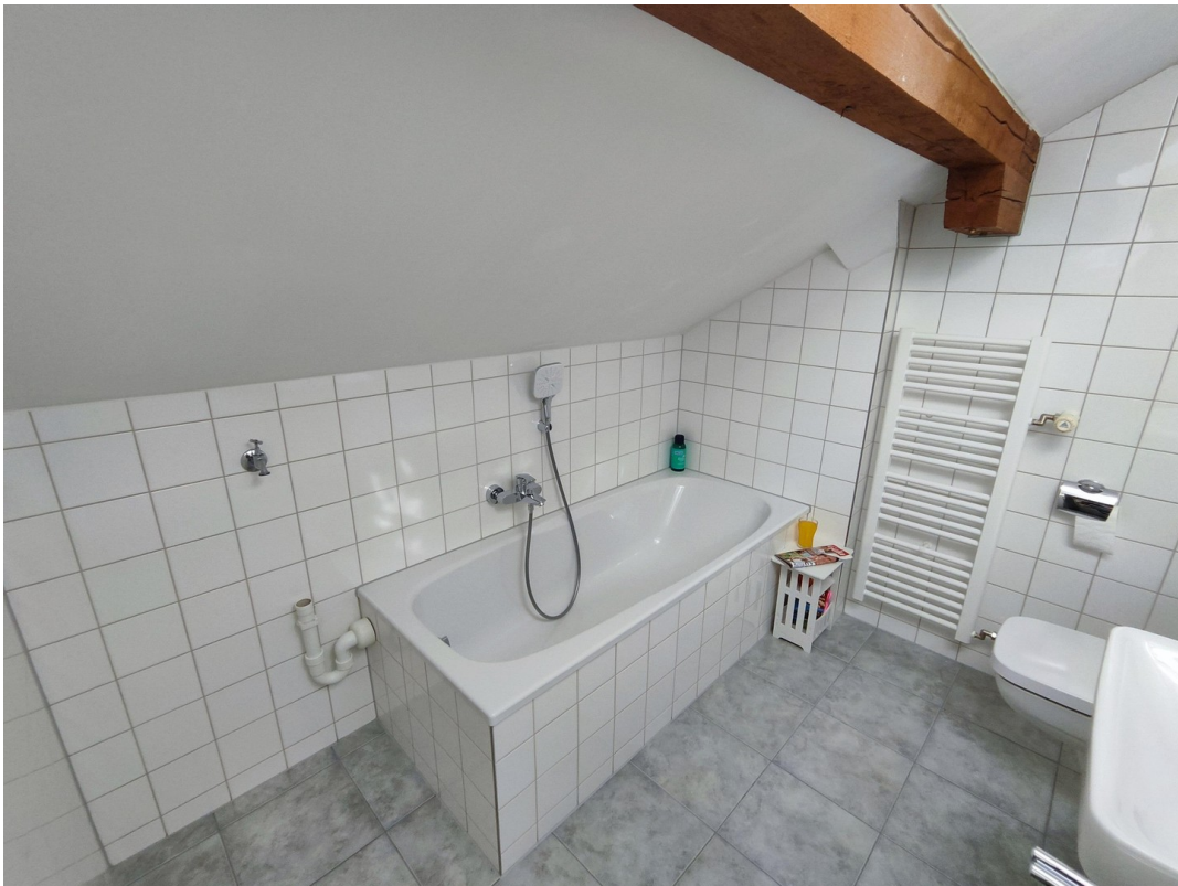
Möbel zur Veranschaulichung