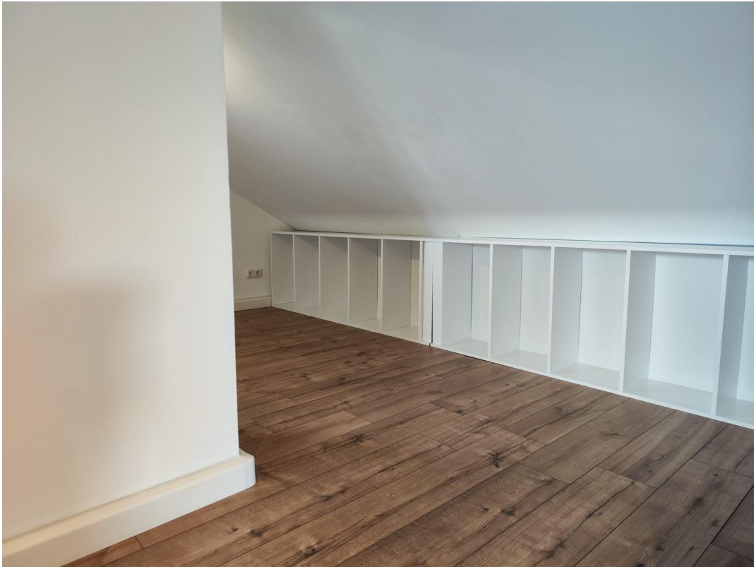
Möbel zur Veranschaulichung