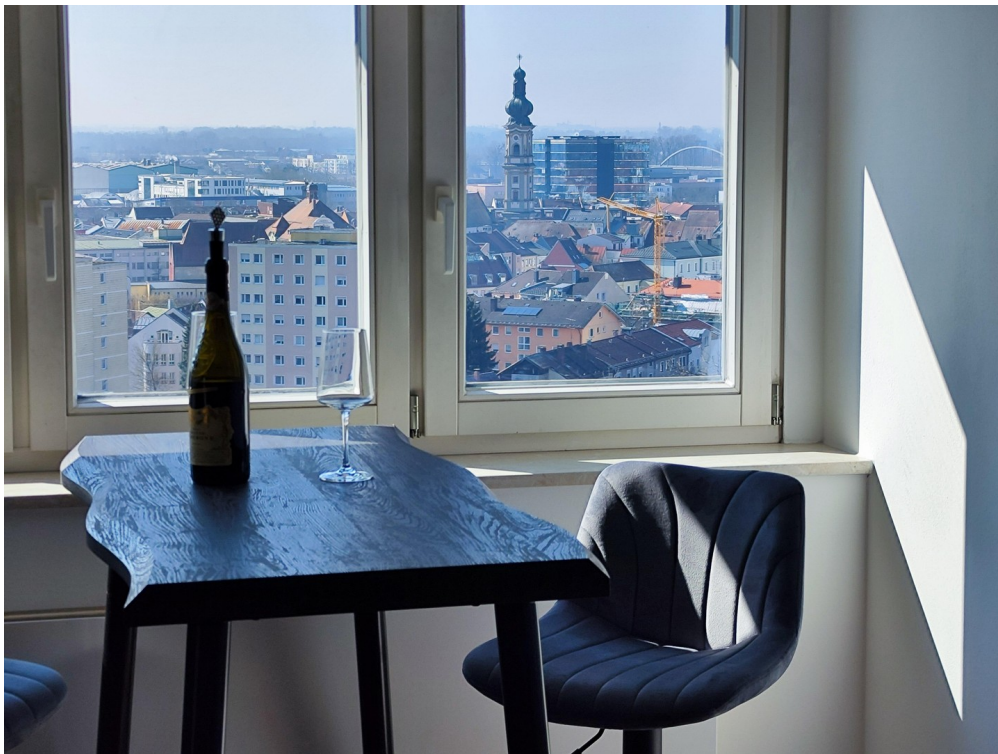
Möbel zur Veranschaulichung