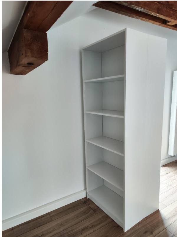
Möbel zur Veranschaulichung