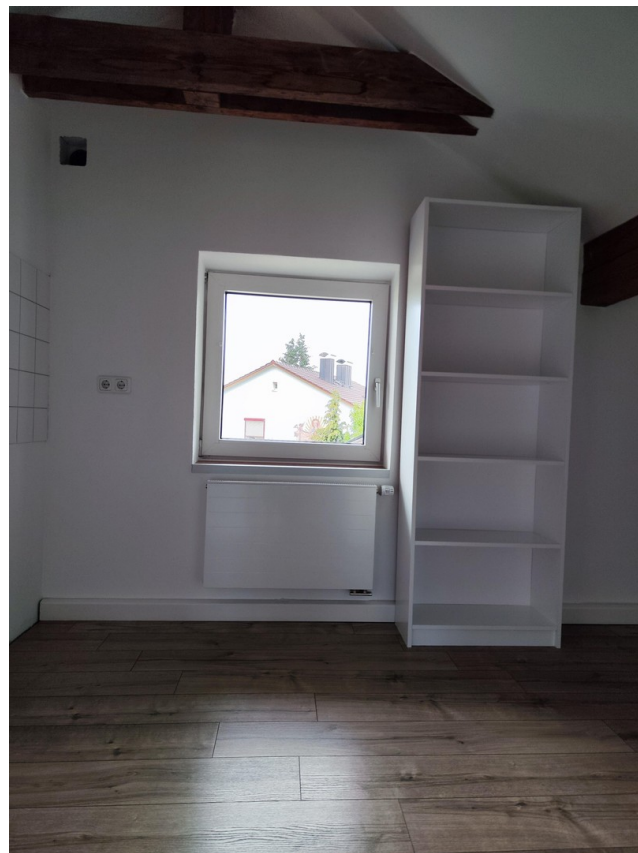
Möbel zur Veranschaulichung