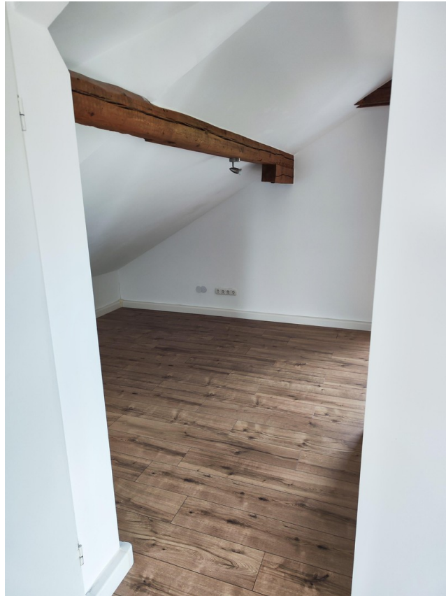
Möbel zur Veranschaulichung