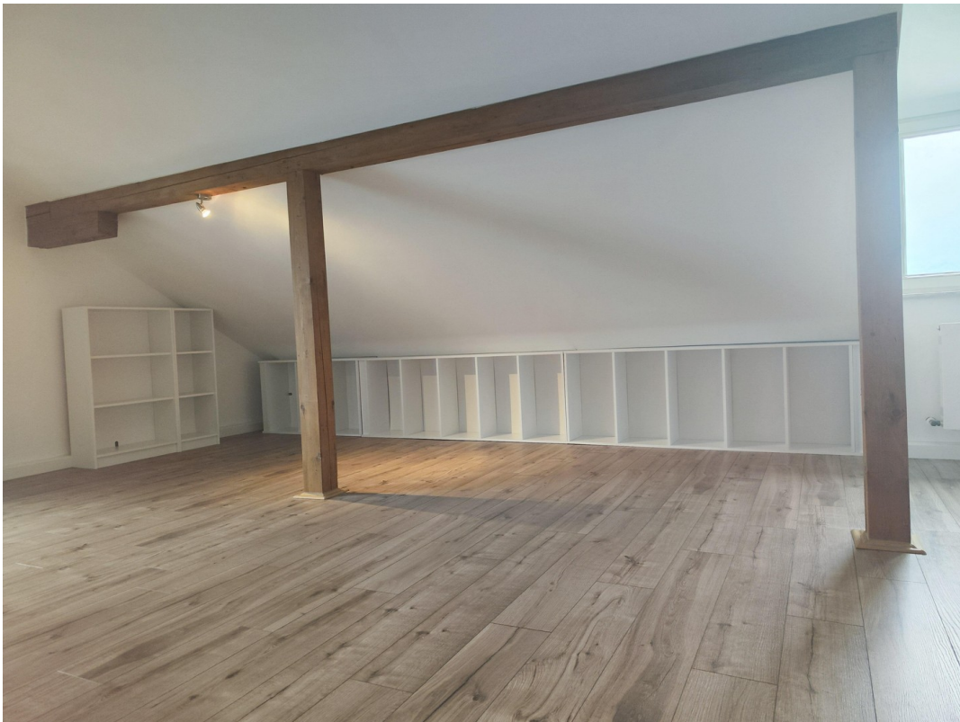
Möbel zur Veranschaulichung