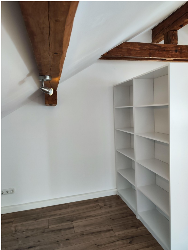
Möbel zur Veranschaulichung