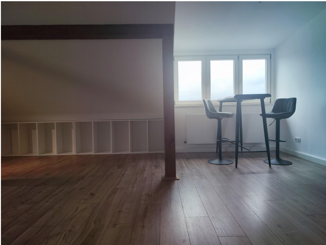
Möbel zur Veranschaulichung