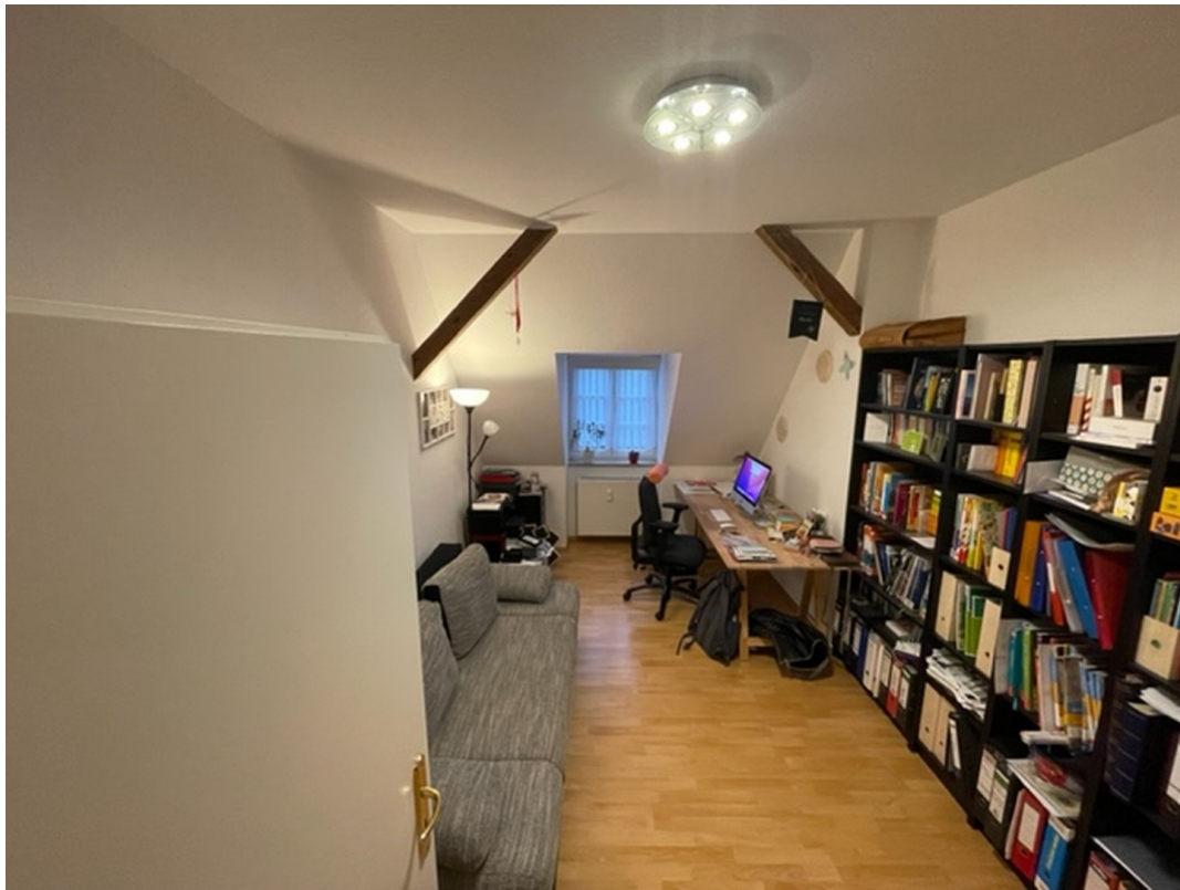
Wohn- / Arbeitszimmer