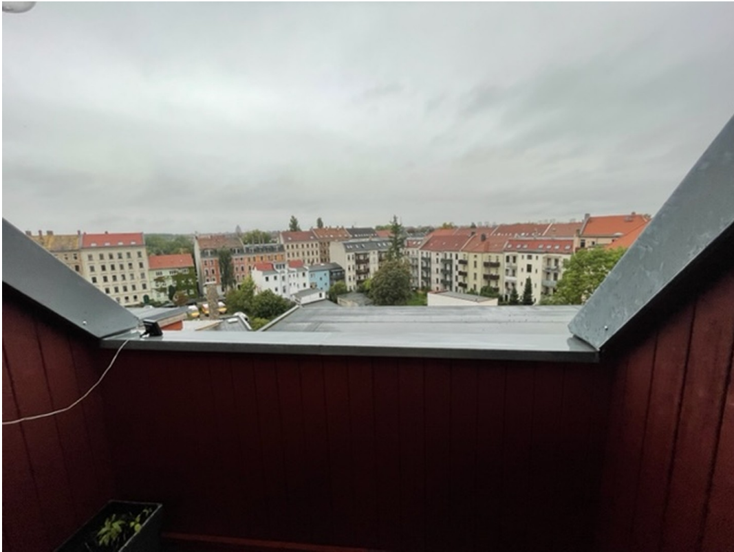
Balkon im oberen Bereich