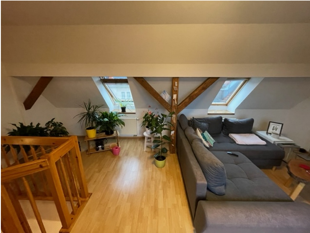
Wohnzimmer im oberen Bereich