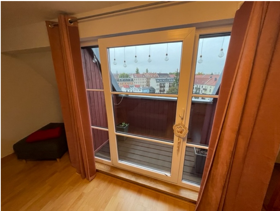
Balkon im oberen Bereich