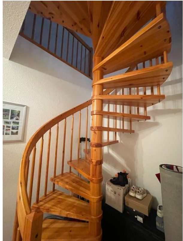
Wendeltreppe is Dach