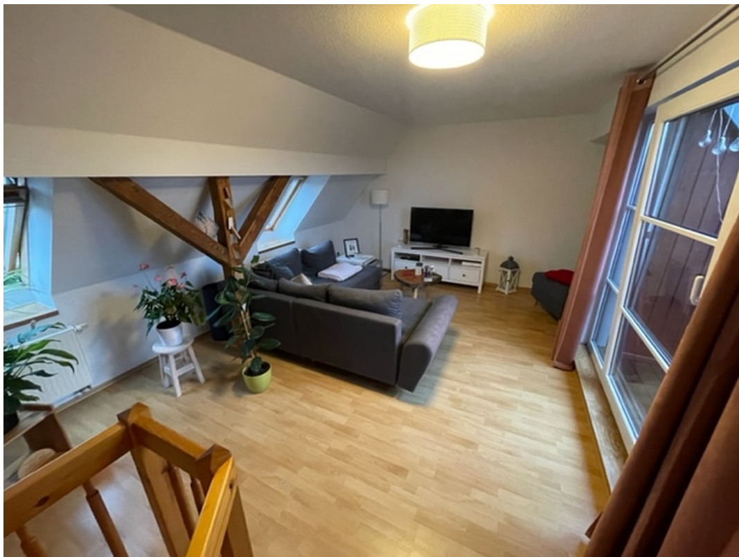
Wohnzimmer im oberen Bereich