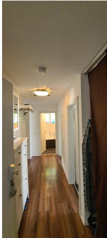
Flur mit Mobiliar