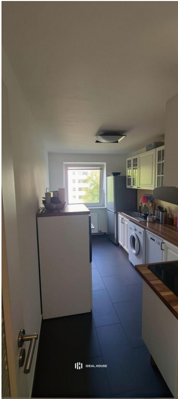
Küche mit Mobiliar