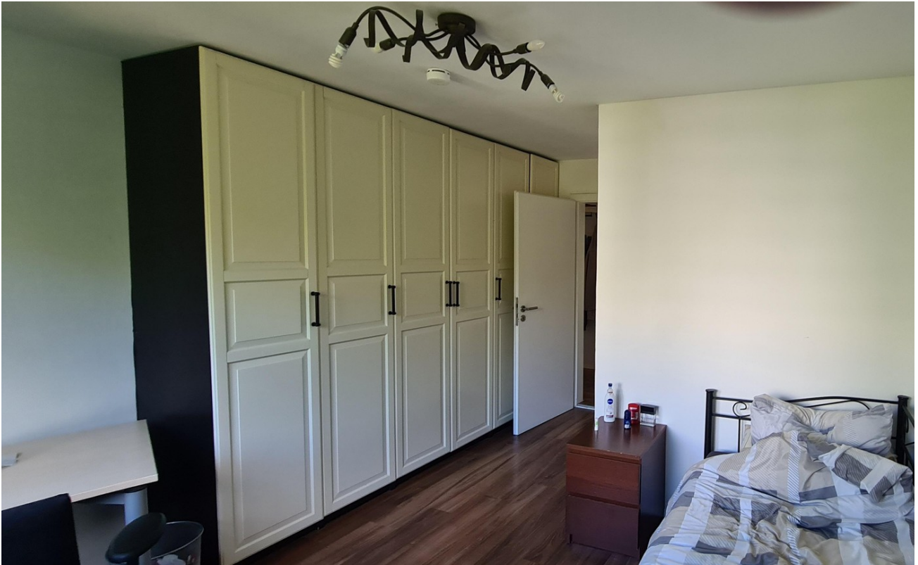
Schlafzimmer mit Mobiliar