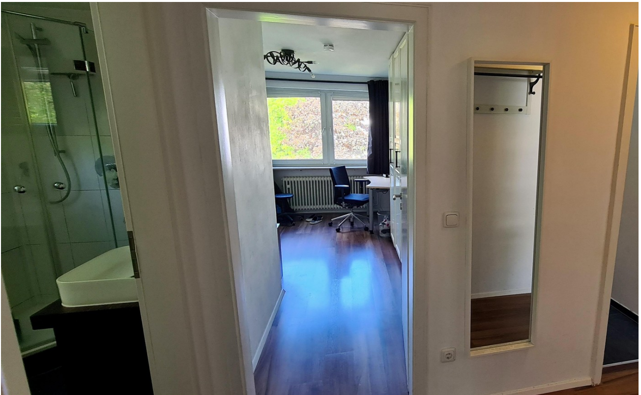
Blick Flur ins Schlafzimmer