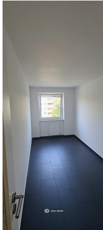
Küche ohne Mobiliar