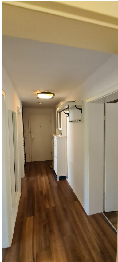
Flur Blick zur Eingangstür