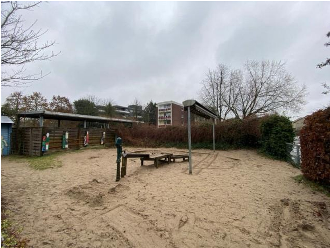
Garten mit Spielgeräten