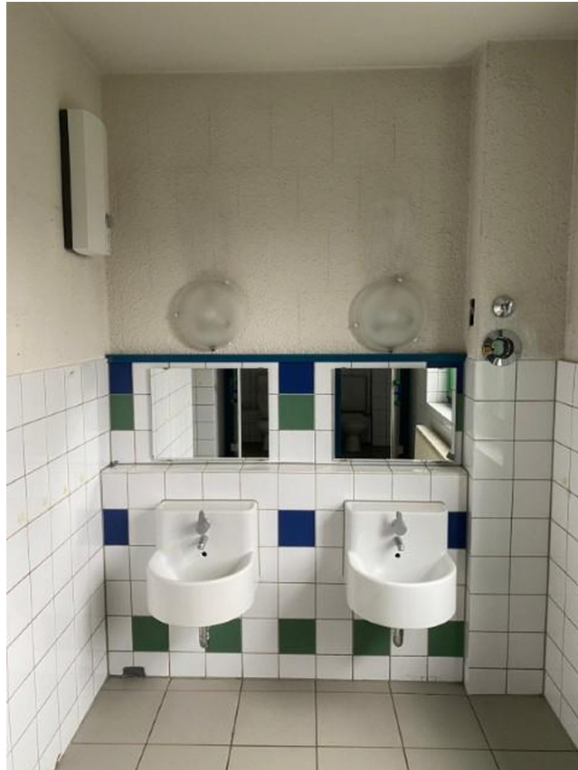
Kinder - WC