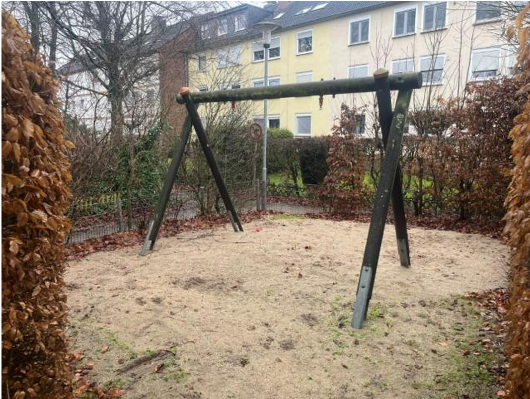
Garten mit Schaukel