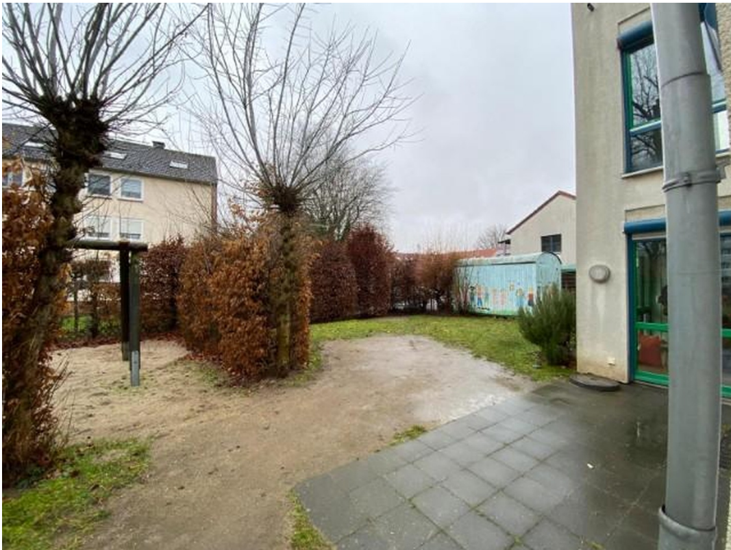
Garten mit Terrasse