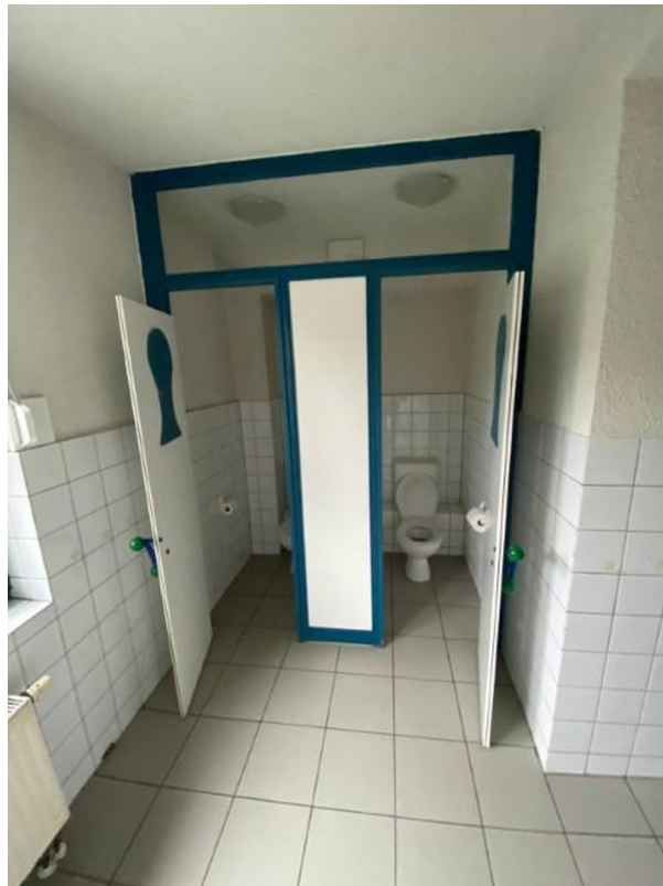
Kinder - WC