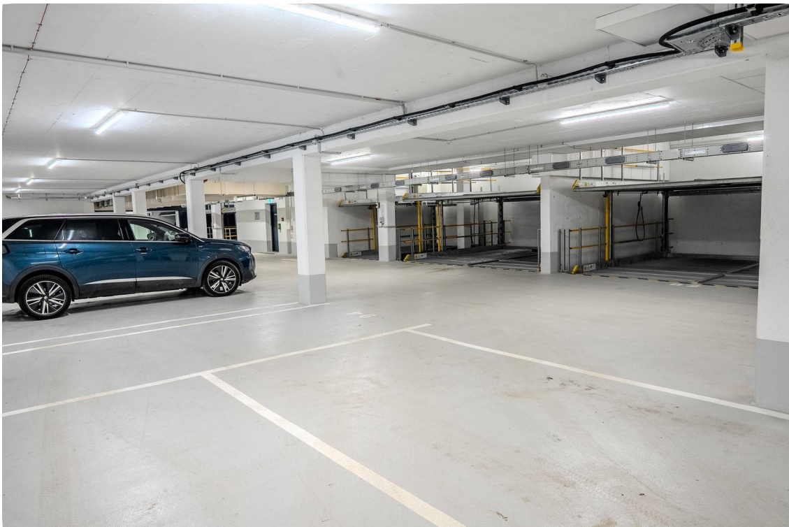
Parkplatz (Auf Wunsch)