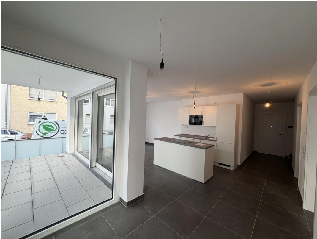
Wohnküche mit Blick auf Balkon