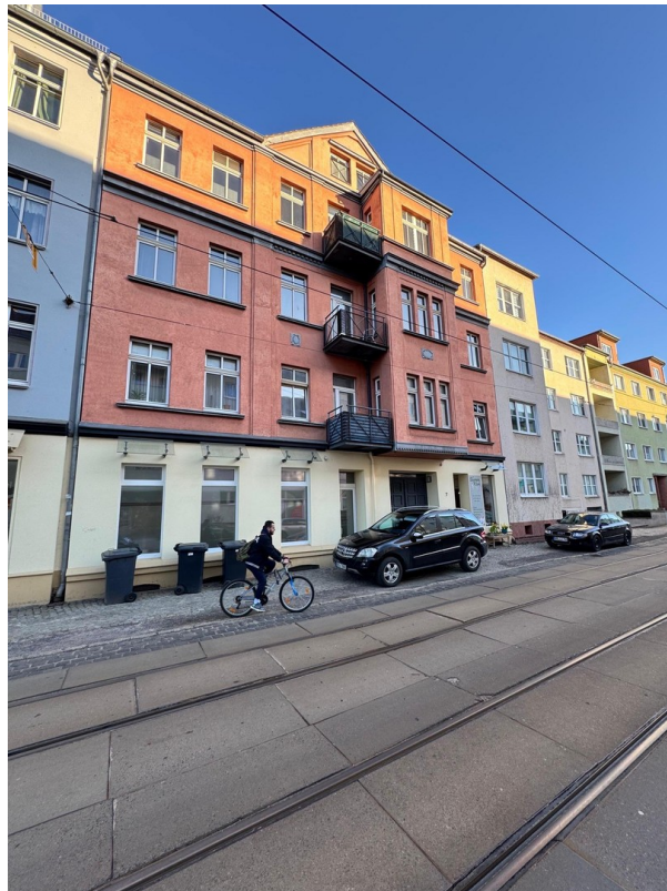
Verkehrssituation vor dem Haus