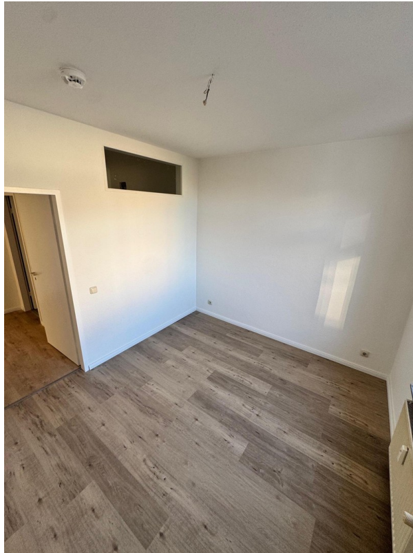
3. Zimmer neben Bad