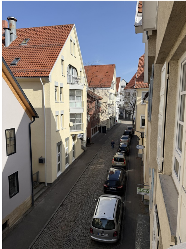
Blick in die ruhige Straße