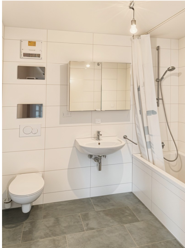
Frisch genoviertes Bad