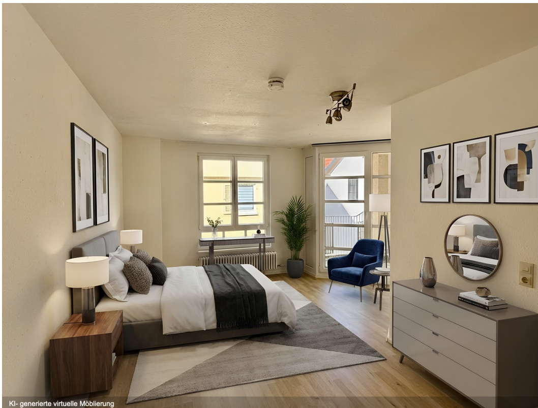
Einrichtungsbsp. SZ, KI-gen.