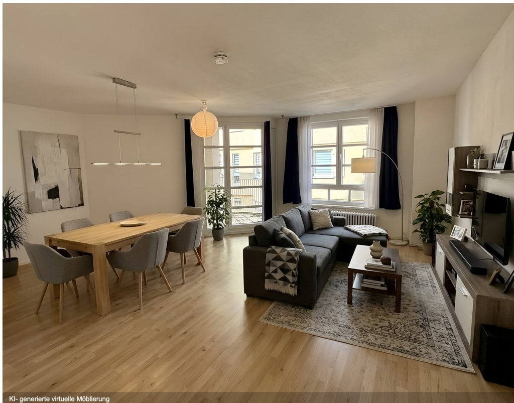
Einrichtungsbsp. WZ, KI-gen.