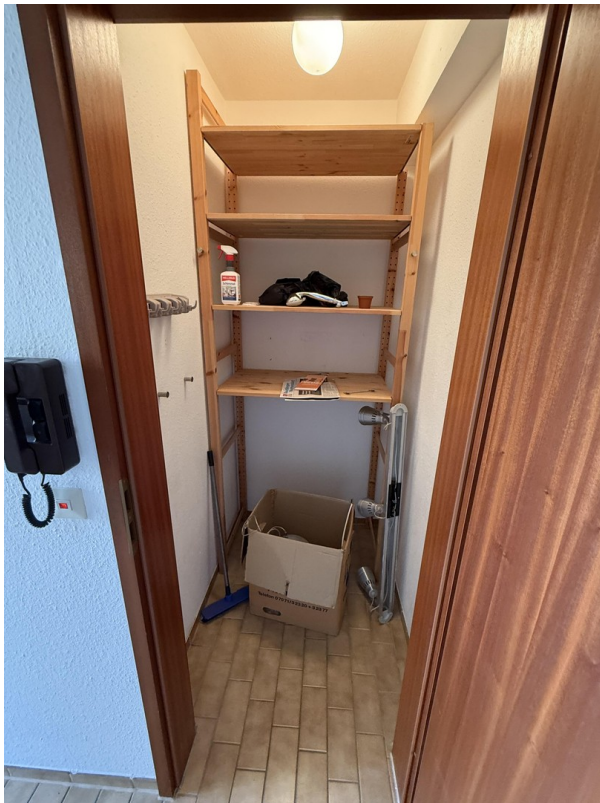
Abstellraum mit Regal