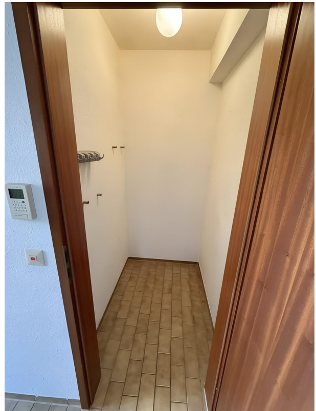
Abstellraum leer (KI)