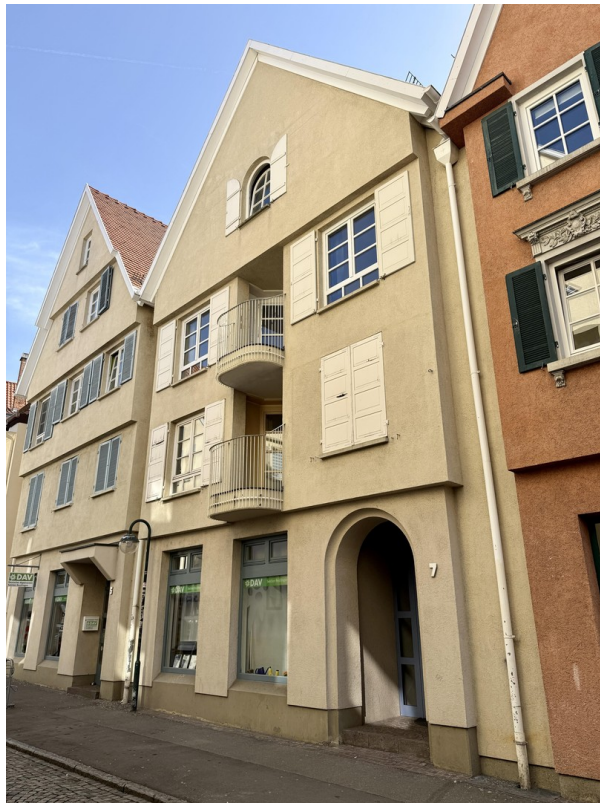
Wohnung mit Balkon im 2. OG