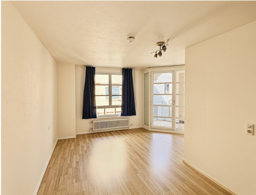
Schlafzimmer mit Balkonzugang