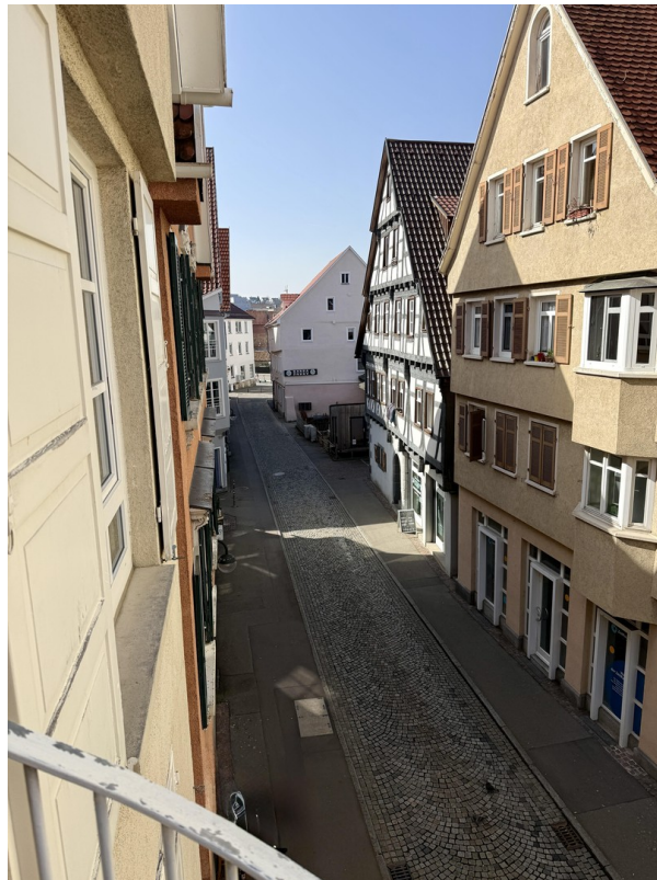
Zentrale, aber ruhige Lage