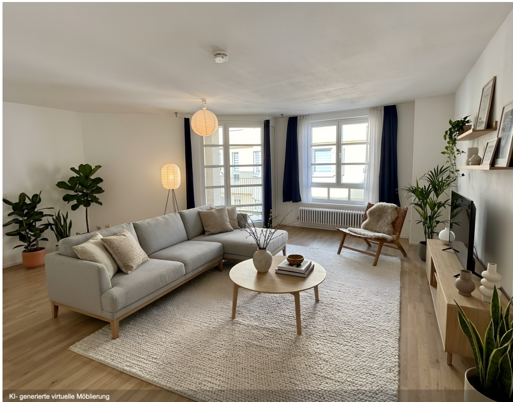
Einrichtungsbsp. WZ, KI-gen.