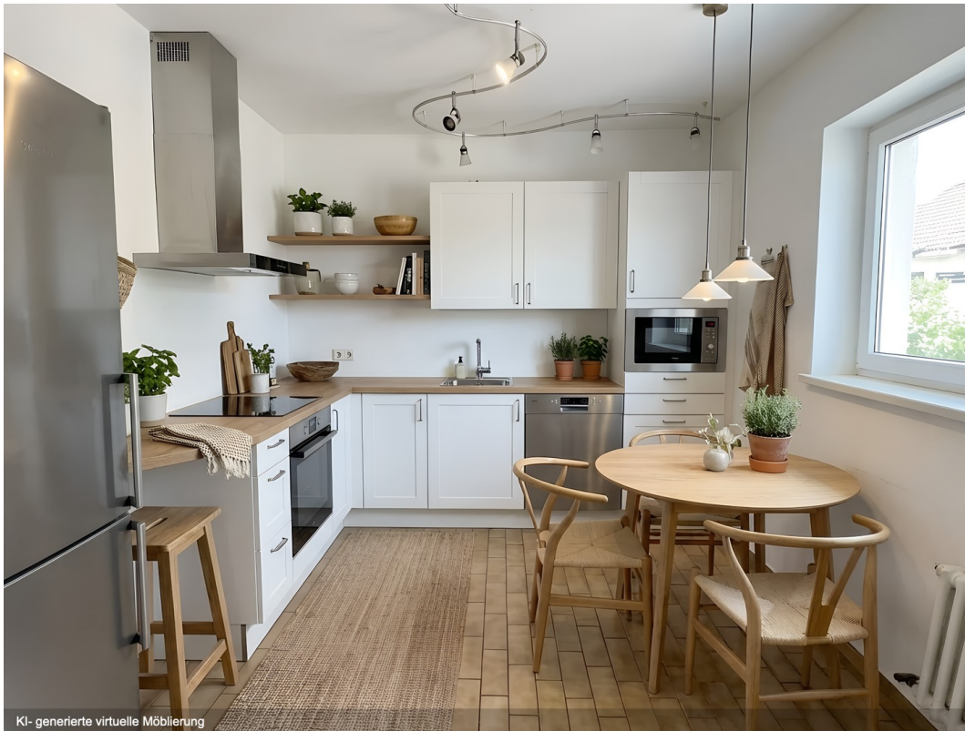
Einrichtungsbsp. Küche, KI