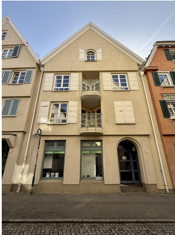
Außenansicht, Wohnung im 2. OG