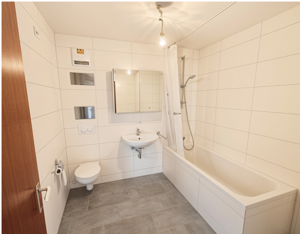
Frisch renoviertes Bad