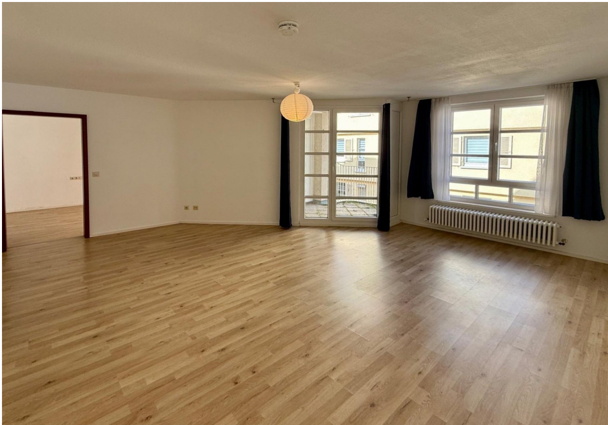
Wohnzimmer mit Balkonzugang