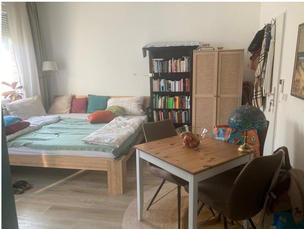
1. OG WZ