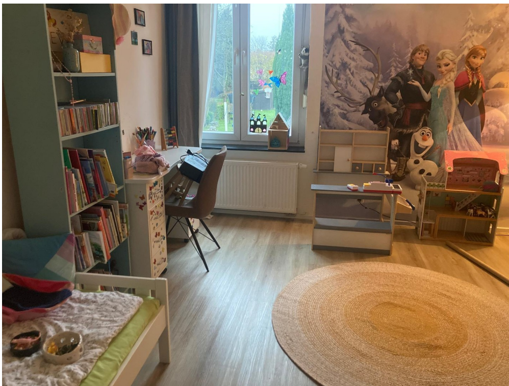
1. OG SZ