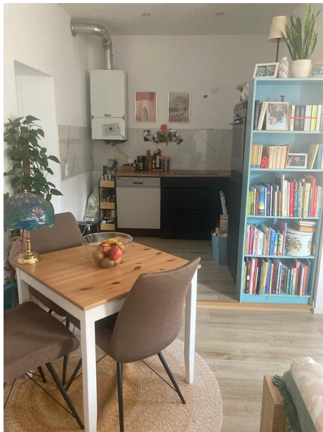
1. OG Küche