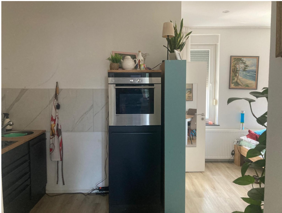
1. OG Küche