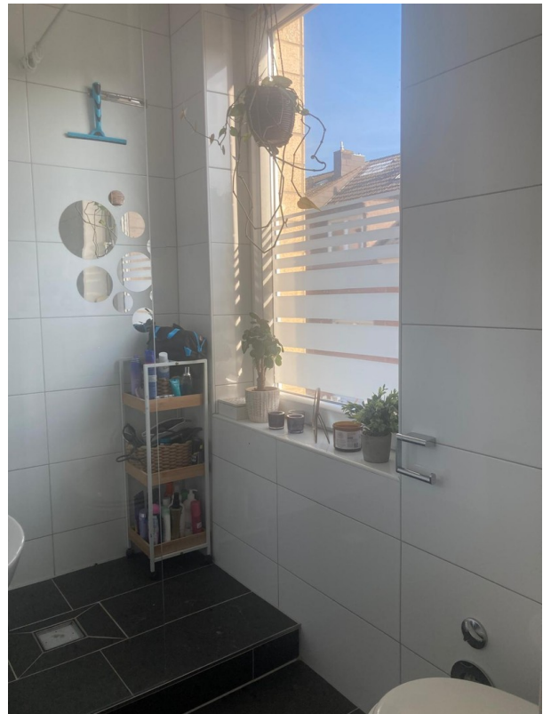
1. OG Dusche/WC