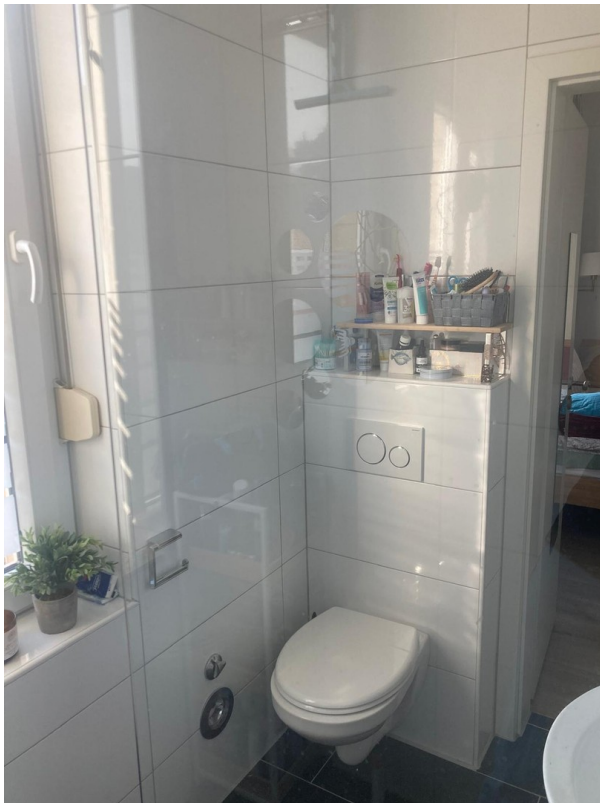
1. OG Dusche/WC