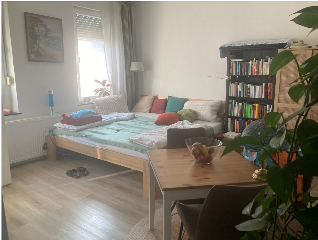
1. OG WZ