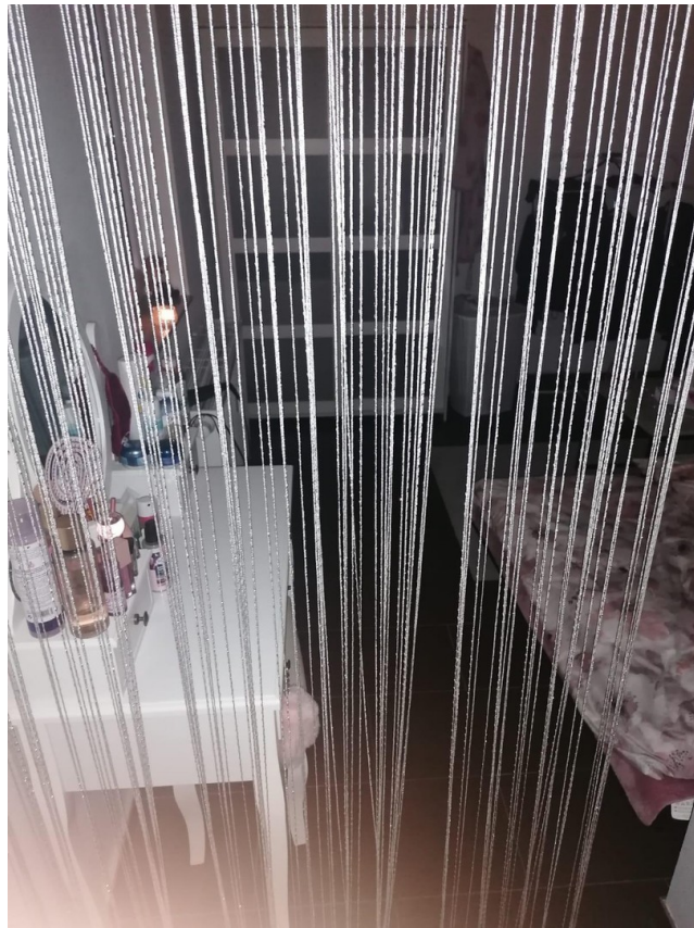
Anbau zum SZ