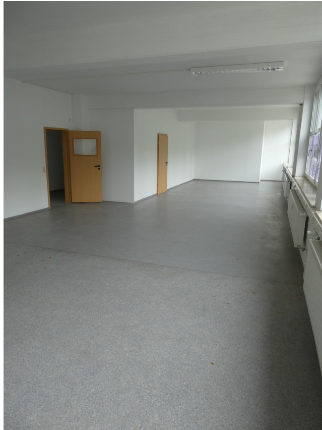
Fläche 1 OG