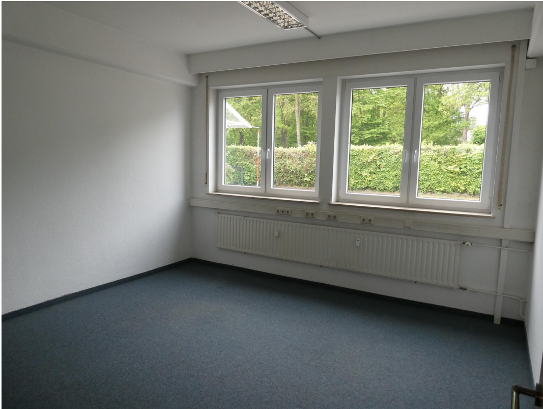
Büro 1 EG