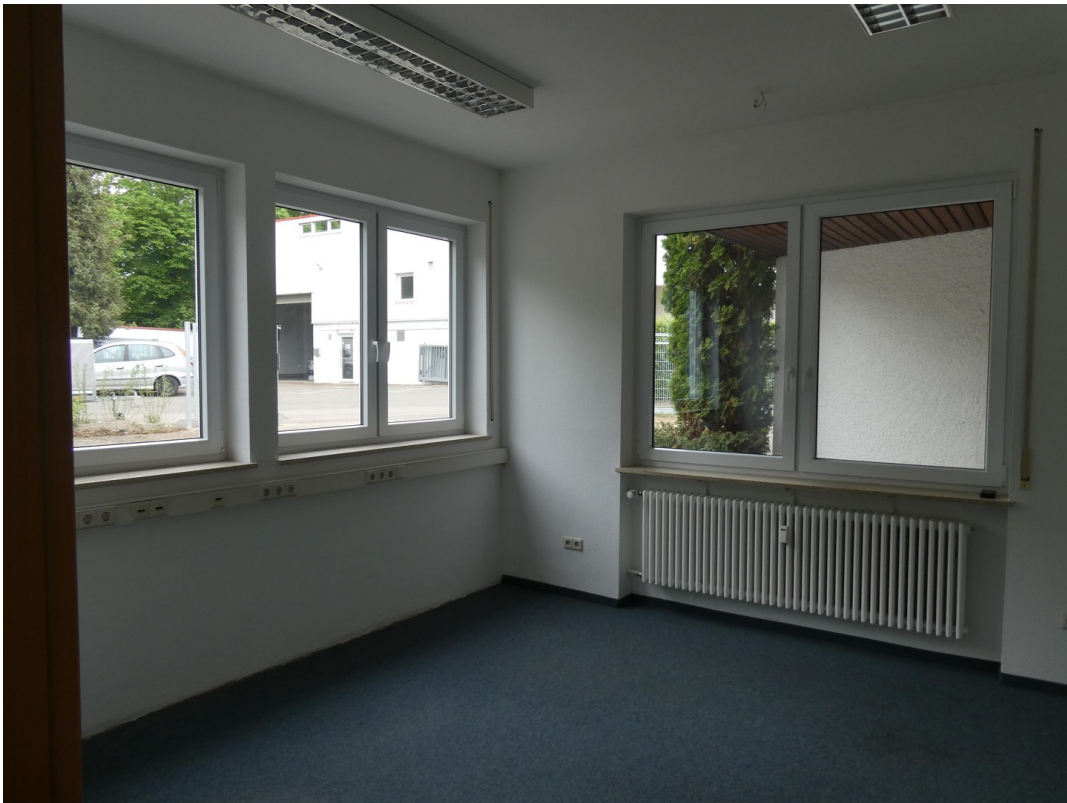
Büro 2 EG