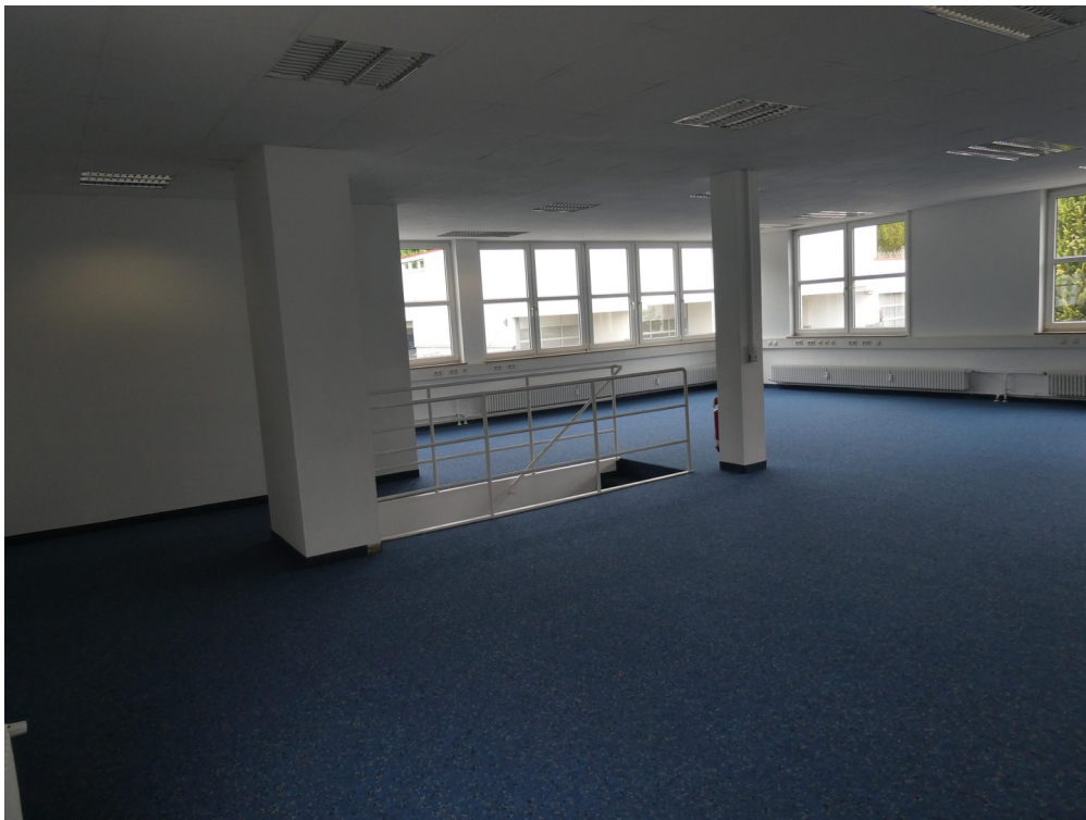
Fläche 2 OG