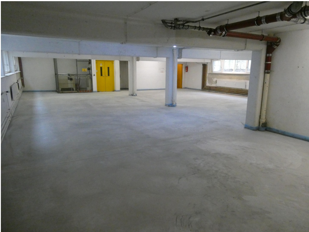
Fläche 1 Keller