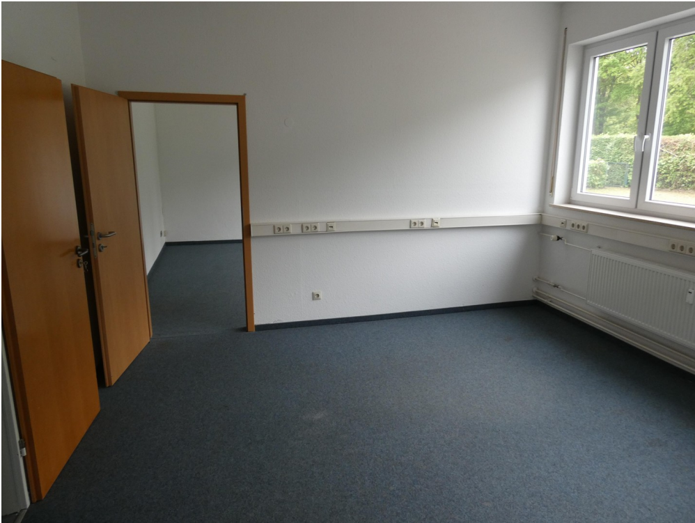
Büro 3 EG