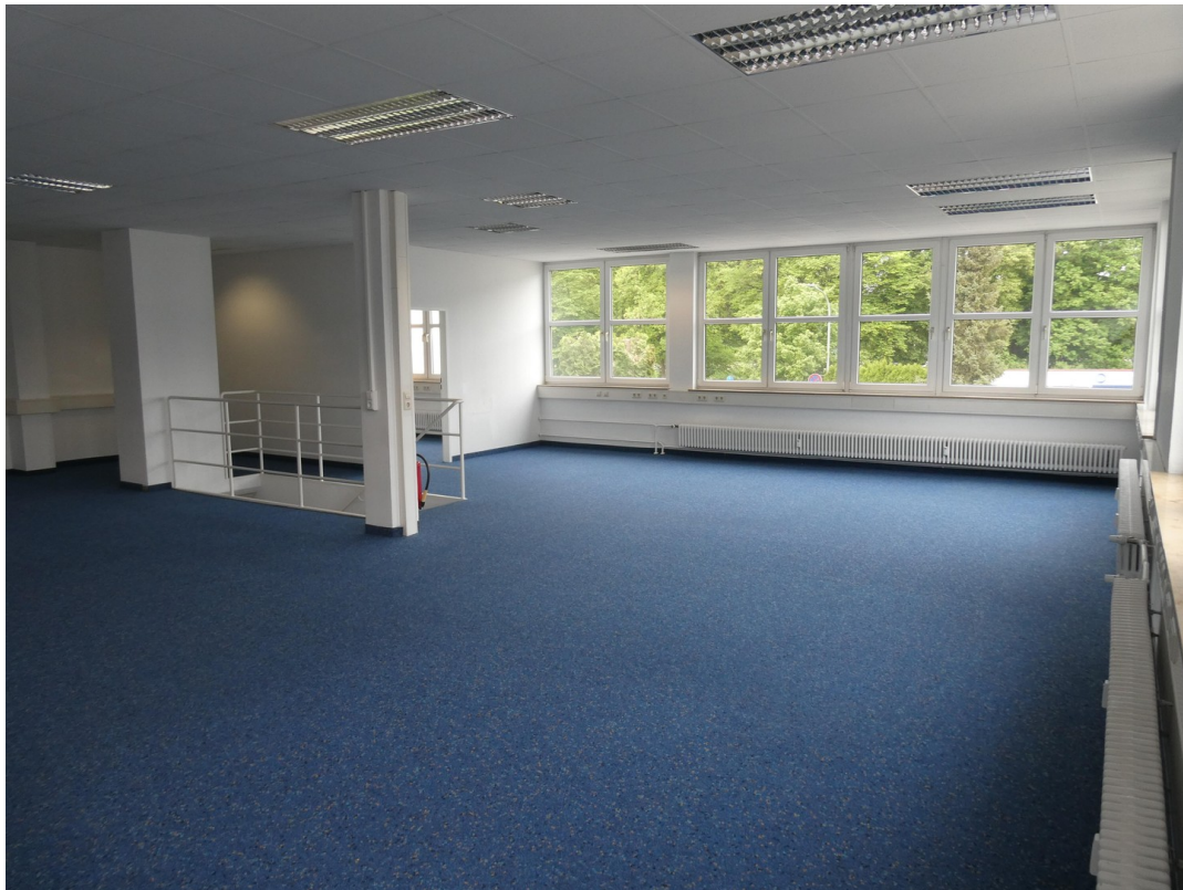
Fläche 2 OG