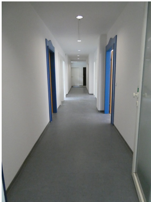
Flur vor Büros EG