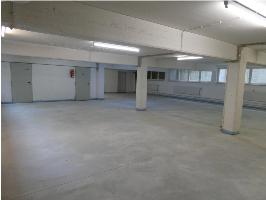
Fläche 1 Keller