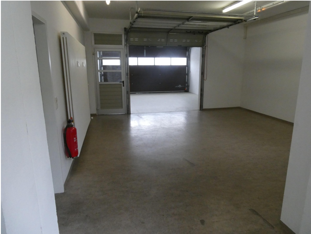
Ausgang 1 mit Rolltoren EG