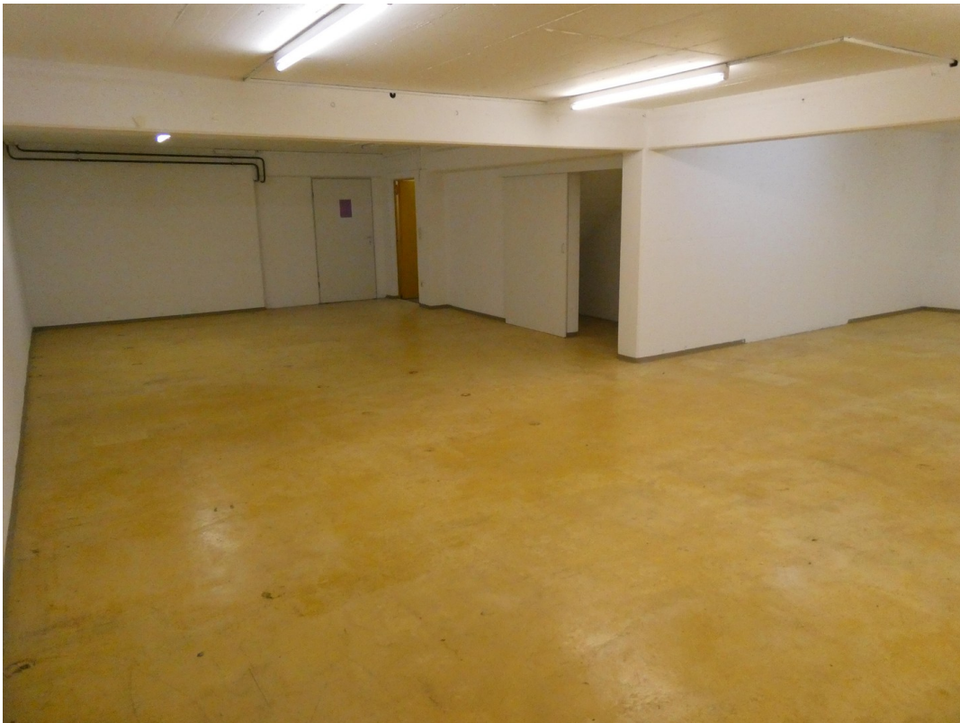
Fläche 2 Keller