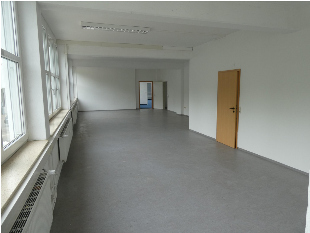
Fläche 1 OG