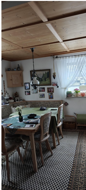
1 OG Esszimmer