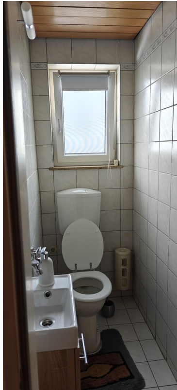
1 OG WC