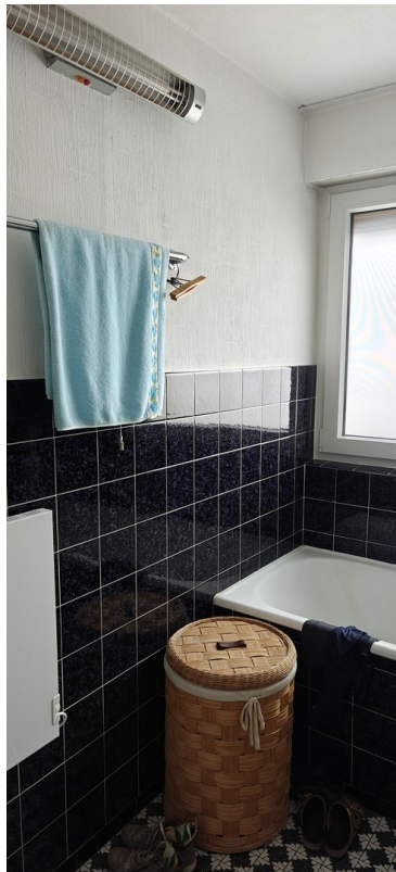
1 OG Bad