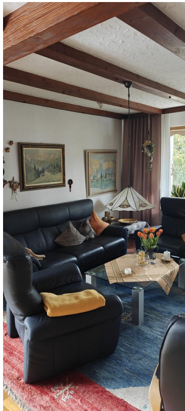
1 OG Wohnzimmer