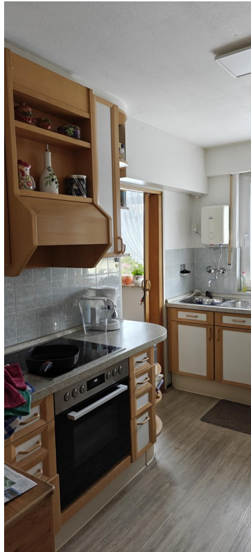
1 OG Küche