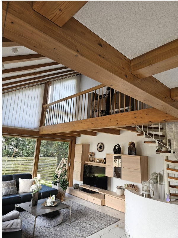
Wohnbereich mit Galerie EG