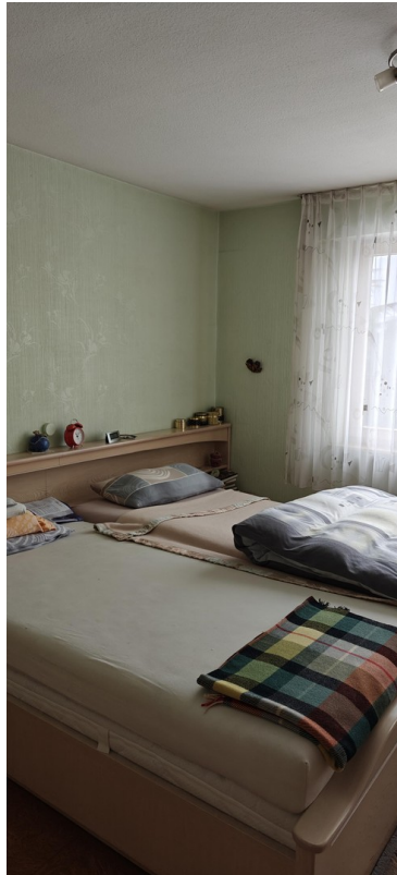
1 OG Schlafzimmer