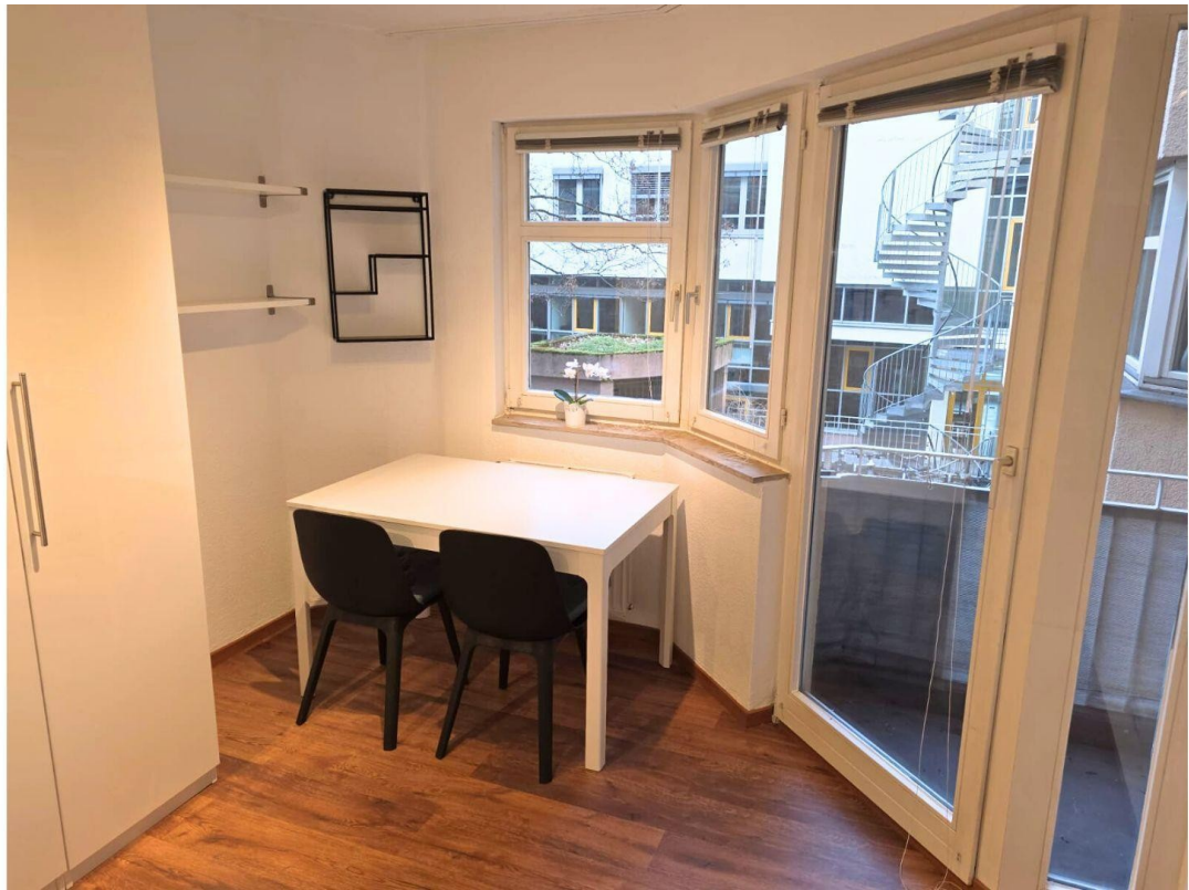
Wohnbereich mit Balkon