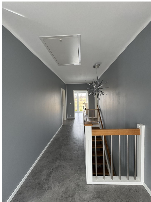
Flur im Obergeschoss