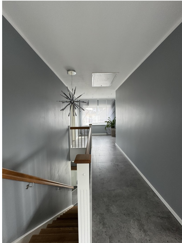
Flur im Obergeschoss