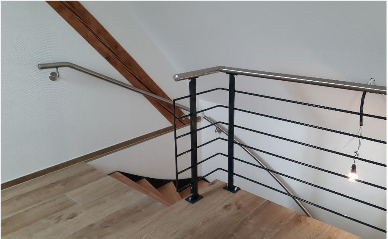
Geländer im Dachspitz