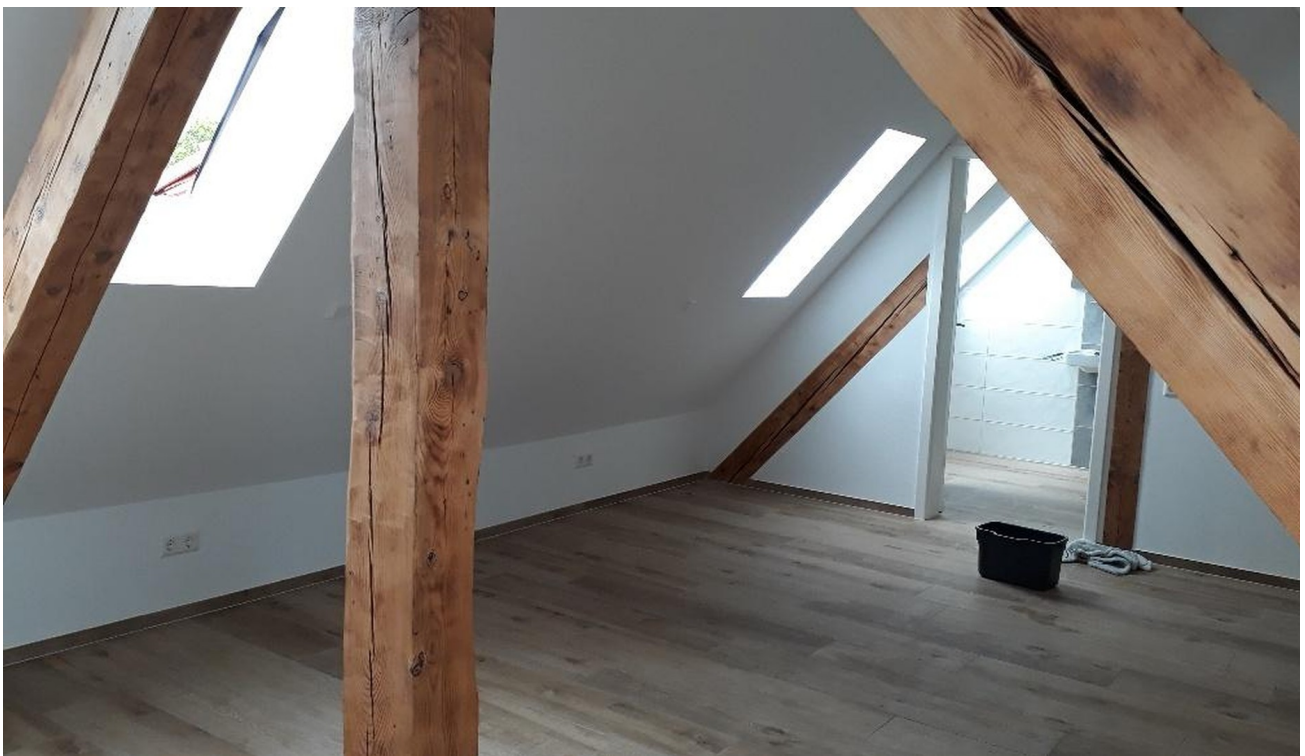
2.Schlafzimmer im Dachspitz