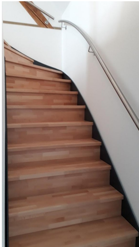
Treppe zur 2.Etage i.d. Whg.