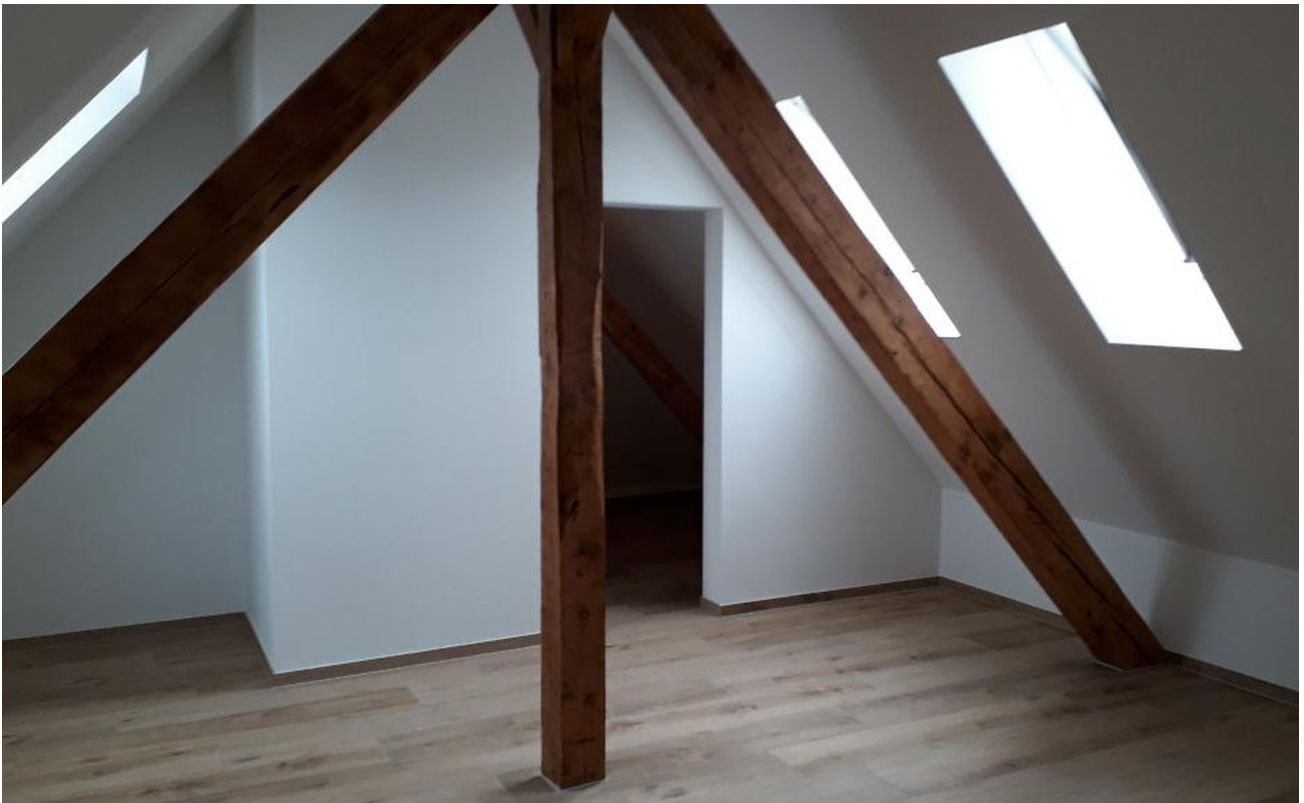
Offener Zugang Ankleide