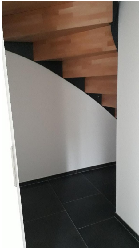
Abstellraum unter d. Treppe