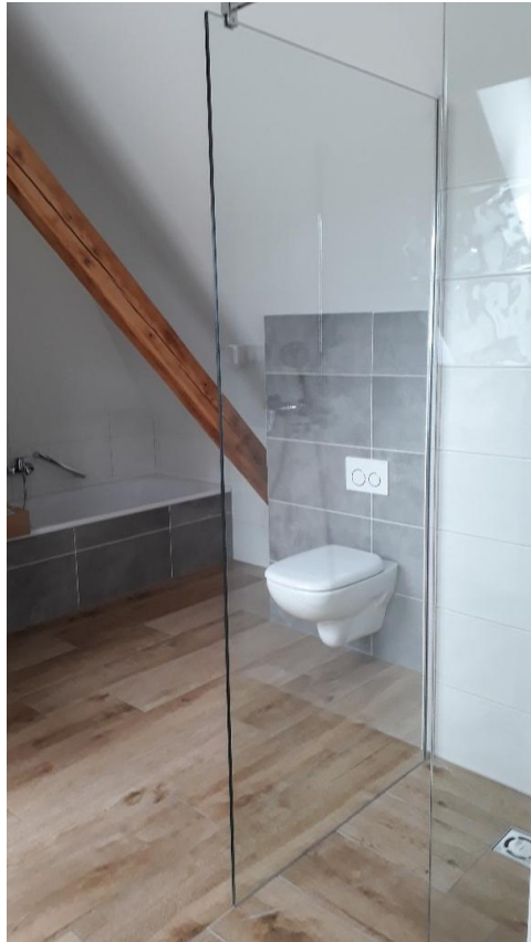
Badezimmer mit BW und Dusche