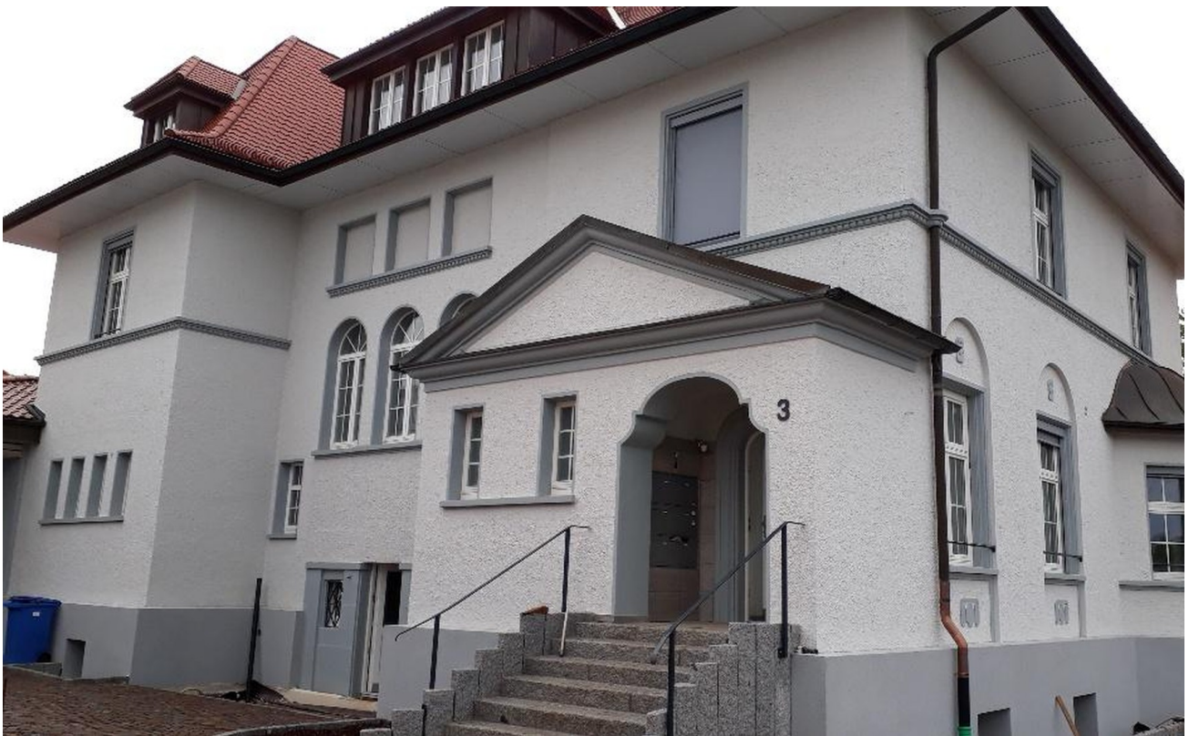
Haus Ansicht Nord