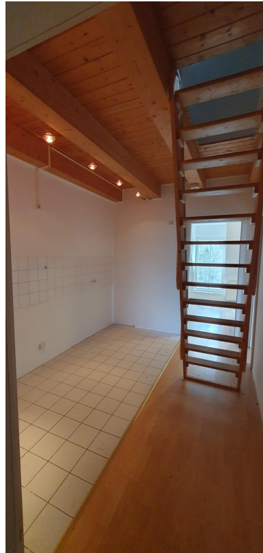
Küchenbereich zum Wohnraum