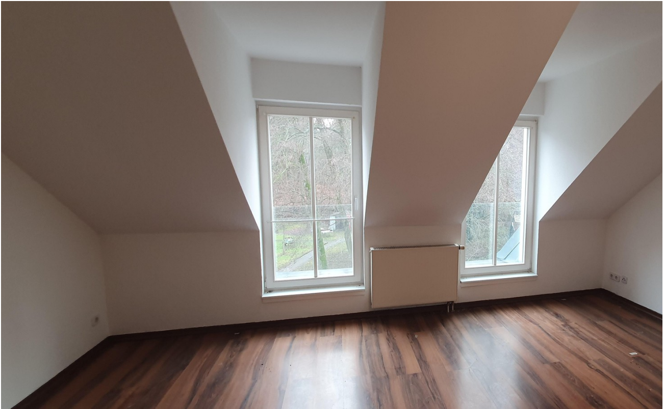
Wohnbereich zum Garten