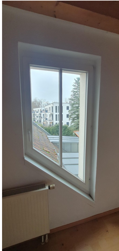
Blick vom kleinen Zimmer