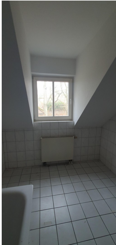
Gaube im Badezimmer