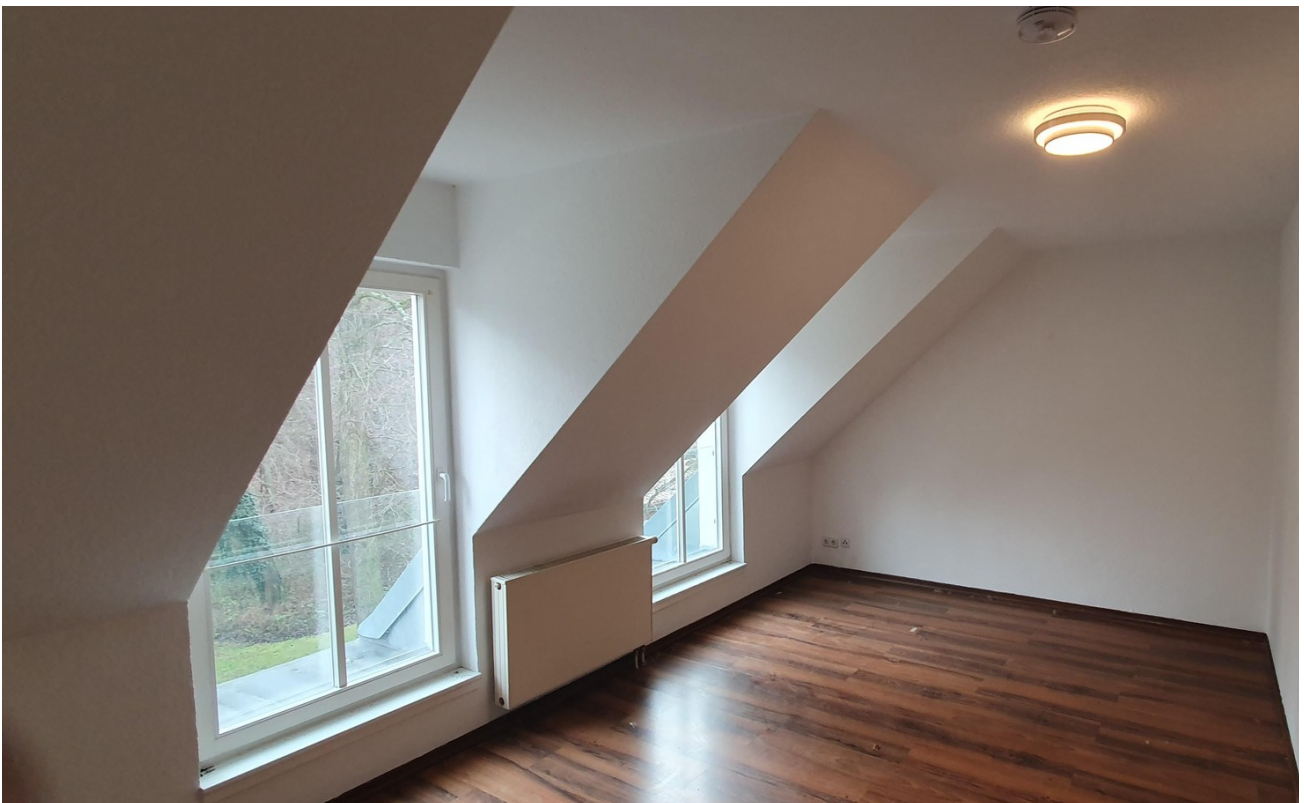
Wohnbereich nach rechts