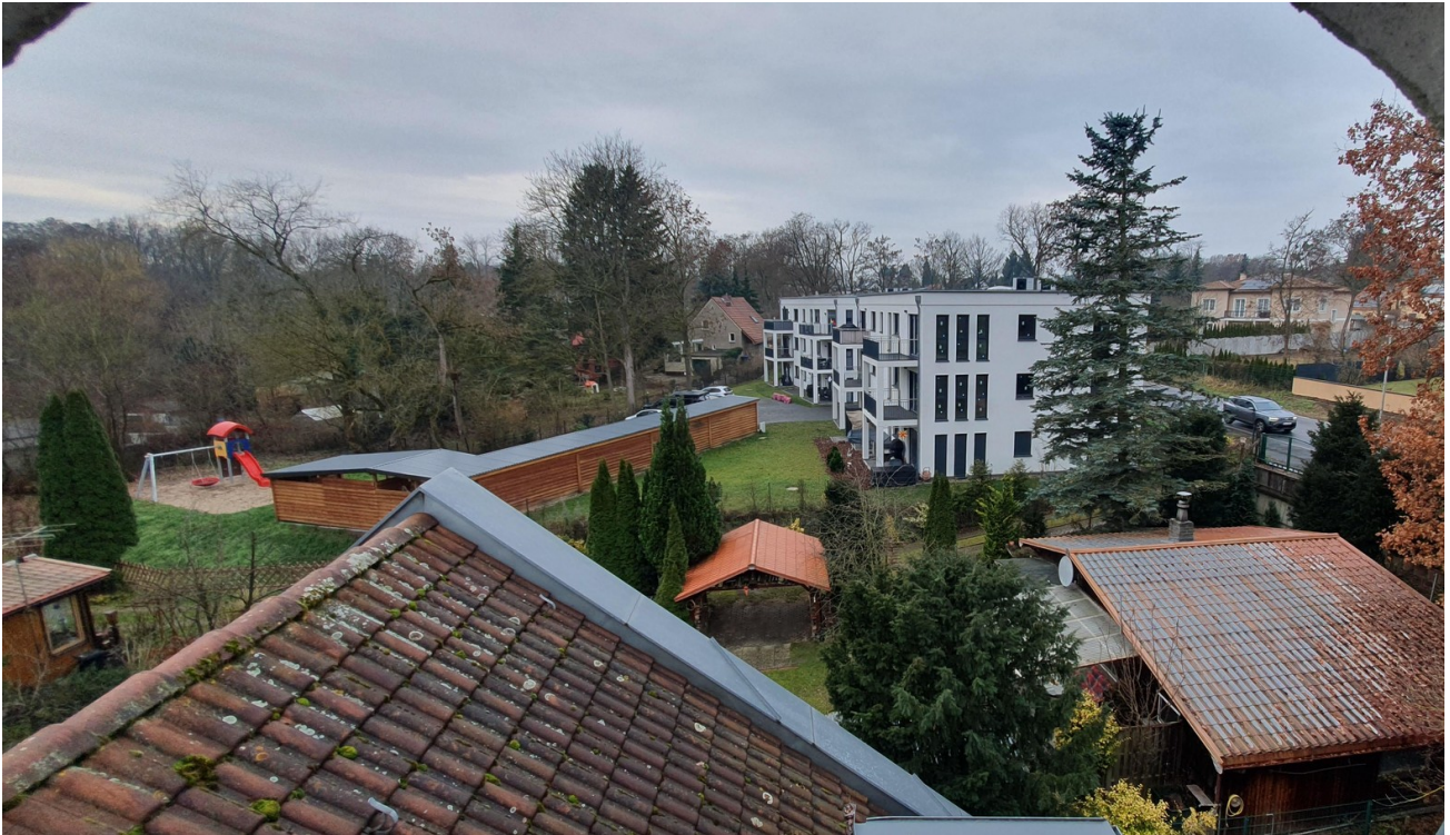
Blick vom Spitzboden