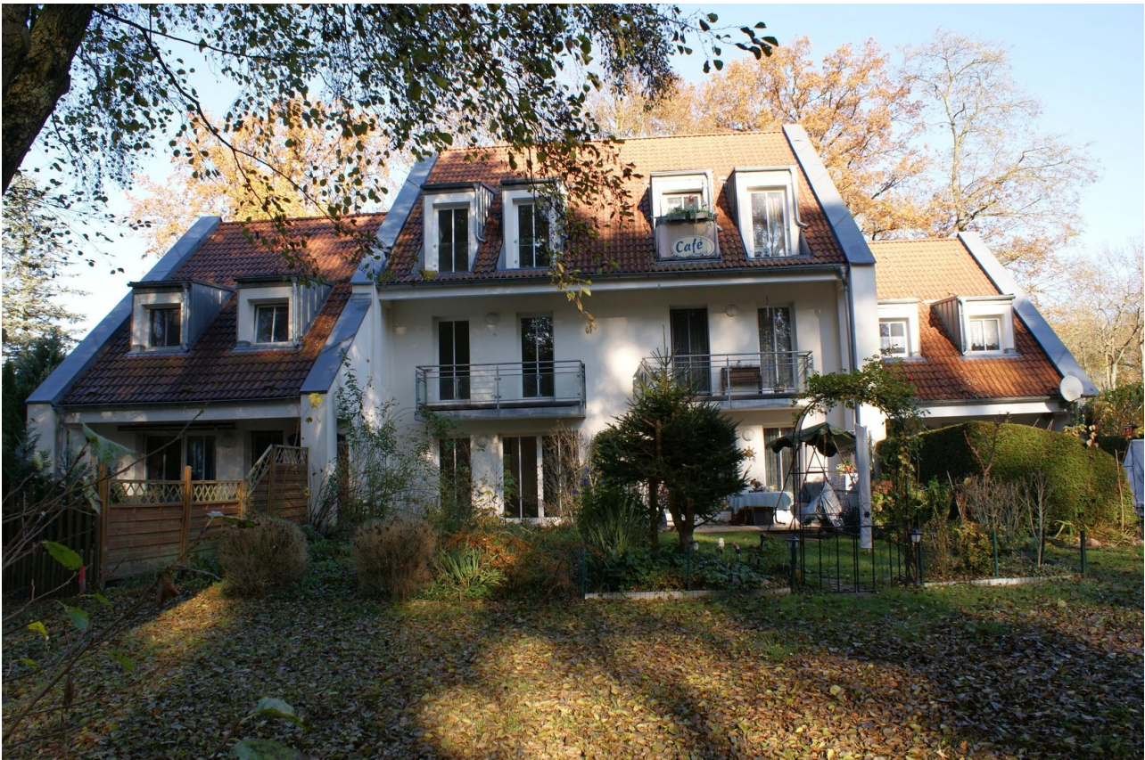
Wohneinheit DG in der Anlage