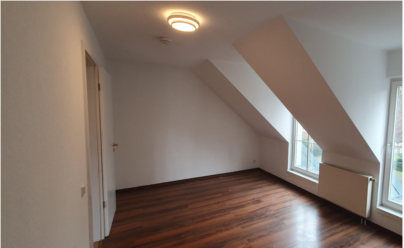
Wohnbereich nach links