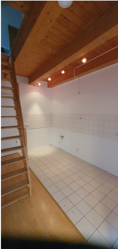
Küchenbereich mit Stiege