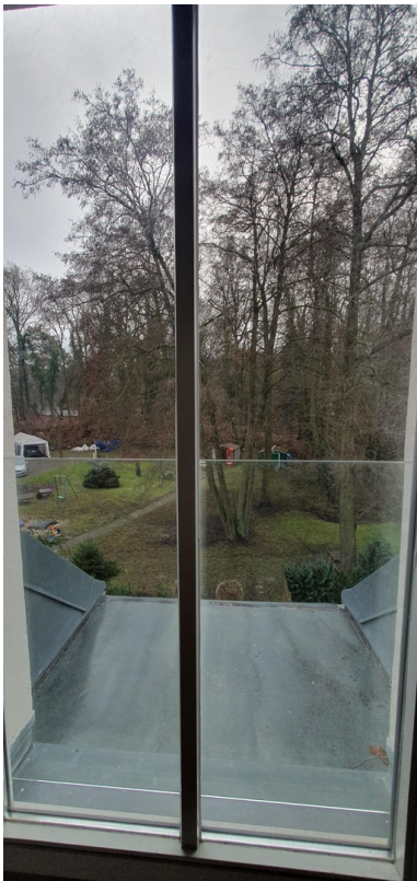
Blick aufs Grundstück