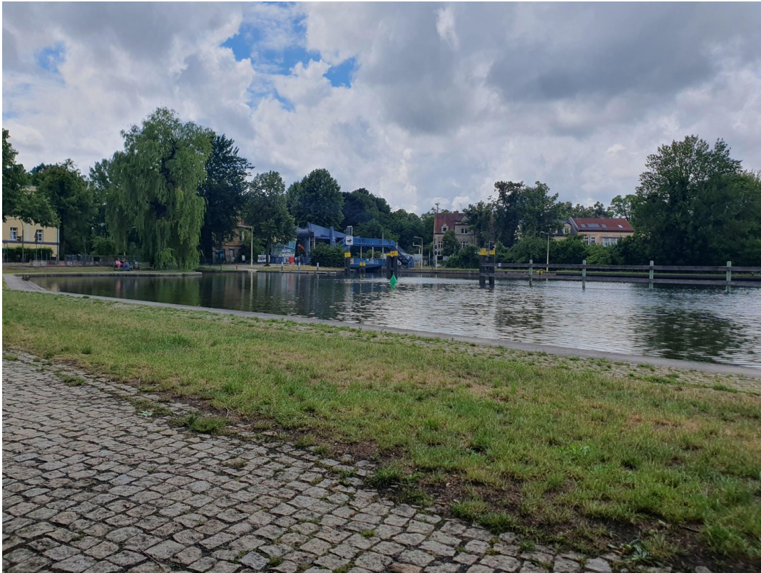
Erholung an der Schleuse