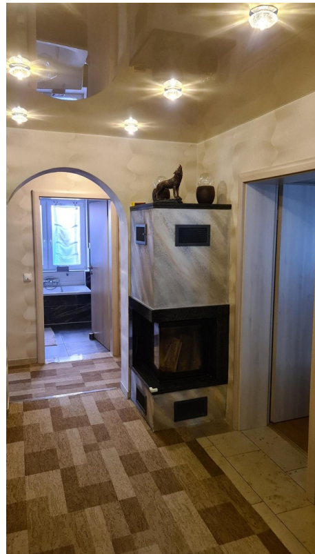
Flur mit Kamin