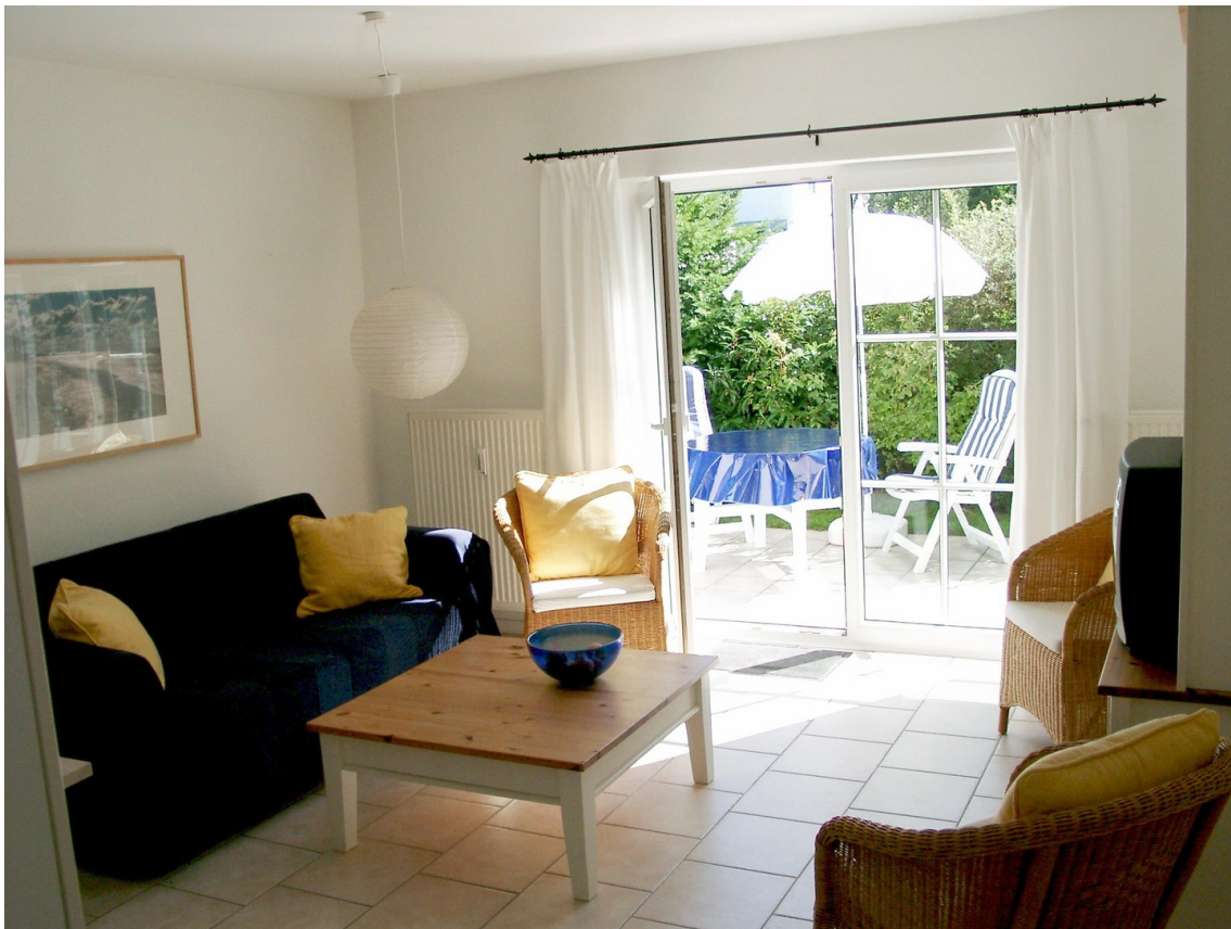
Wohnzimmer mit Terrasse