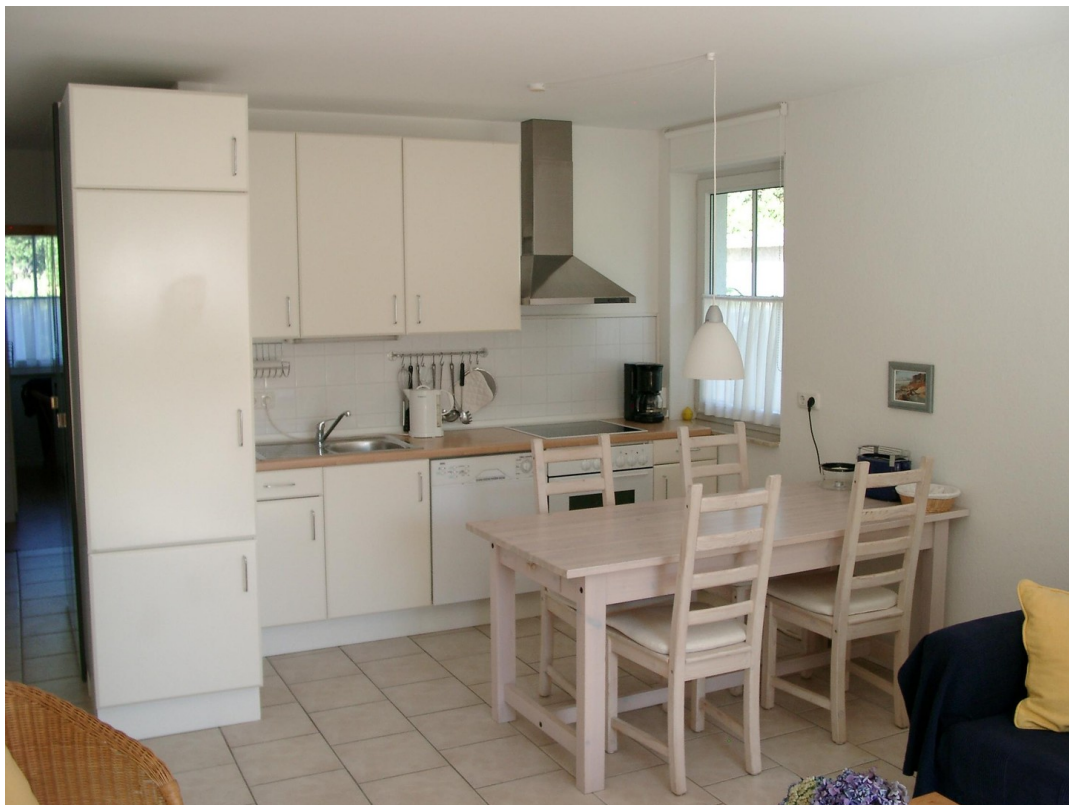
Küchenzeile mit Eßstisch