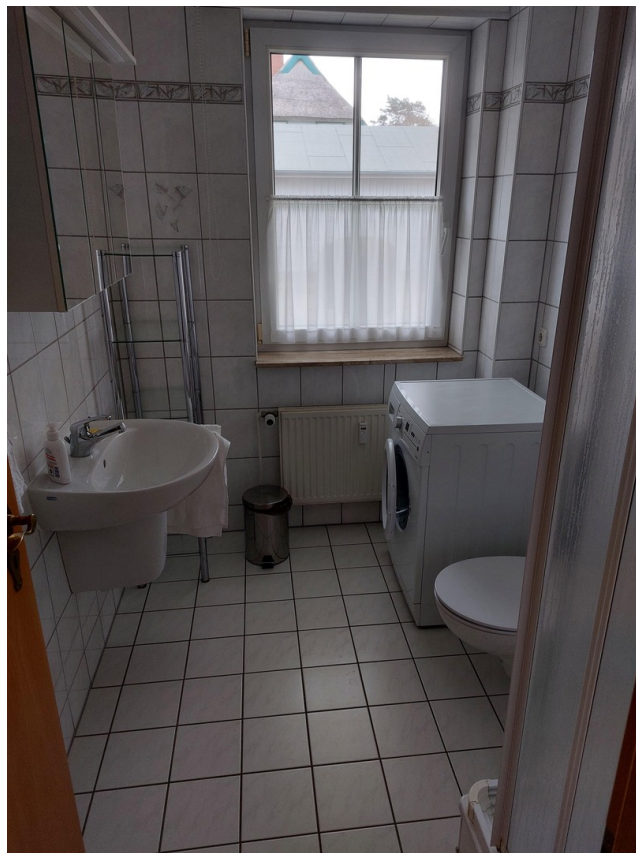
Bad mit Dusche u. Waschmaschine