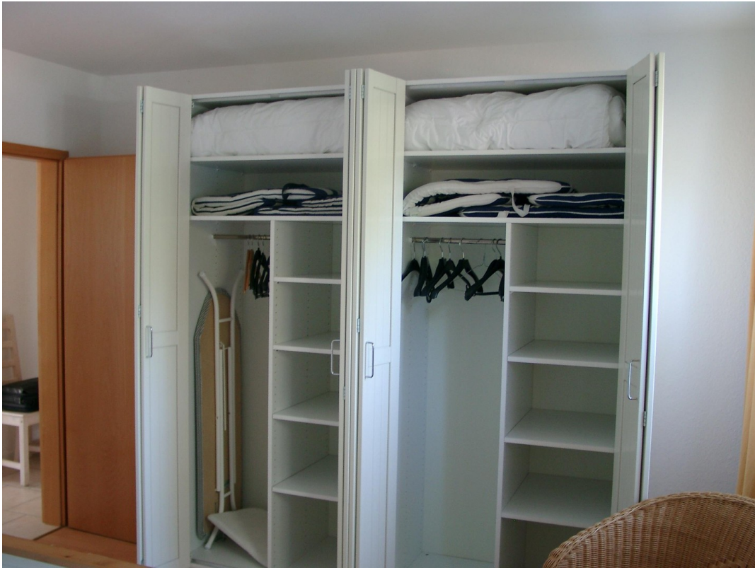
Schränke im Schlafzimmer