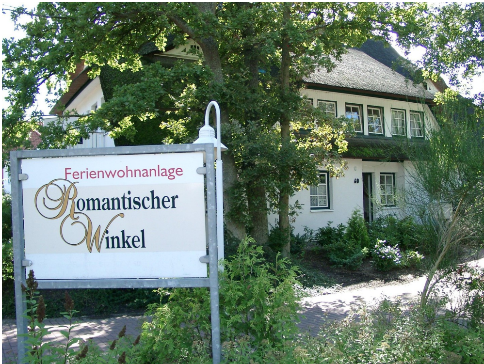
Eingangsbereich zum Grundstück