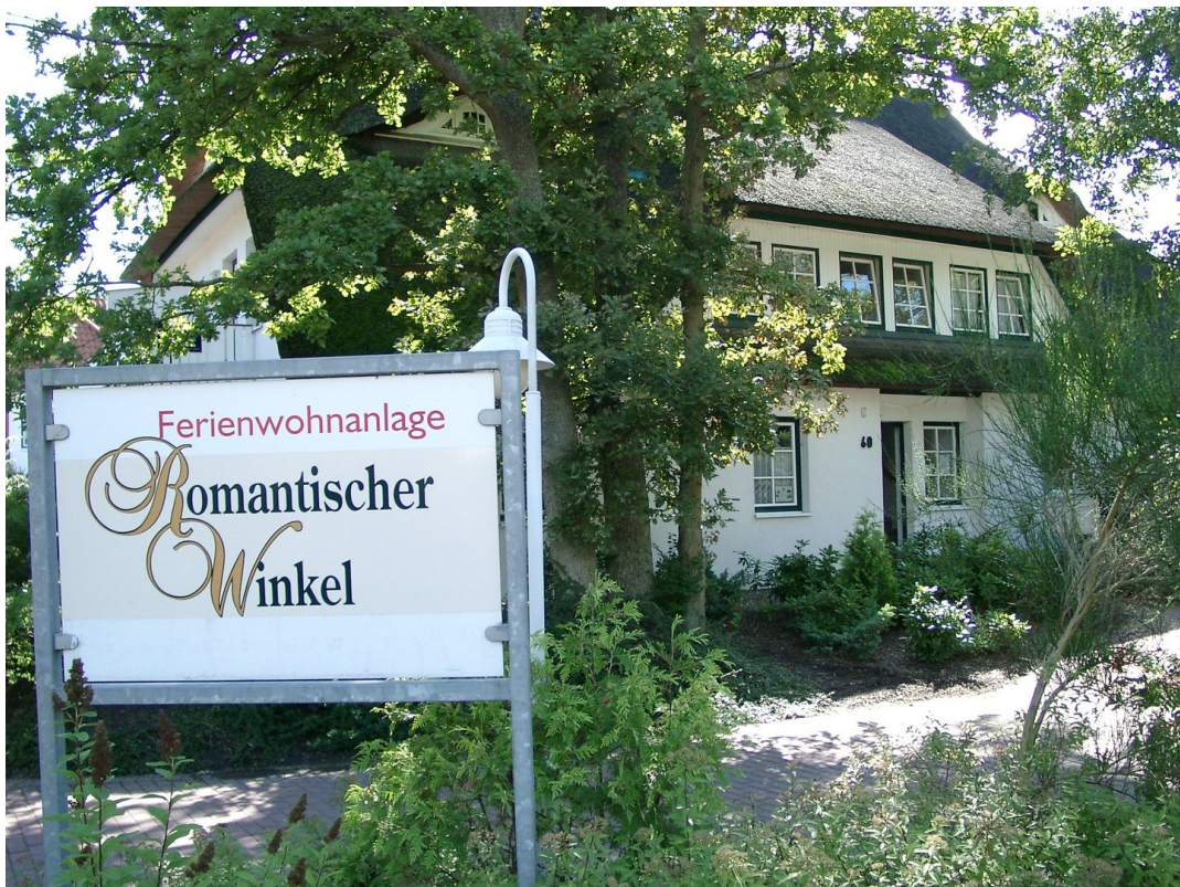
Eingangsbereich zum Grundstück