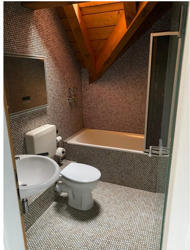
Bad mit WC und Badewanne