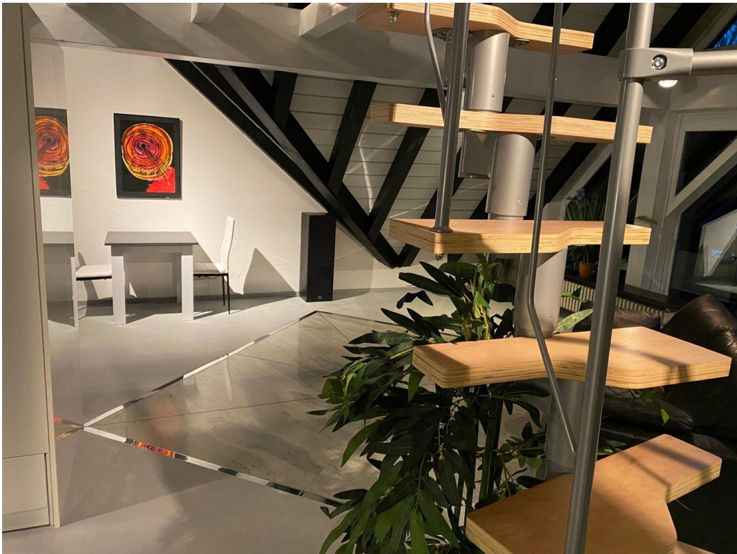
Treppe zur Galerie