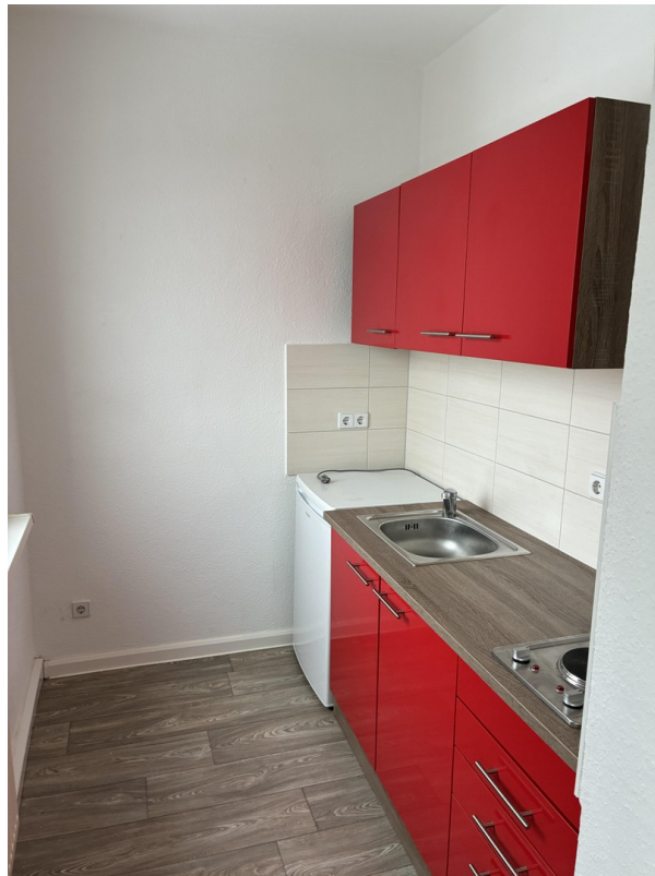
Küche mit kleiner EBK