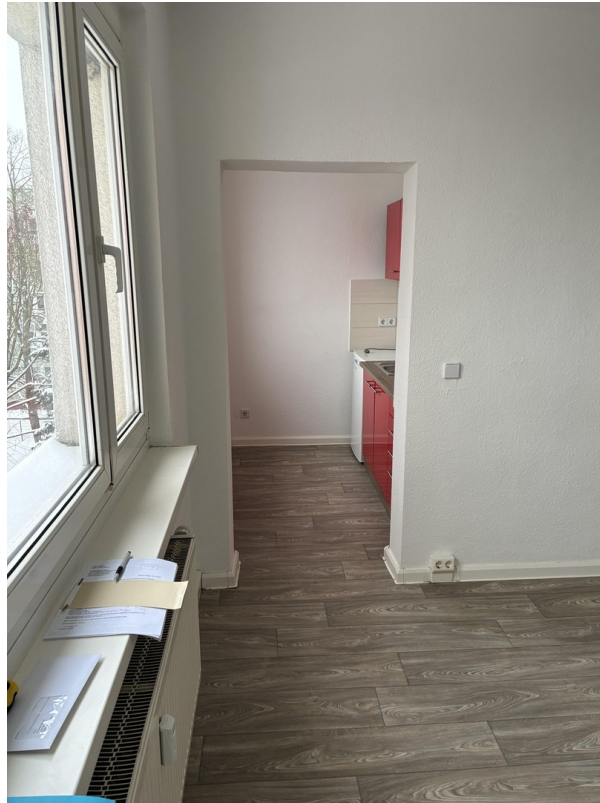
Blick in Richtung Küche