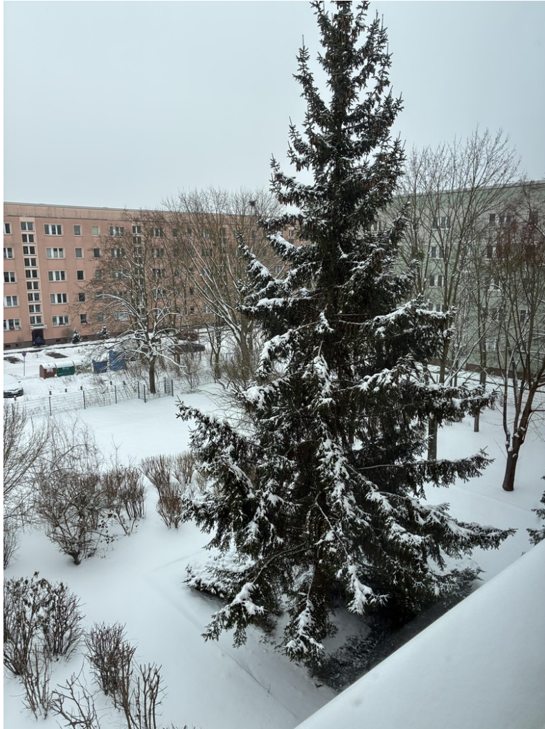
Blick in den winterlichen Hof