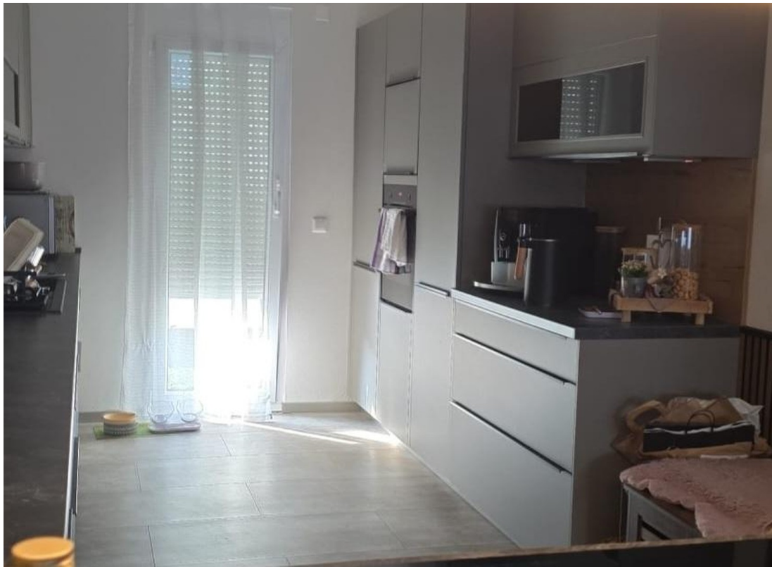
Küche rechte seite