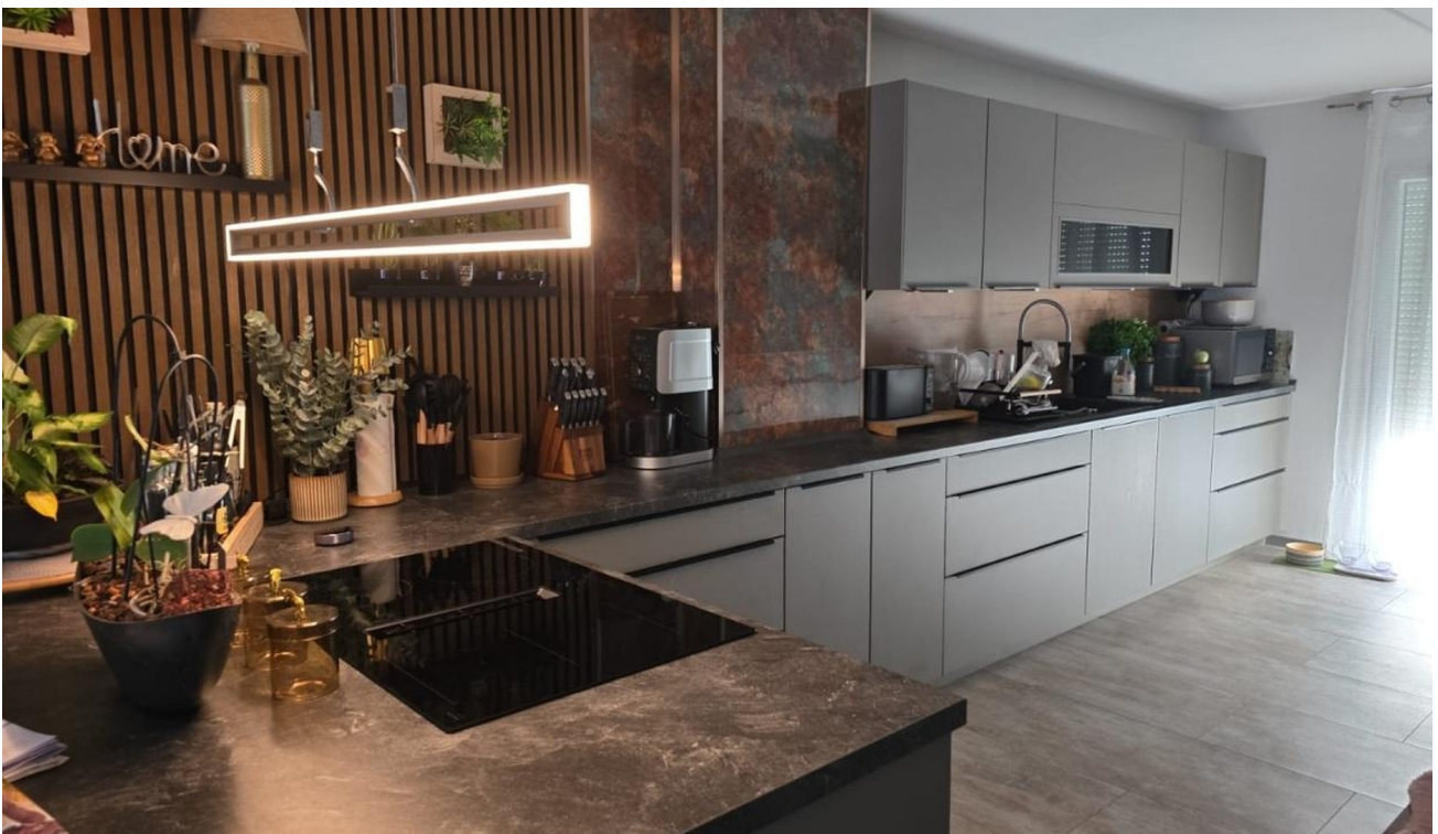
Küche linke seite