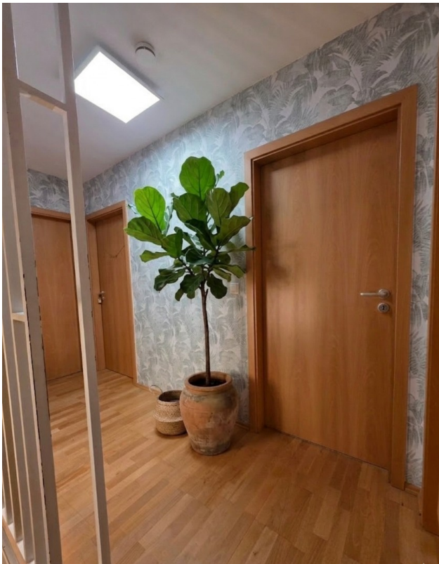
Flur 1 OG