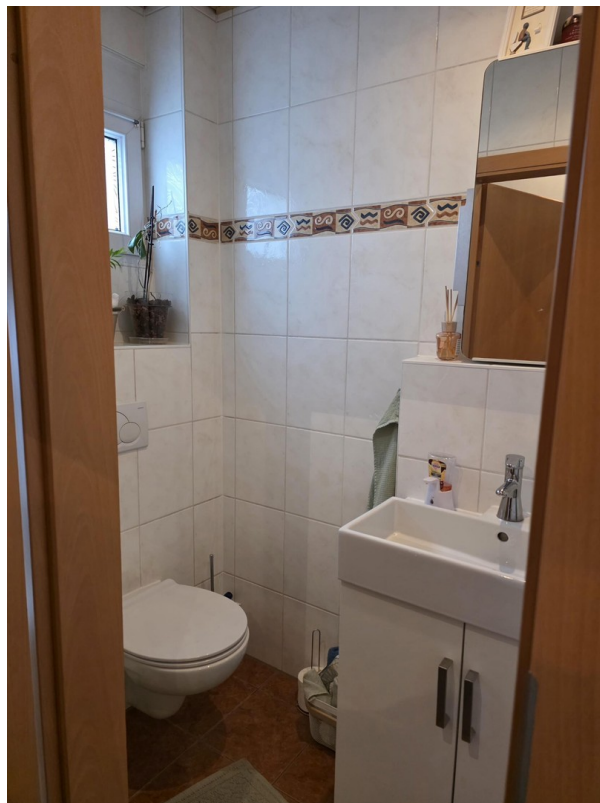
Gäste WC EG