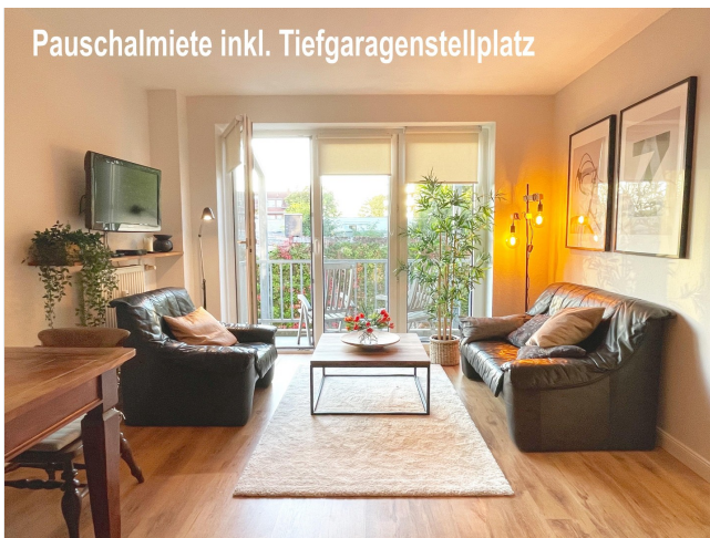
Pauschalmiete inkl. Tiefgaragenstellplatz