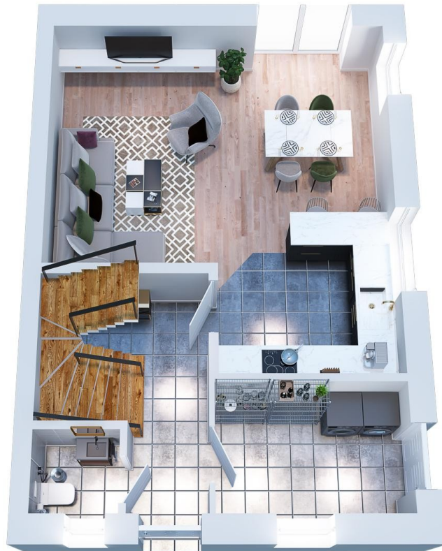
3D Ansicht EG