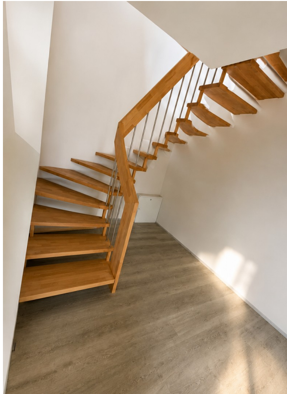
Hochwertige Treppe in das OG