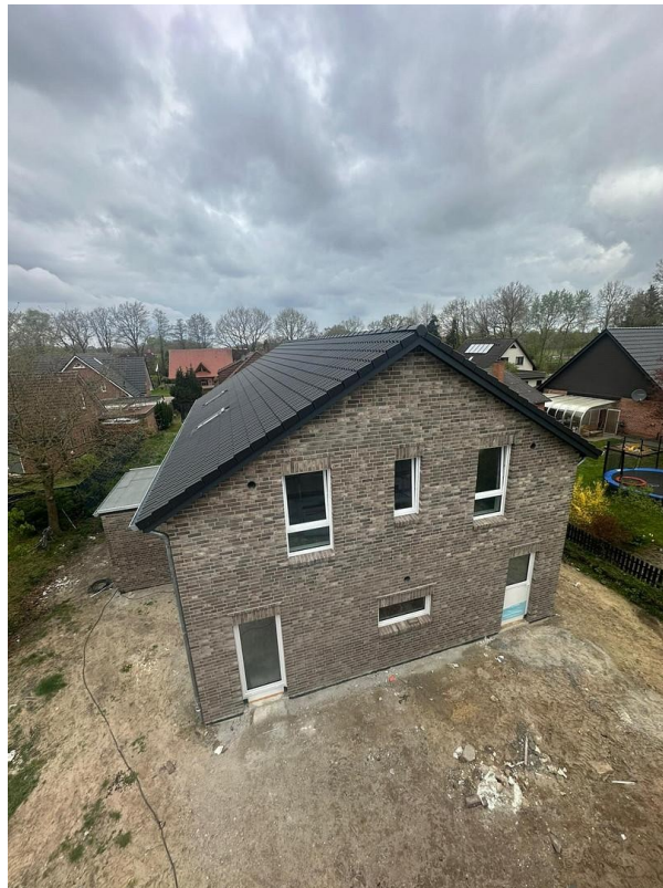
Objekt von oben