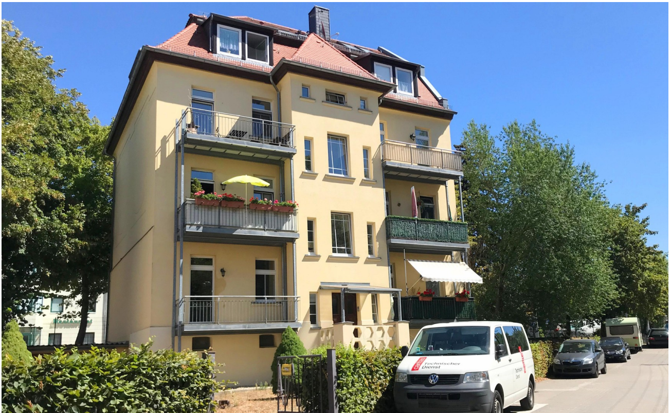
Haus von außen