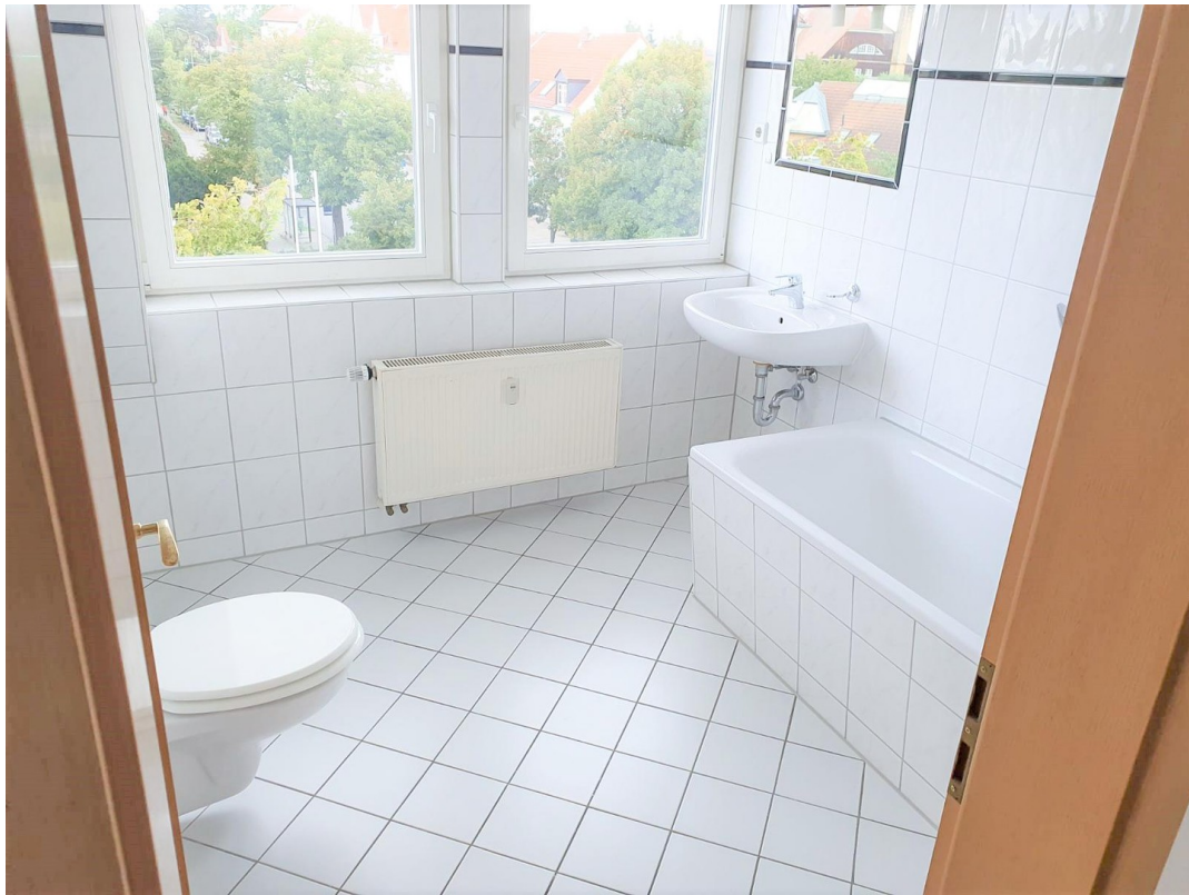
Badezimmer mit Tageslicht