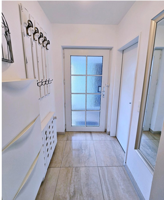
Eingangsbereich / Flur