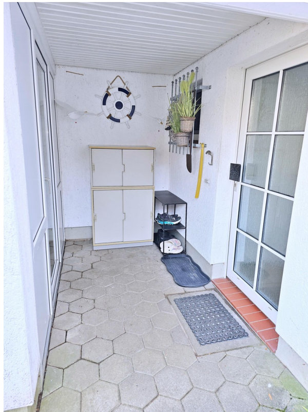
Eingangsbereich Schuppen Haus