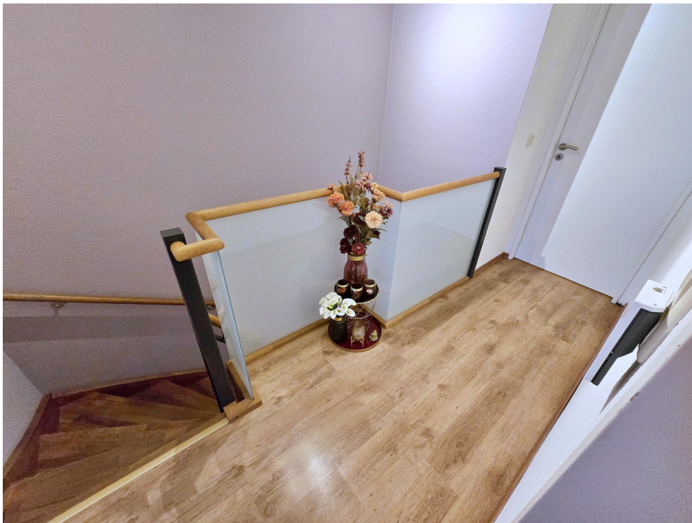
Flur / Treppe OG