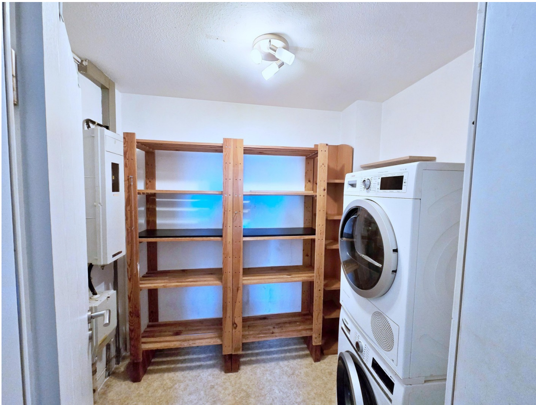
Waschküche / Abstellraum