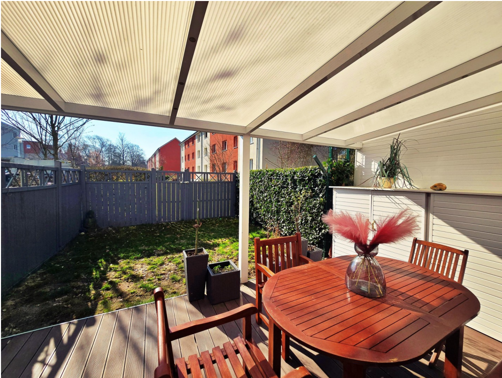
Terrasse / Garten