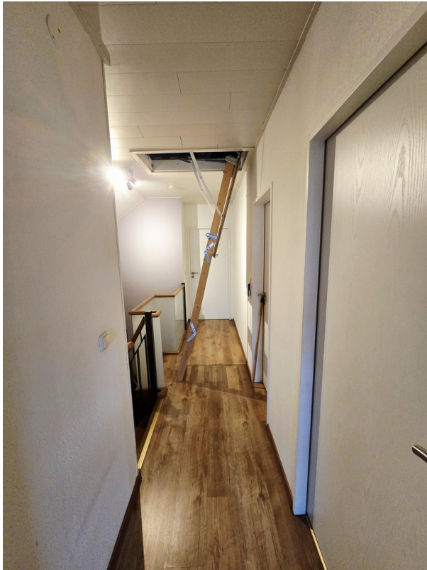
Flur OG / Leiter Dachgeschoss