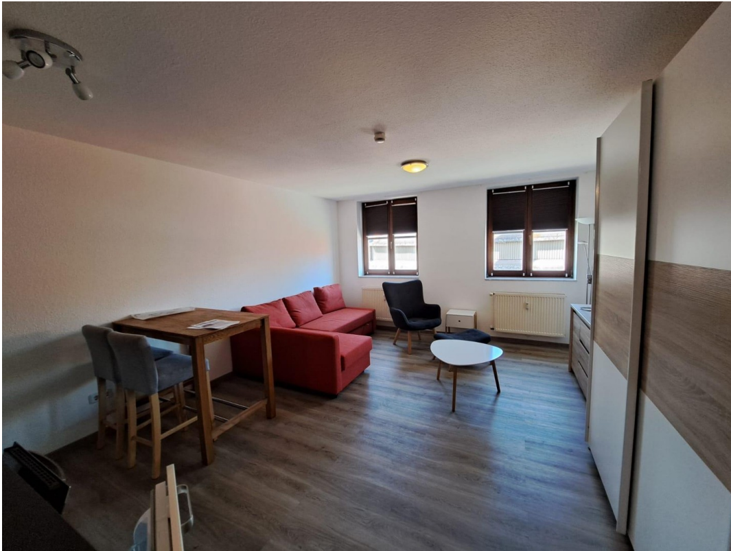
Blick zum Fenster