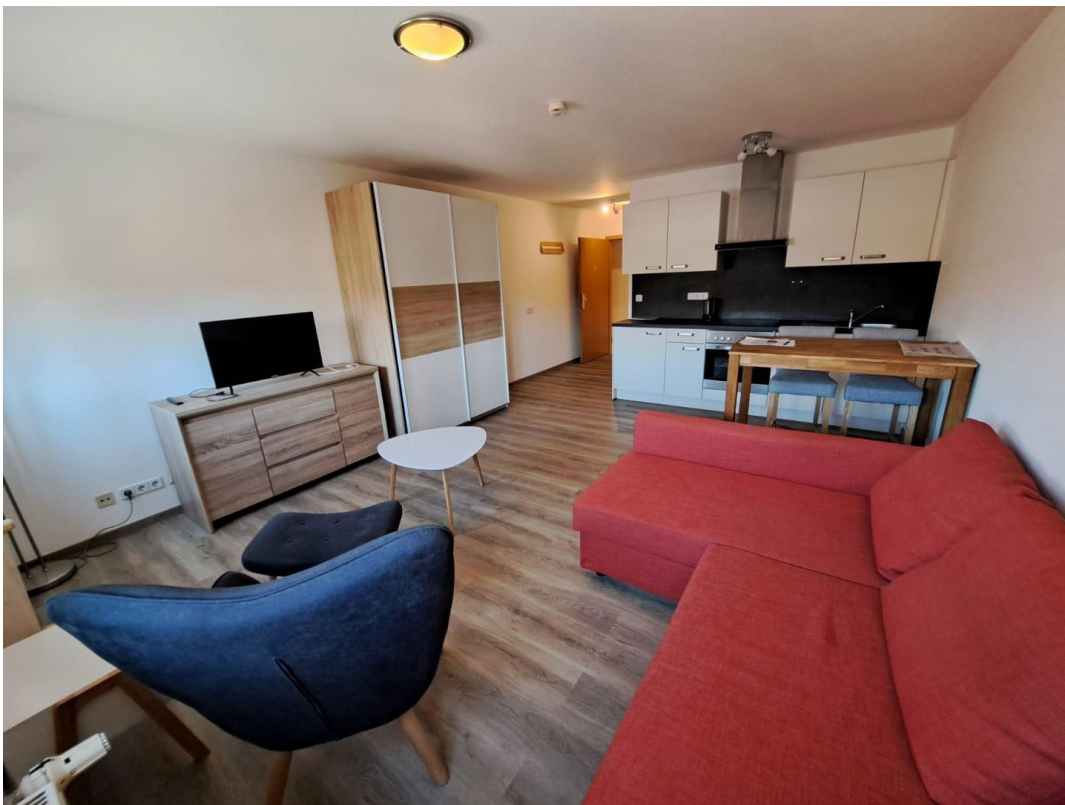
Blick zum Eingangsbereich