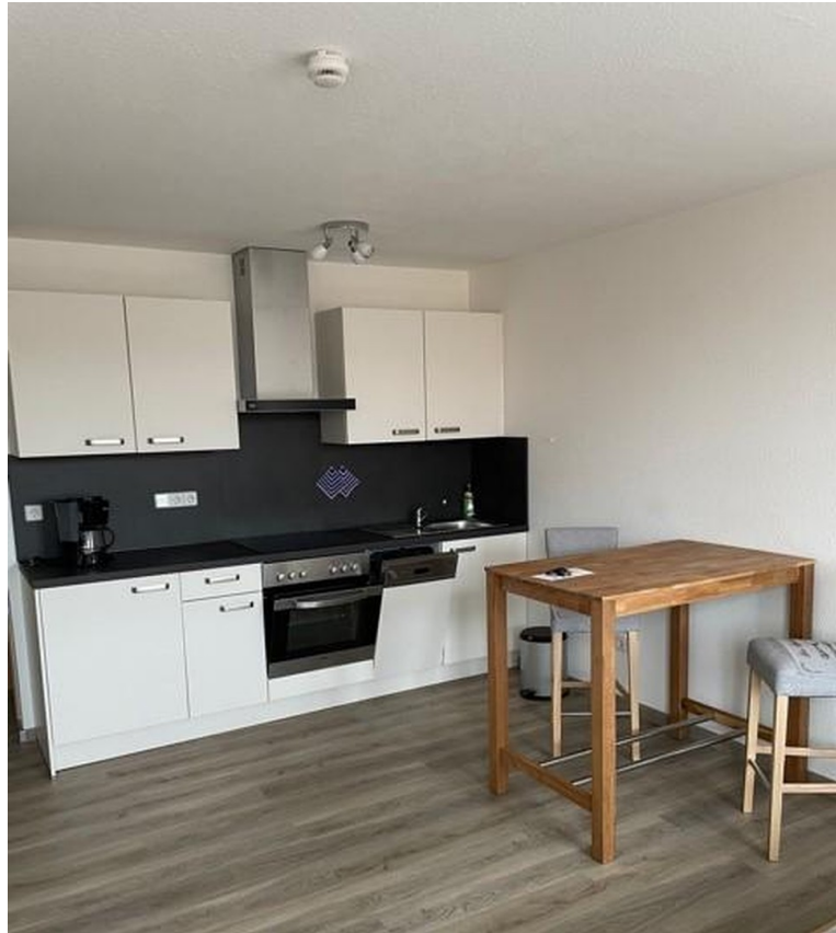
Esstheke / Sitztheke