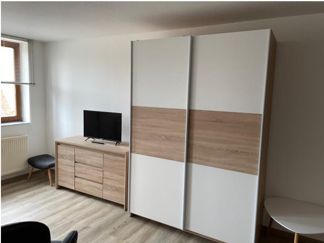
Schrank und Komode