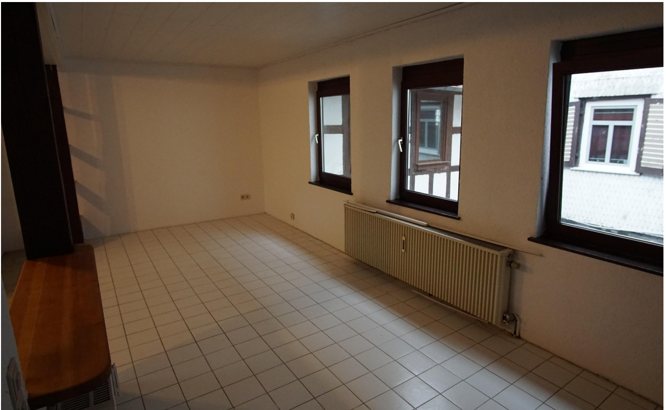
Raum neben Küche