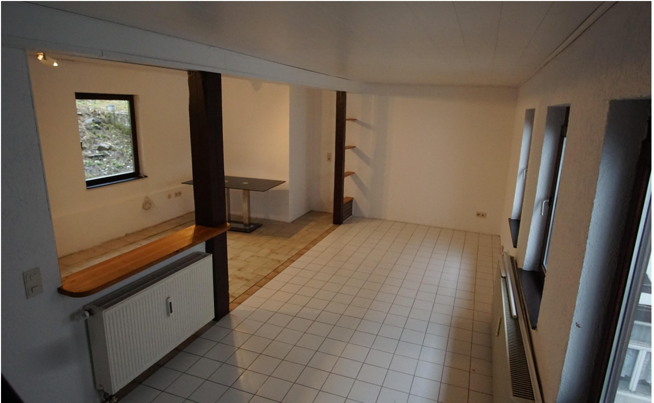
Raum neben Küche