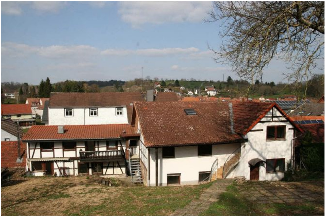
Blick aus dem Garten