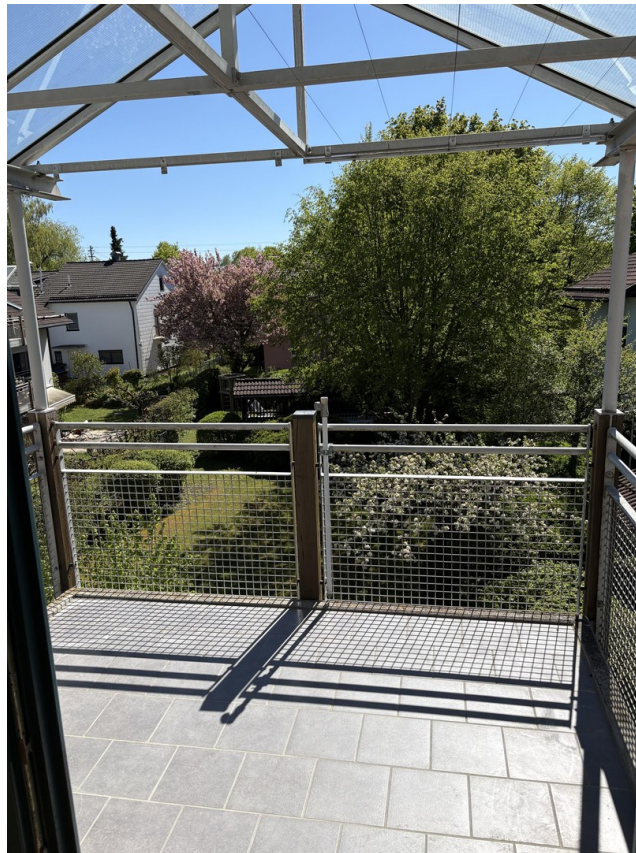
den Tag sacken lassen