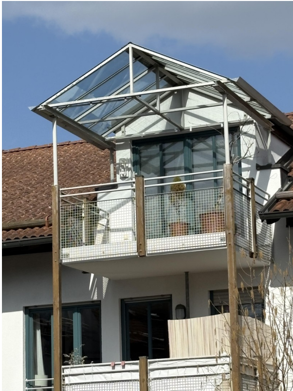
Freisitz für eine angenehme Ze