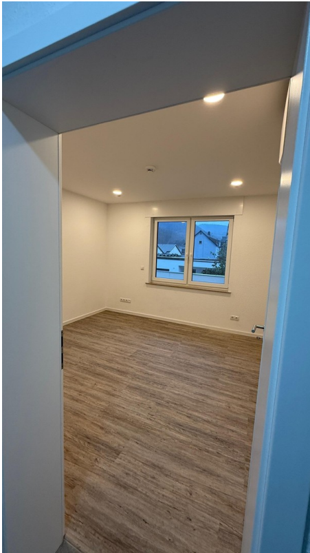
Büro / Kind / Schlafen