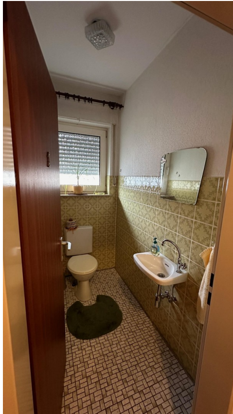
vor der Sanierung - 2024