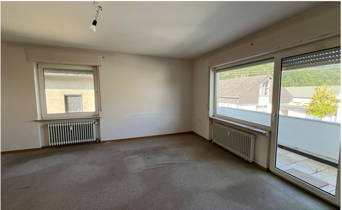
vor der Sanierung - 2024