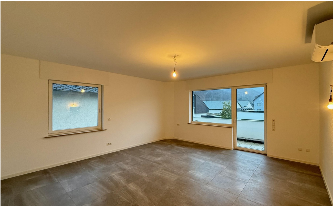
Wohn- / Esszimmer