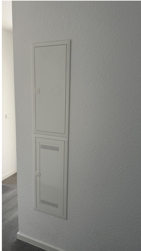
Strom- & lokales Netzwerk