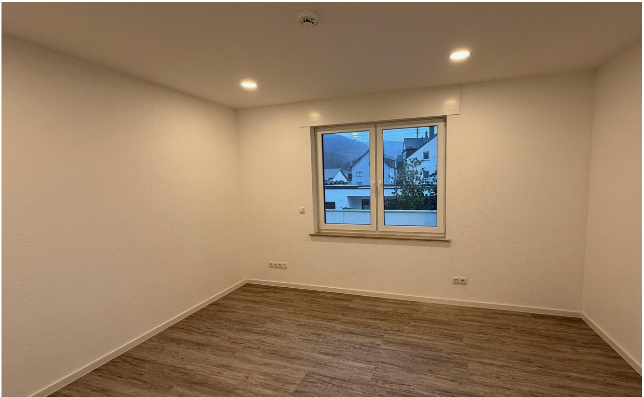
Büro / Kind / Schlafen