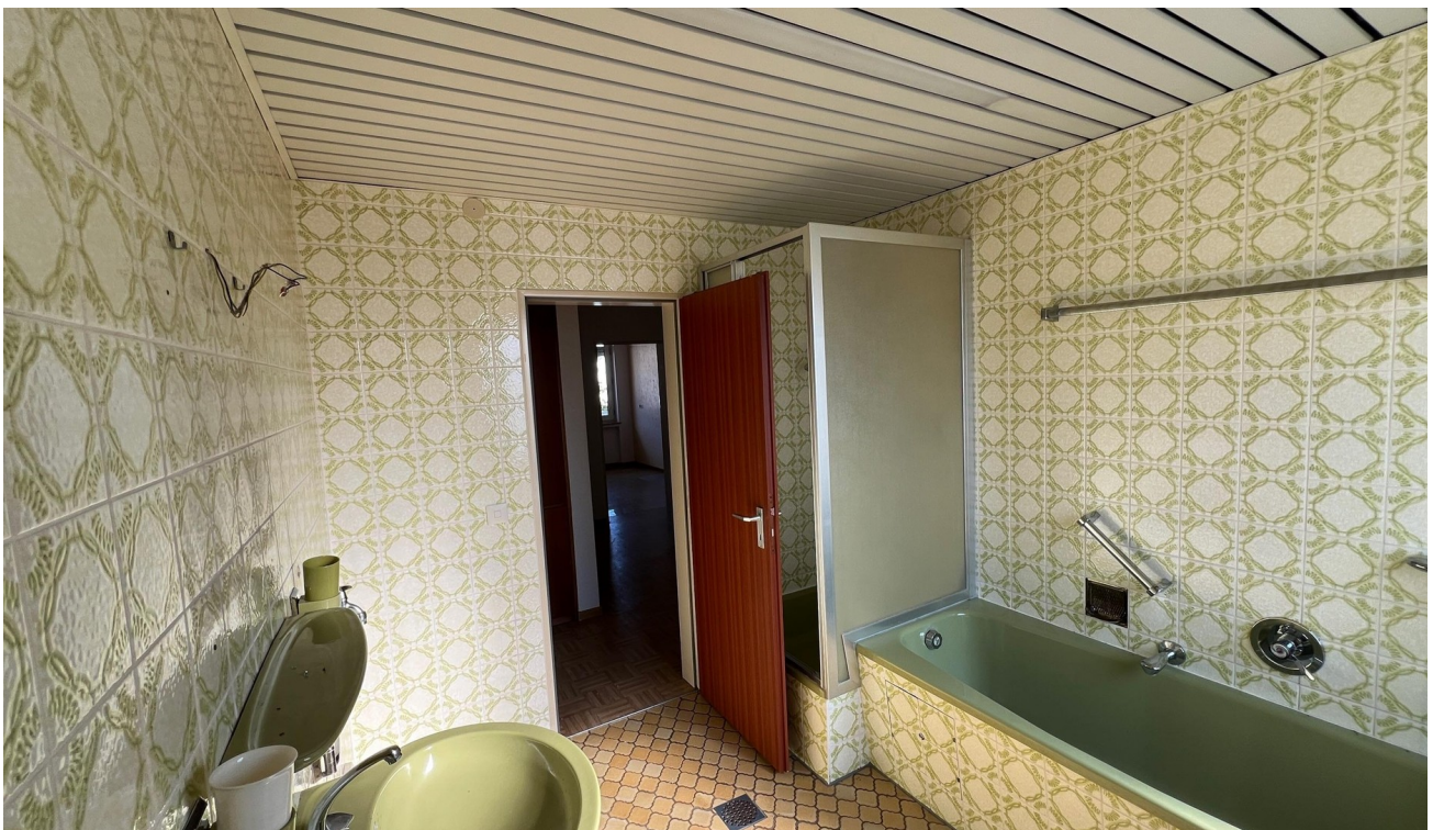
vor der Sanierung - 2024