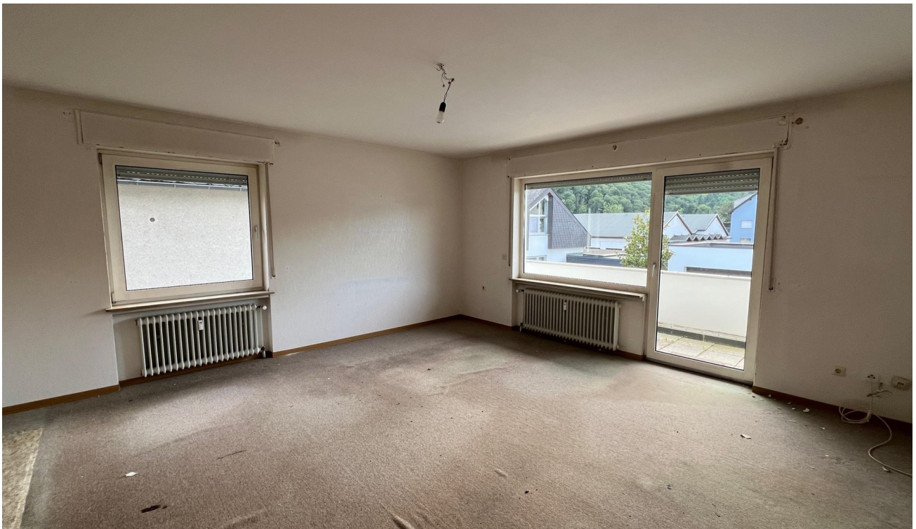
vor der Sanierung - 2024