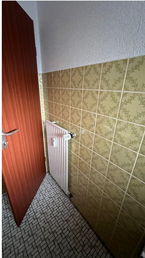
vor der Sanierung - 2024