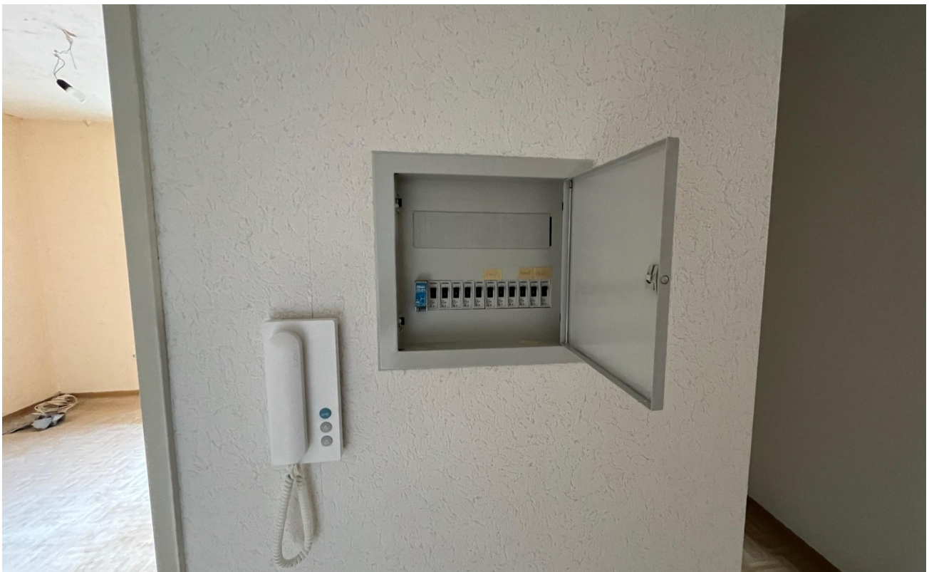
vor der Sanierung - 2024