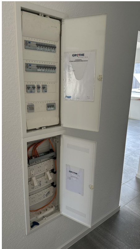
Strom- & lokales Netzwerk