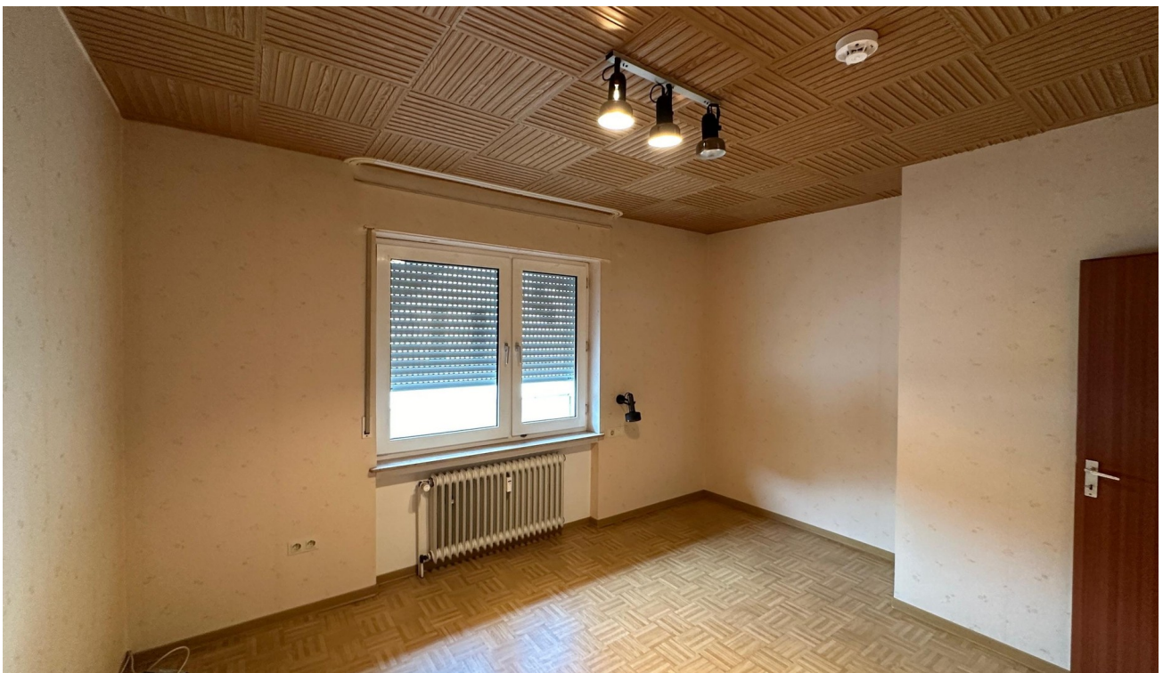
vor der Sanierung - 2024