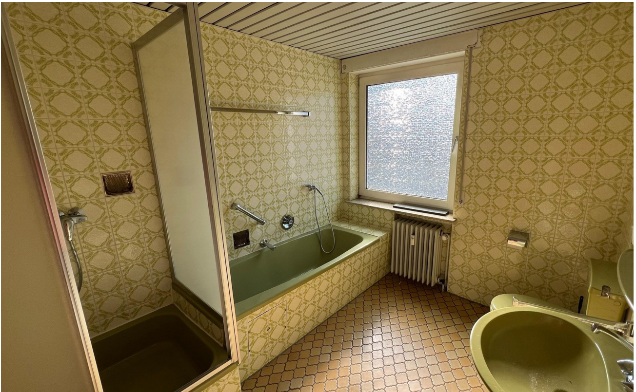
vor der Sanierung - 2024