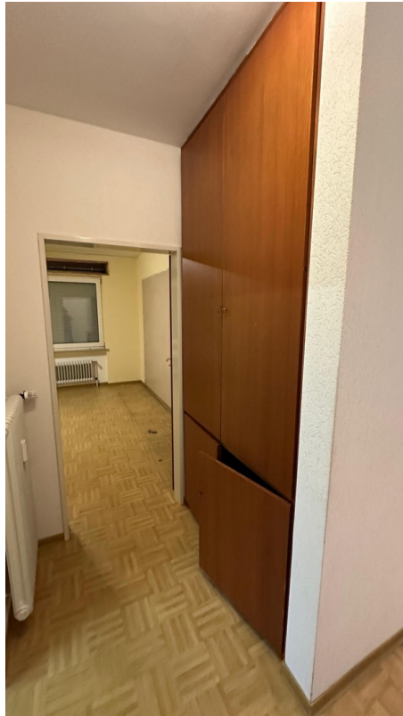
vor der Sanierung - 2024