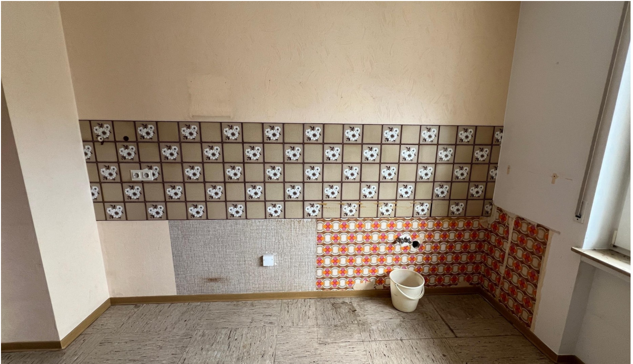
vor der Sanierung - 2024