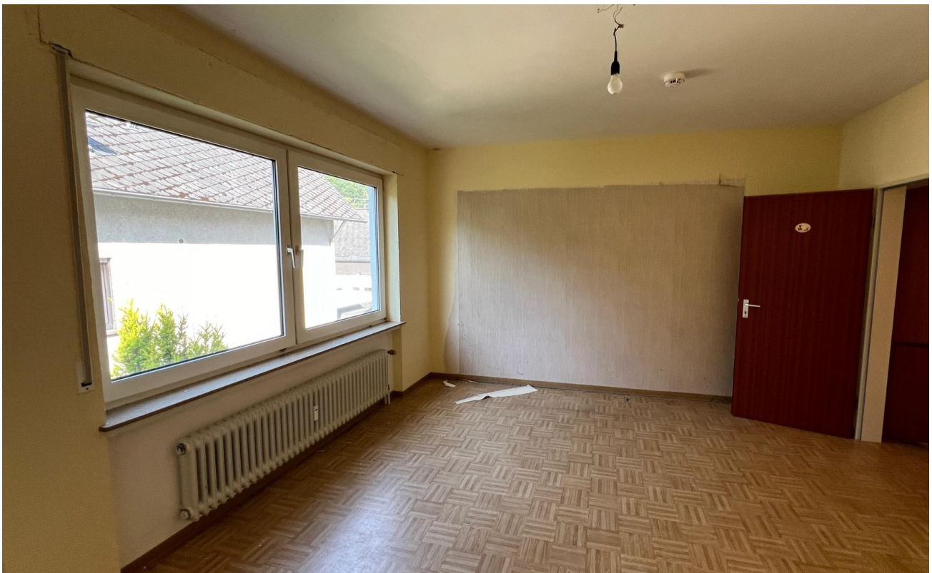
vor der Sanierung - 2024