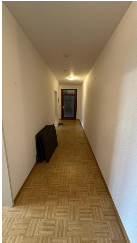
vor der Sanierung - 2024