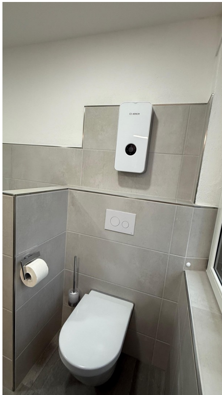
Bad - Toilette