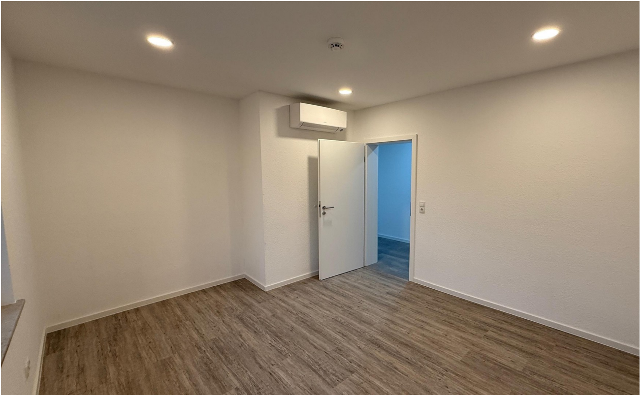
Büro / Kind / Schlafen