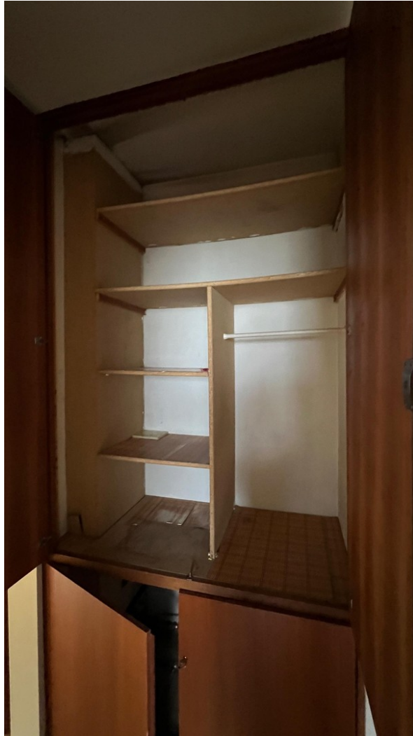
vor der Sanierung - 2024