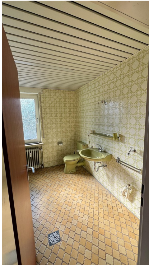
vor der Sanierung - 2024