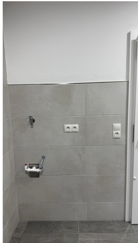
Bad - Trockner / Waschen