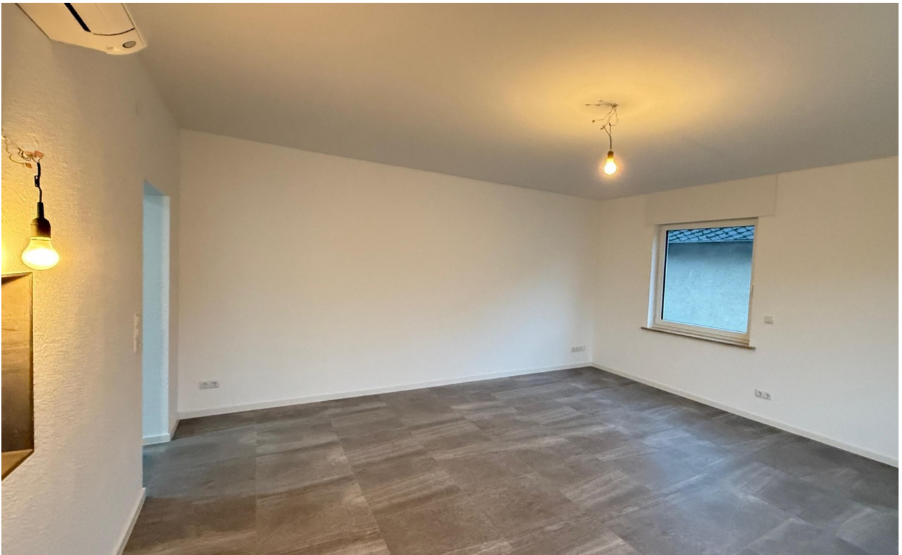
Wohn- / Esszimmer