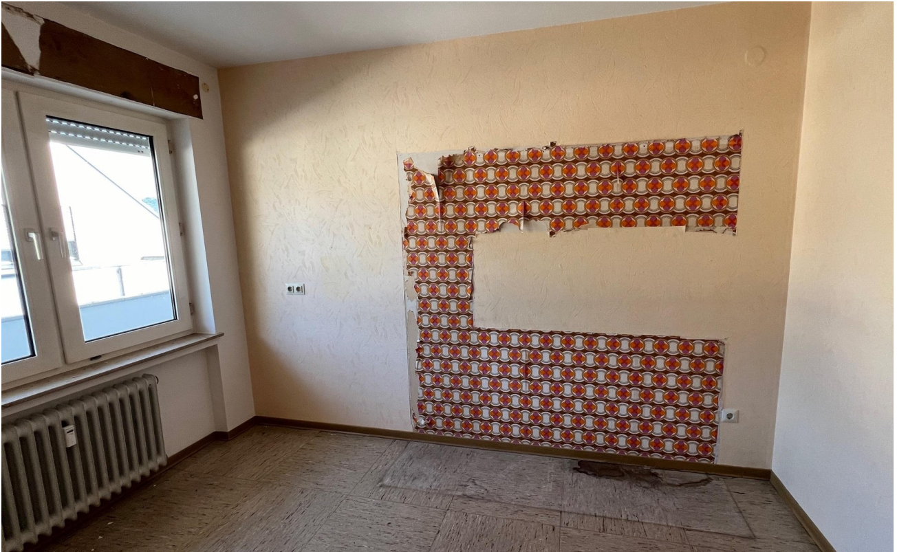
vor der Sanierung - 2024