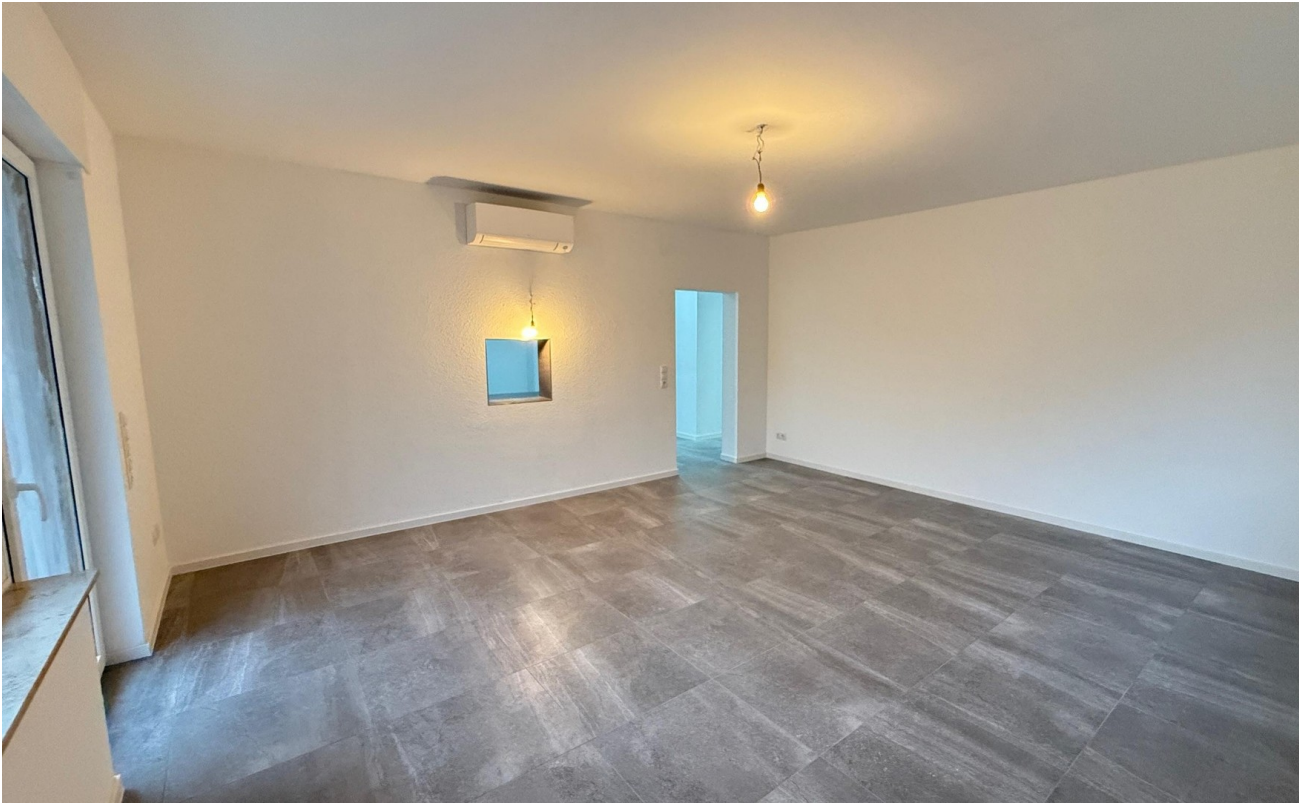
Wohn- / Esszimmer