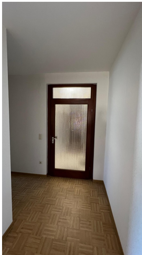
vor der Sanierung - 2024