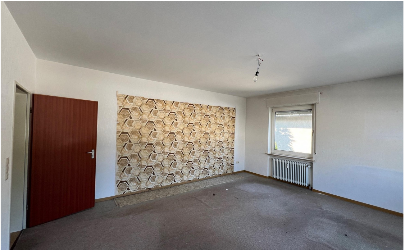
vor der Sanierung - 2024