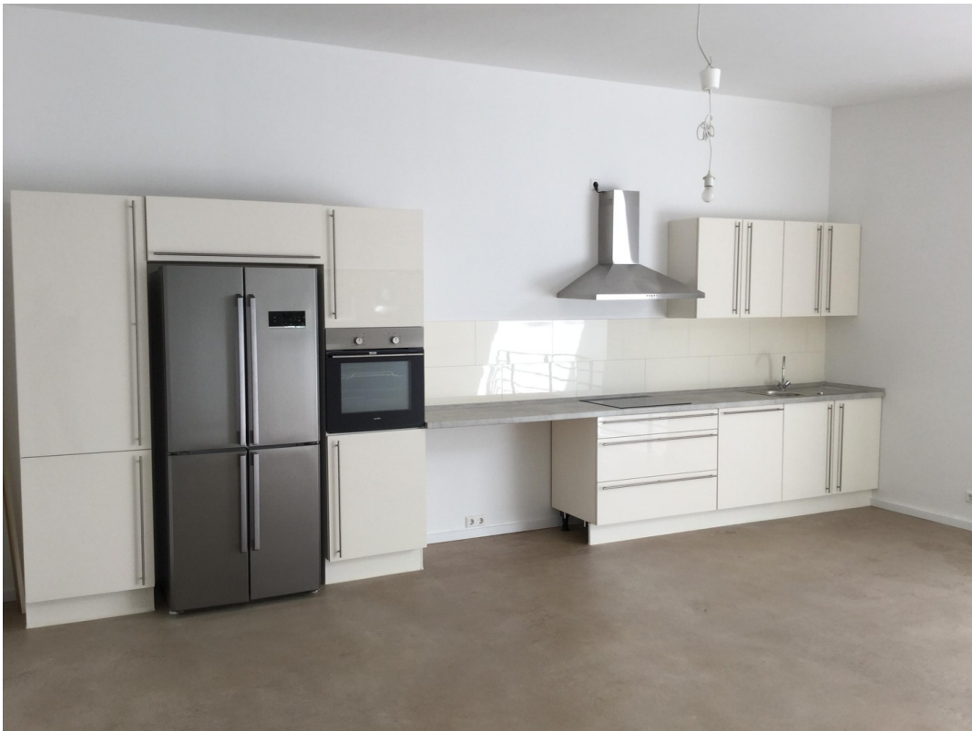
Küche ohne Paravent