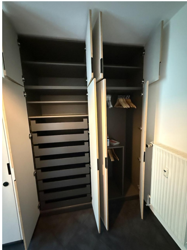
Stauraum ohne Ende