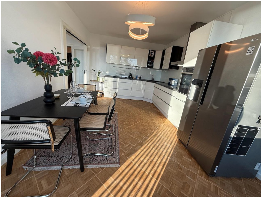
Küche mit Esstisch