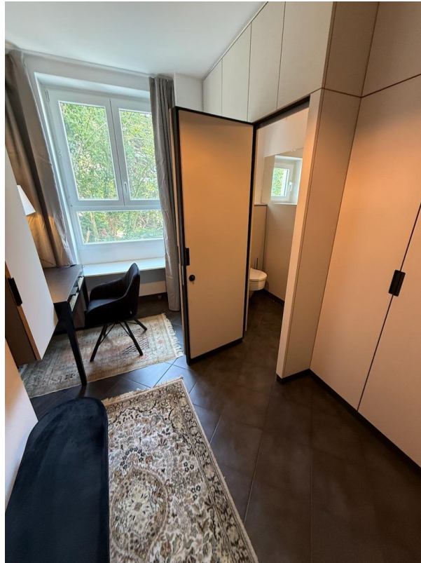
Zugang zum Gästebad