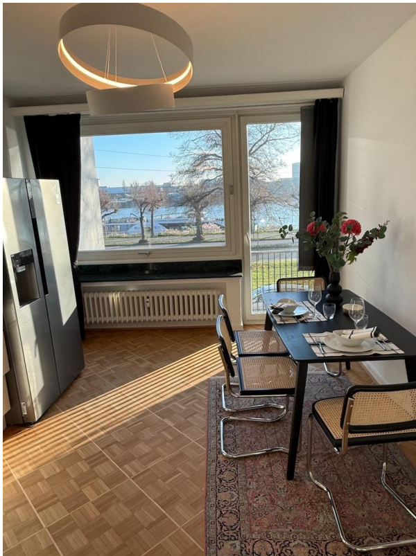
Ausblick auf den Rhein