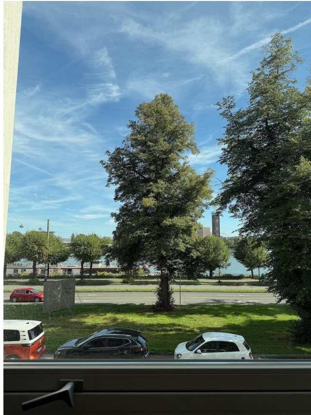
Ausblick auf den Rhein