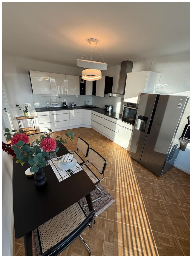
Küche mit Esstisch