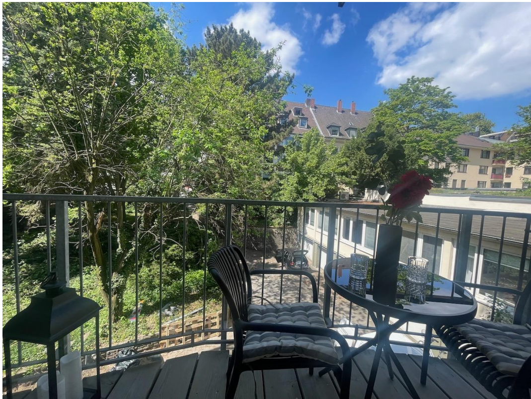
Balkon zum grünen Innenhof