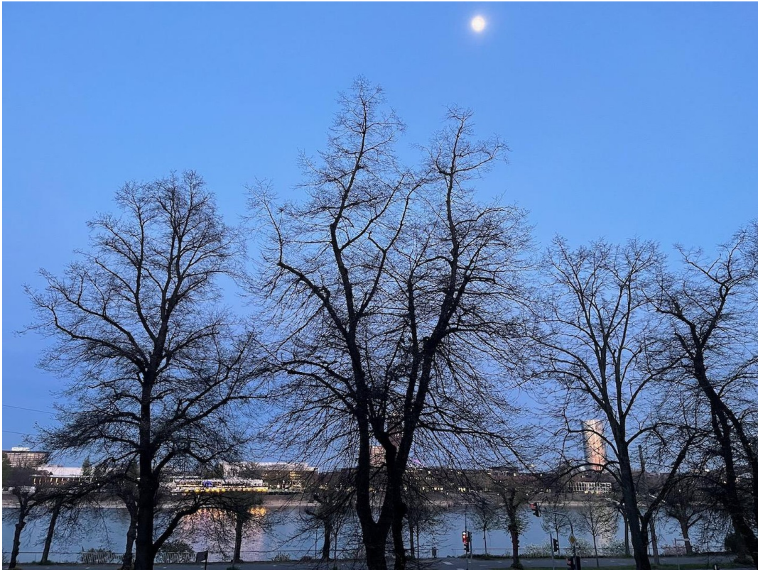
Der Rhein am Abend