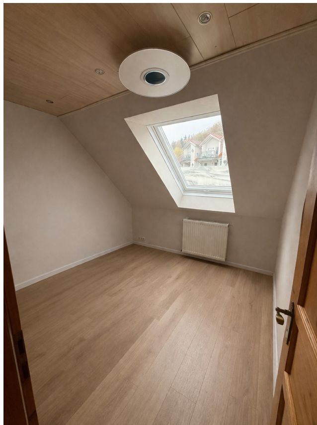
Gäste- / Ankleidezimmer