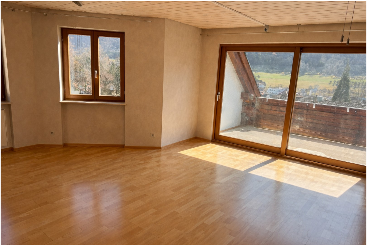
Wohnzimmer mit Erker