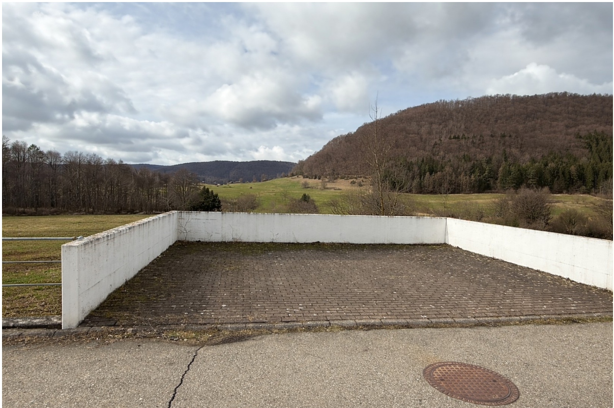
Stellplatz auf Garagendach