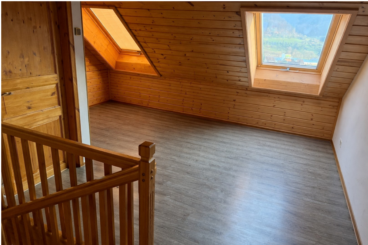
Galerie /z.B. als Büro nutzbar