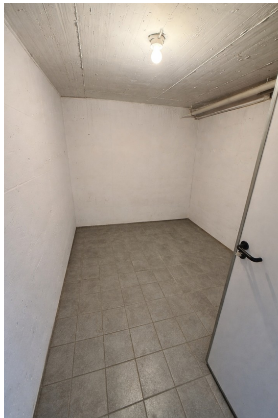
Keller mit Waschm.-Anschluss