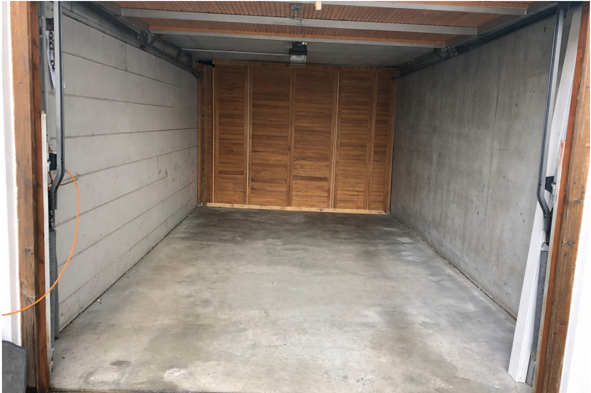
Garage mit Drehstromanschluss