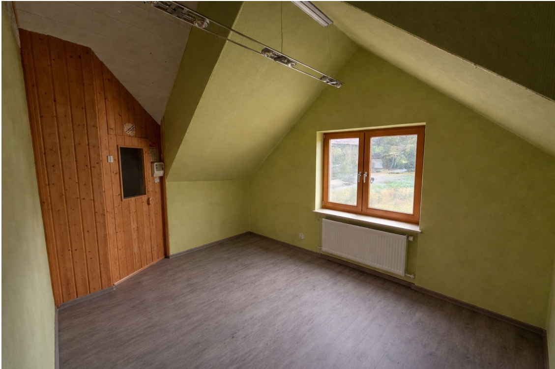
Fitnessraum mit Sauna