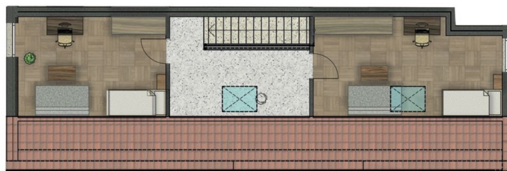
Grundriss „Wohnung 8“ im Dachgeschoss