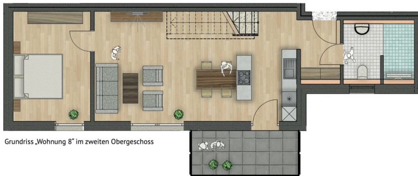
Grundriss „Wohnung 8“ im zweiten Obergeschoss