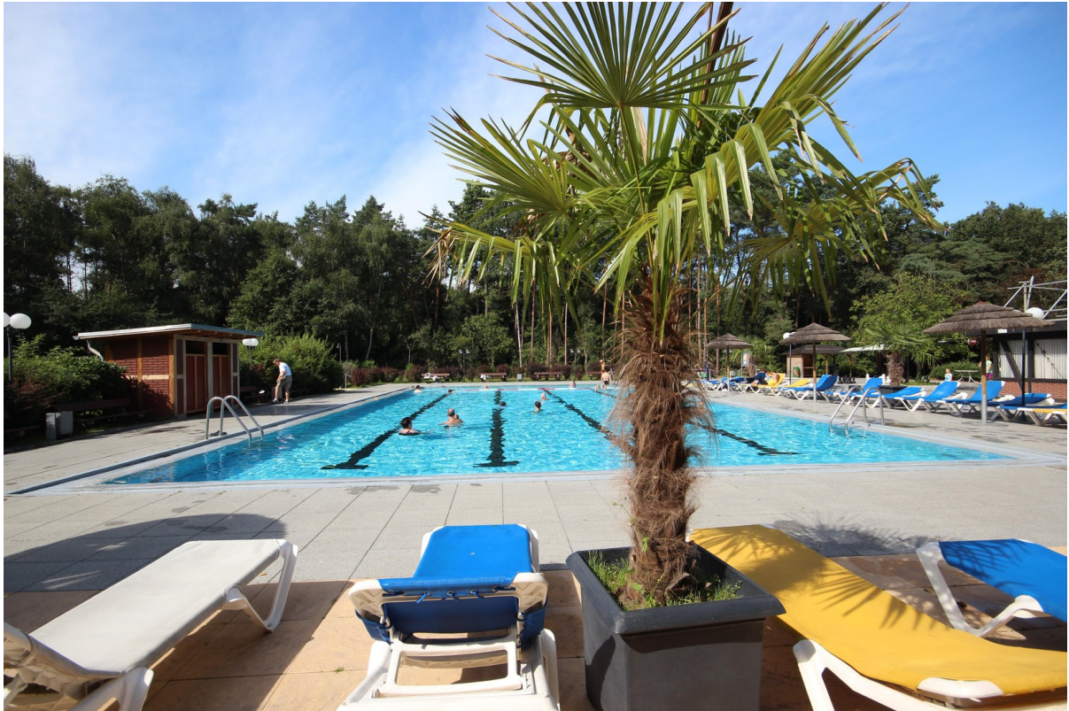
Pool 28 Grad warm