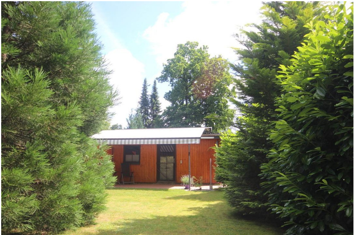
Natur ist angesagt