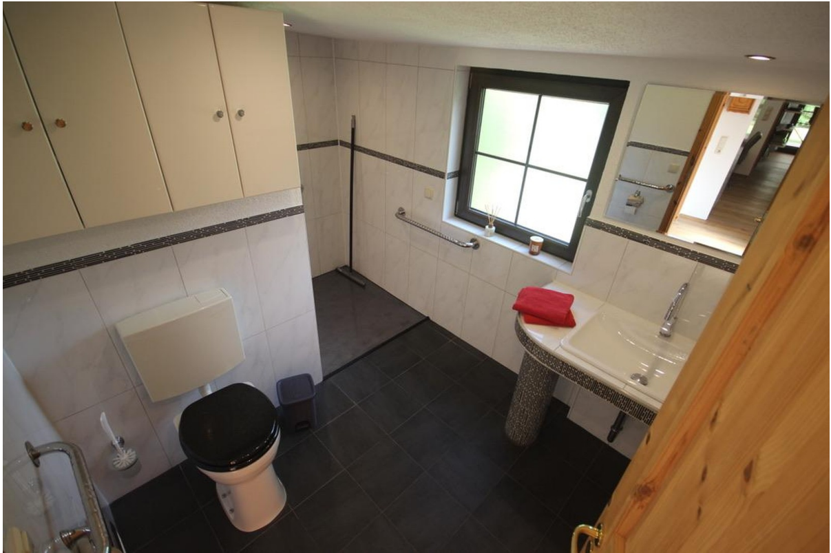
Bad / Rollstuhlgerecht