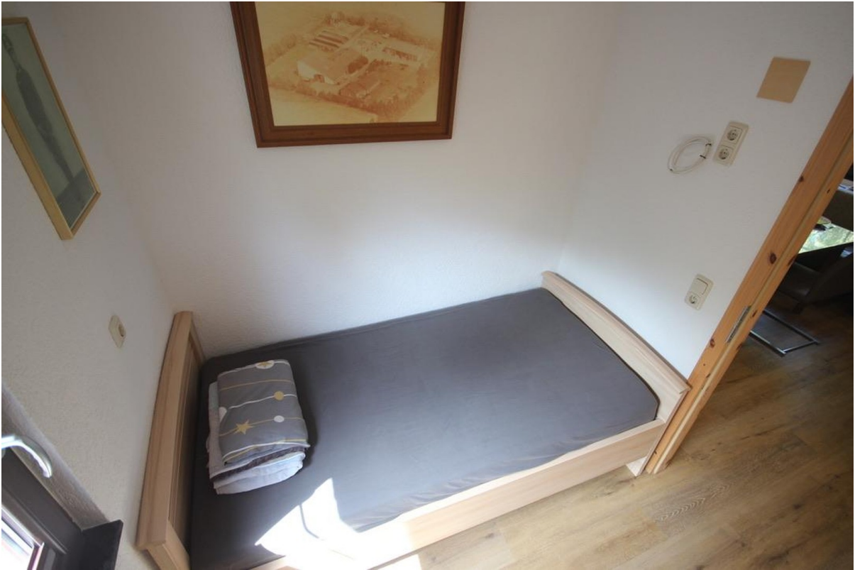
Gästezimmer oder Büro