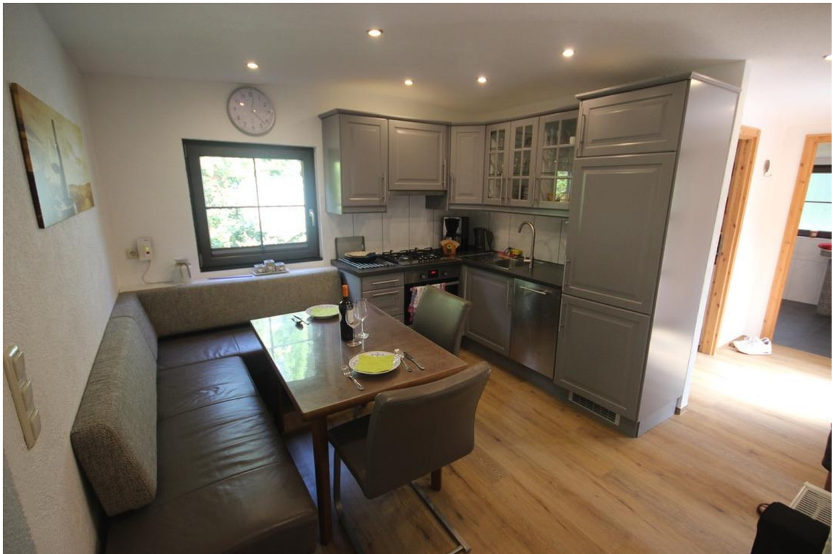
Essecke de Luxe