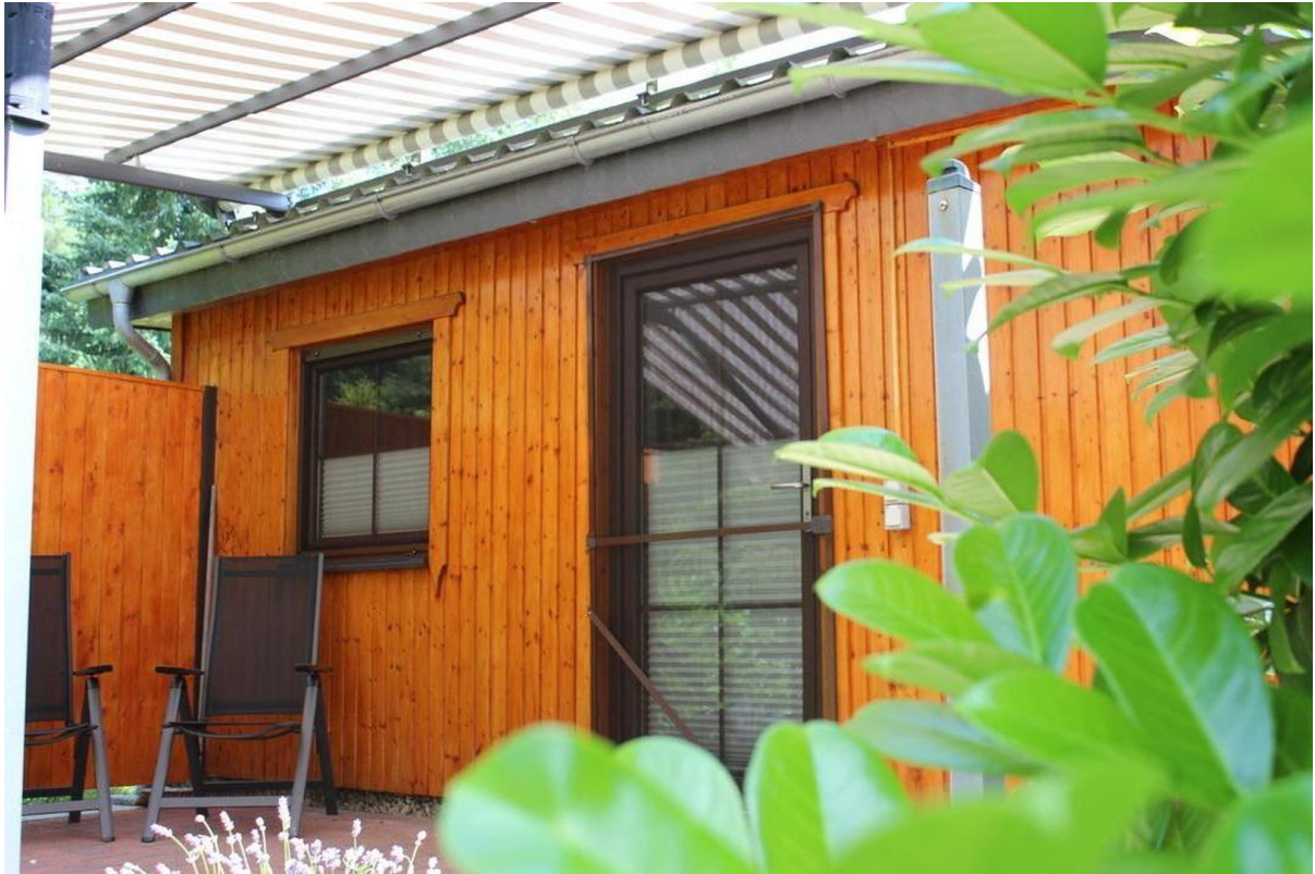
Terrasse №2 Eingangsbereich