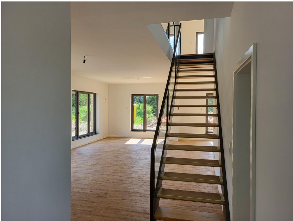
Innentreppe Eiche gewachst