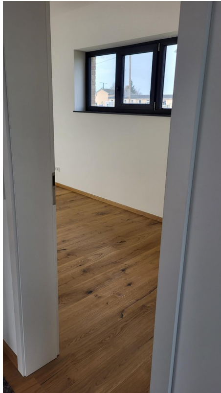
EG - Gäste- Zi.