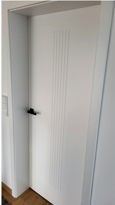
Innentüren ohne Schlüssell.