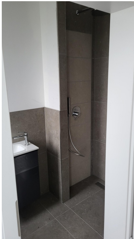
Dusche Gäste- WC