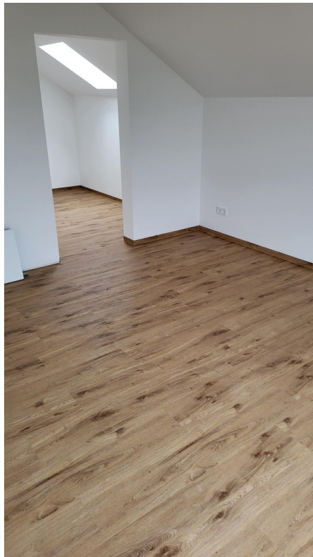
SZ mit Ankleide