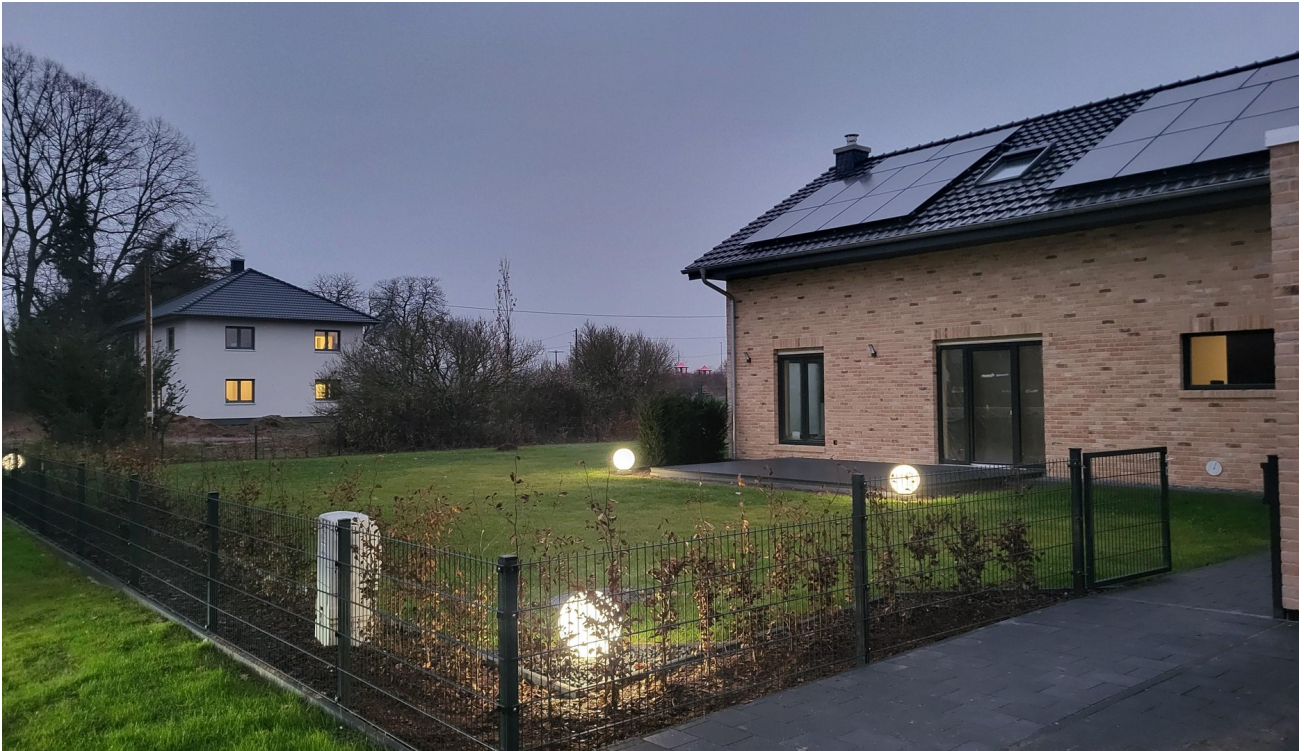
Terrasse mit Außenbeleuchtung