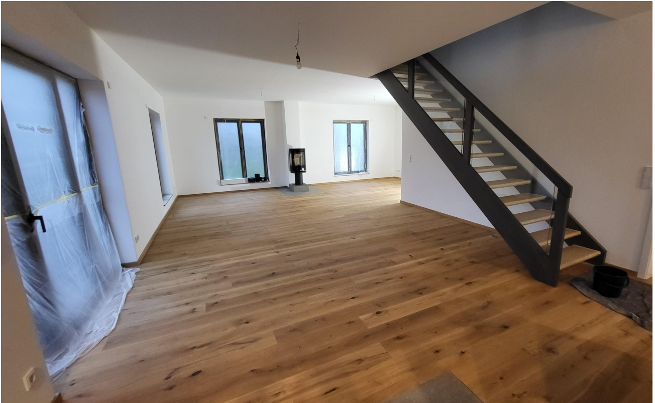
Essen - Eichentreppe