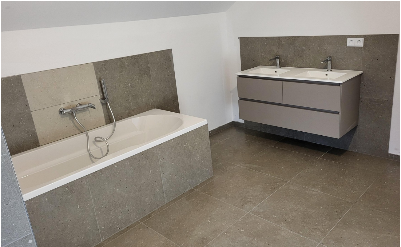
Wanne - 2 Waschtische