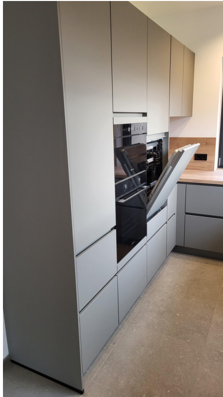
Einbau- GS & - mikrowelle