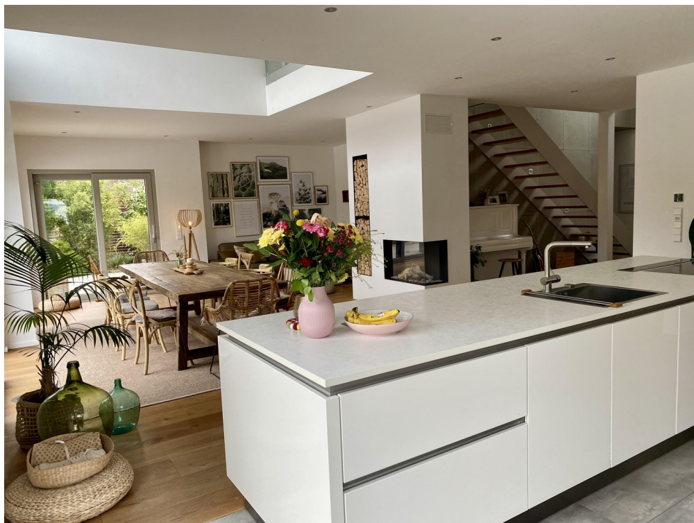
Blick von der Küche in Wohnber