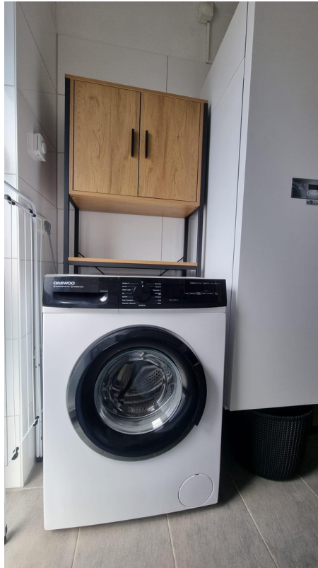
Waschmaschine mit Wäschekorb