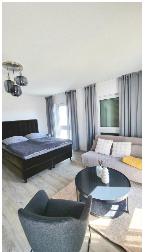
Bett mit Sitzecke