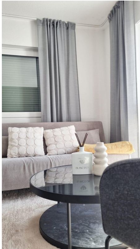
Schlafsofa für 2 Personen